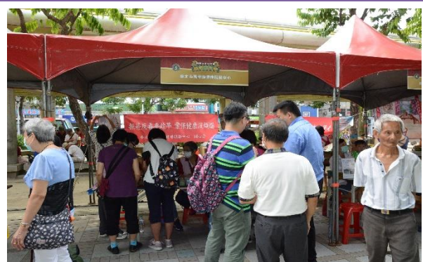
臺北市萬華區健康服務中心