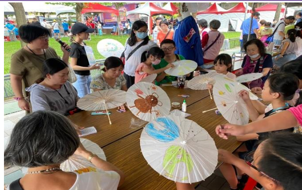
臺北市政府客家事務委員會