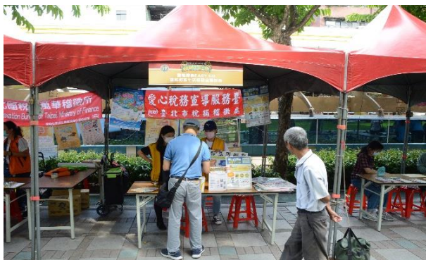
臺北市稅捐稽徵處萬華分處