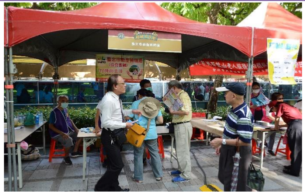
臺北市動產質借處