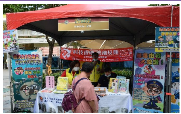
臺北市警察局萬華分局