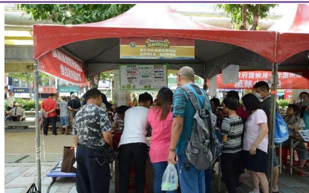
臺北市政府環境保護局