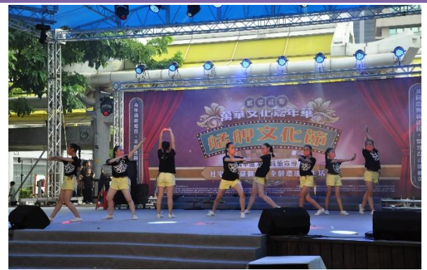
雙園國中藝術才能舞蹈班