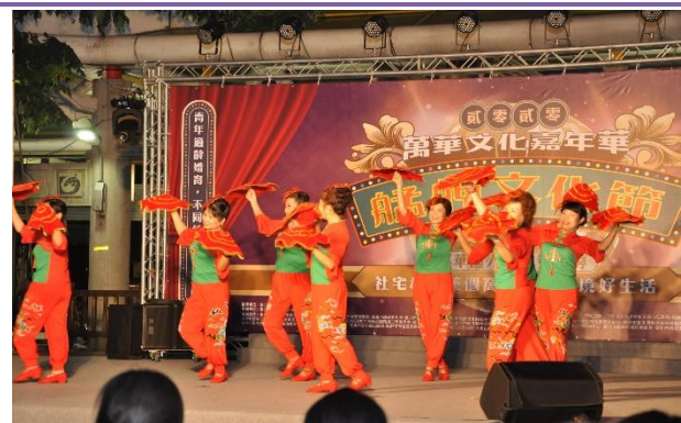
和德里-慈悲祥和舞團