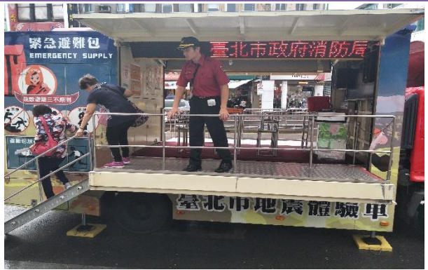
消防局-地震車體驗