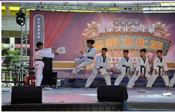
龍山國中跆拳道隊

藝術的種子再次透過文化節搭建的展演平台，深深扎根，持續累積推動萬華文化經濟發展的能量。