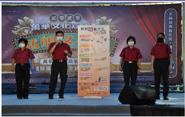
臺北市政府消防局-社區防災有獎徵答