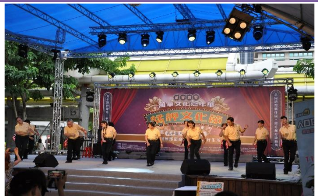
富福里-萬華樂學隊