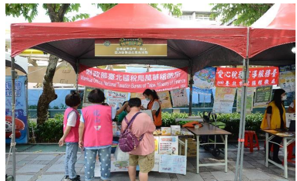
臺北國稅局萬華稽徵所