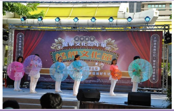
孝德里-孝德里姊姊妹妹舞蹈團