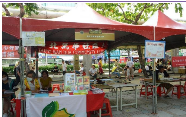
臺北市萬華社區大學