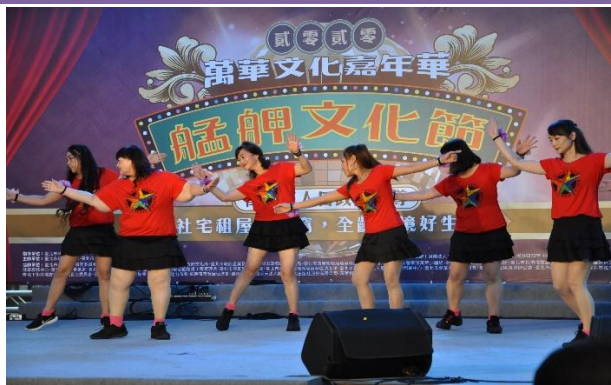
新起里-新起里排舞隊