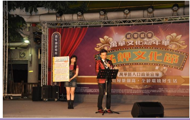
人口政策政令宣導