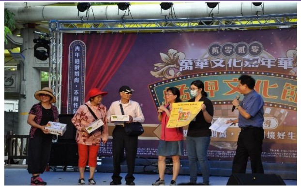
萬華區健康服務中心-營養政令宣導