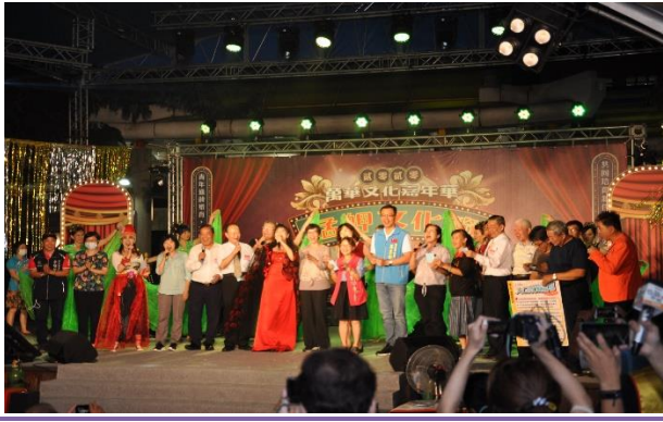
來賓與歌手一起合唱