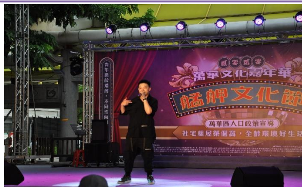
人口政策宣導-饒舌歌手哈士奇