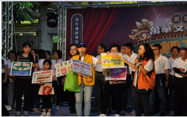
國稅局萬華稽徵所、萬華區稅捐稽徵處 有獎徵答