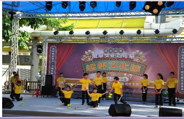
華江國小華江扯鈴隊