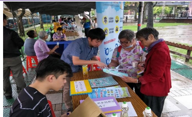
臺北市政府產業發展局