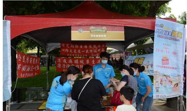
萬華區公所-民政業務宣導