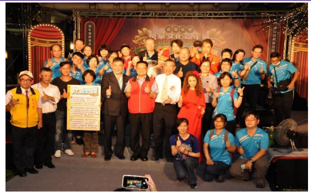
區長、工作人員與歌手大合照