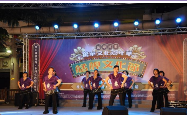
福星里 台北市世界運動舞蹈協會福星分隊

為提升艋舺觀光能見度，本次活動持續舉辦為期兩日，結合周邊商圈、飯店共同行銷，不僅有本區各機關與市民生活息息相關的宣導攤位，如臺北市政府客家委員會手作DIY 宣導客家文化、財政部臺北國稅局萬華稽徵所及臺北市稅捐稽徵處萬華分處聯合辦理的賦稅新知宣導、臺北自來水事業處的家戶節水宣傳，以及消防局的社區防災體驗等，更有來自民間團體例如大興出版社、龍山商場及龍山老人服務中心等等的互動攤位活動，希望讓參與民眾更親近、了解萬華。