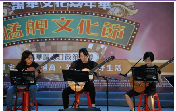
萬華社區大學古典吉他社