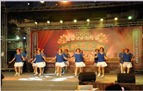
和平里-和平長青韻律舞