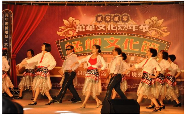
菜園里-大世紀排舞社