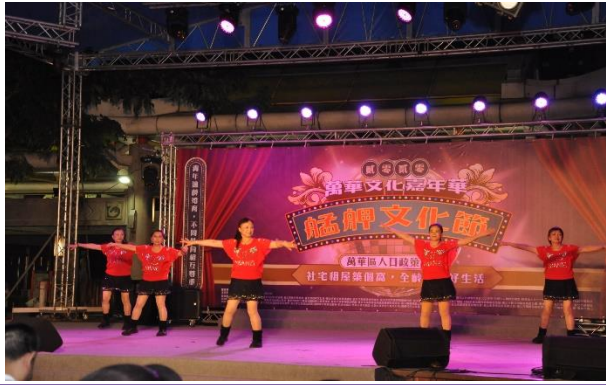
富福里-健康舞蹈班