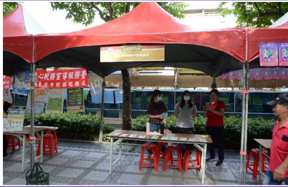
臺北市萬華區戶政事務所