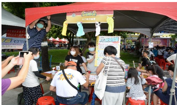
萬華區公所-人口政策宣導