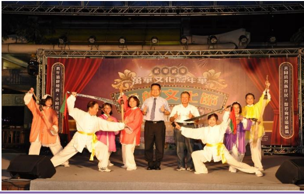
富福里-松華太極學苑