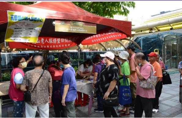
臺北市萬華龍山老人服務 暨日間照顧中心