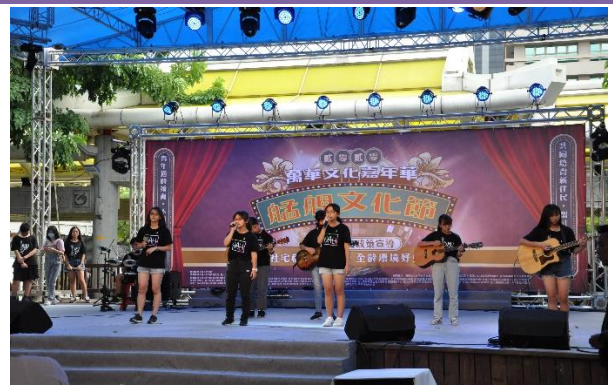
大理高級中學(國中部)熱音社