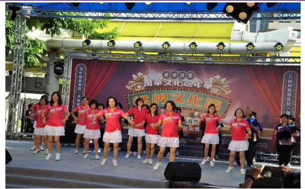
福音里-舞克拉樂齡舞團