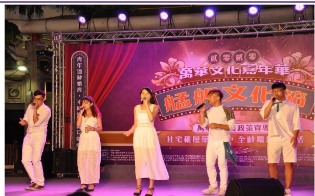
客家事務委員會 Resonance 留聲樂團