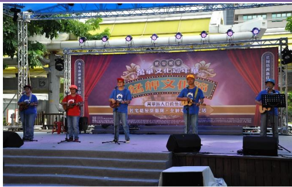
台北市自閉症家長協會小貝殼工作坊