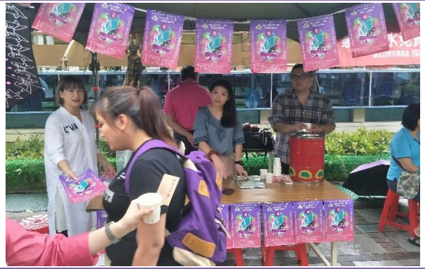
龍山商場華越文化廣場