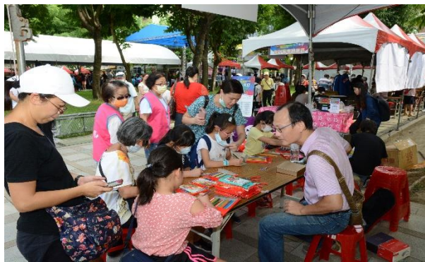
大興出版社-手作體驗