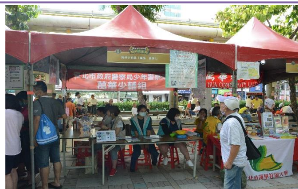
臺北市政府警察局少年警察隊少輔組