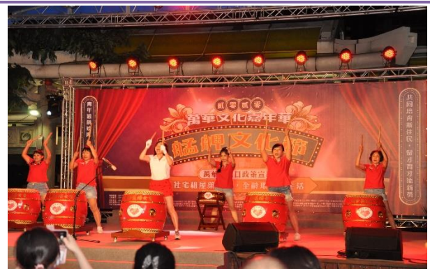
綠堤里-萬華區婦女會吉祥太鼓隊