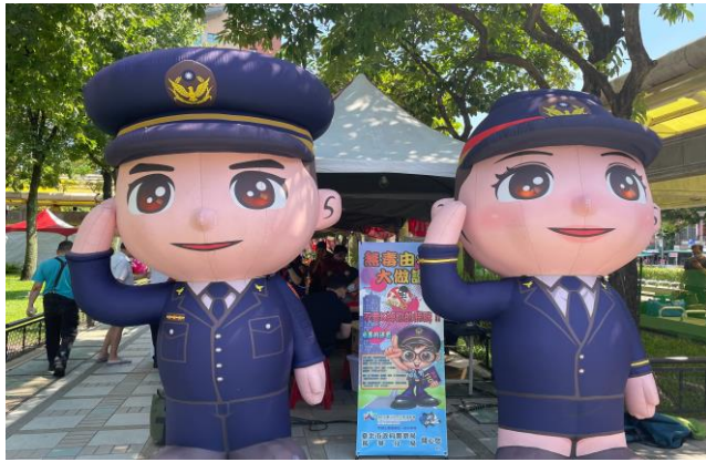
臺北市警察局長華分局

為提升艋舺觀光能見度，本次活動持續舉辦為期兩日，結合周邊商圈、飯店共同行銷，不僅有本區各機關與市民生活息息相關的宣導攤位，如財政部臺北國稅局萬華稽徵所及臺北市稅捐稽徵處萬華分處聯合辦理的賦稅新知宣導、臺北自來水事業處的家戶節水宣傳，以及消防局的社區防災體驗等，更有來自民間團體例如大興出版社、時報文化出版社、龍山商場及龍山老人服務中心等 的互動攤位活動，希望讓參與民眾更親近、了解萬華。