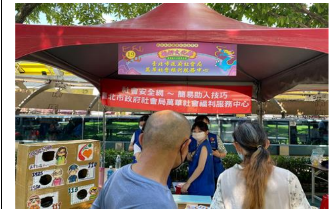
臺北市政府社會局萬華社會福利服務中心