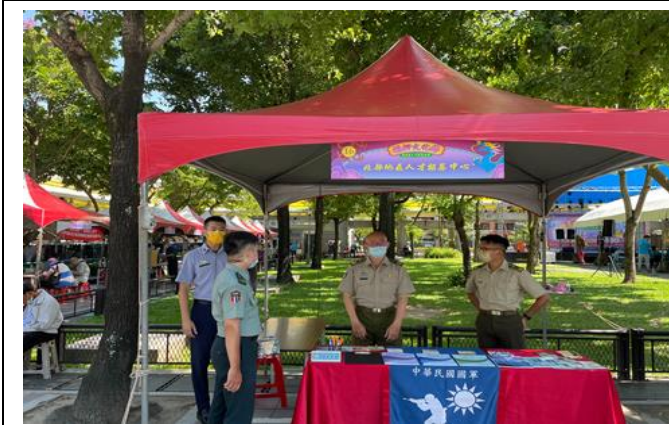
國軍北部地區人才招募中心