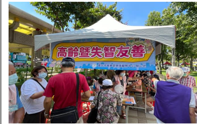
臺北市萬華區健康服務中心