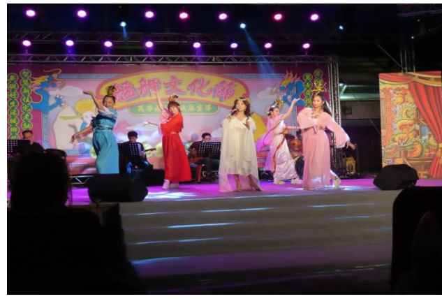
(二) 艋舺文化節-多元族群參與、手工藝教學活動及社區防災宣導 辦理時間：111年7月23日（六）14：00-21：00 辦理地點：艋舺公園