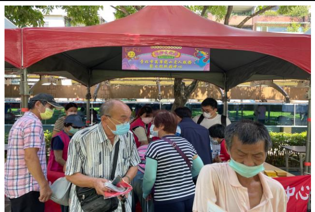
臺北市萬華龍山老人服務暨日間照顧中心