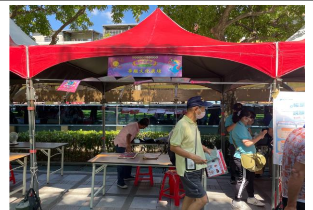
臺北市公有龍山商場