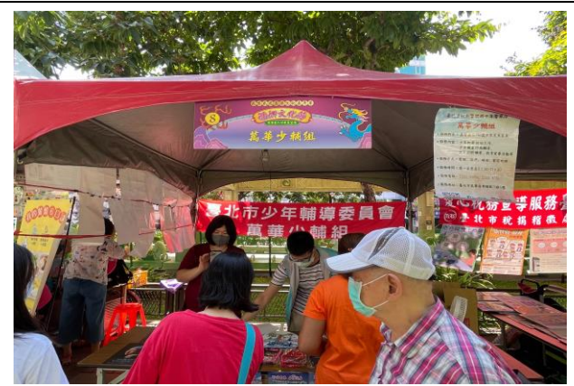
臺北市警察局長少年警察隊萬華少輔組