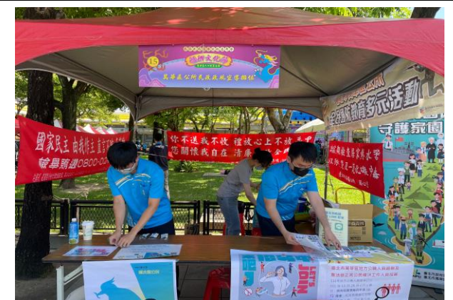
臺北市萬華區公所民政業務宣導