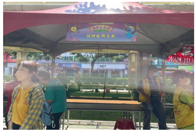
臺北市艋舺服飾商圈促進會