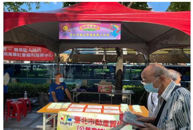
臺北市動產質借處