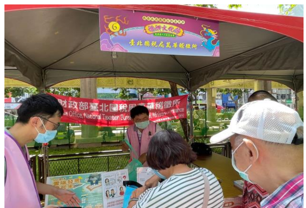
財政部臺北國稅局萬華稽徵所