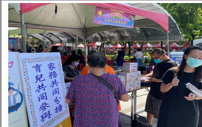
111年人口政策暨性別平等宣導