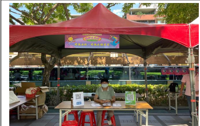
時報文化出版企業股份有限公司