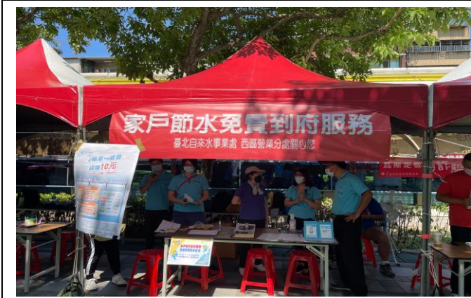
臺北自來水事業處