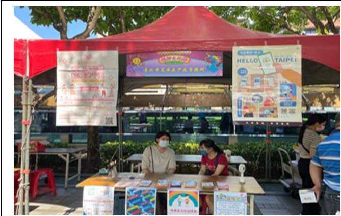
臺北市萬華區戶政事務所戶政宣導