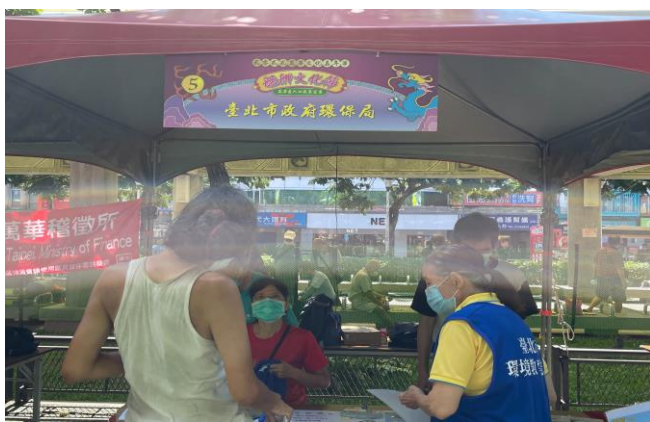
臺北市環境保護局