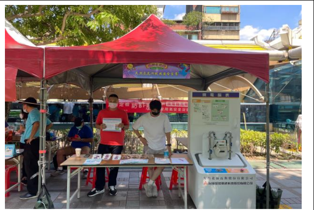
臺北市政府產業發展局