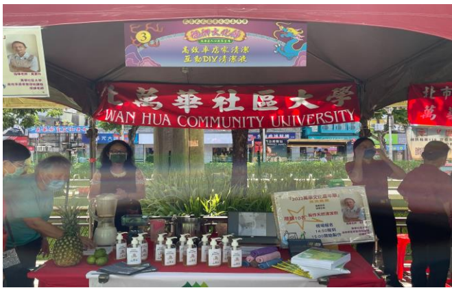
臺北市萬華社區大學