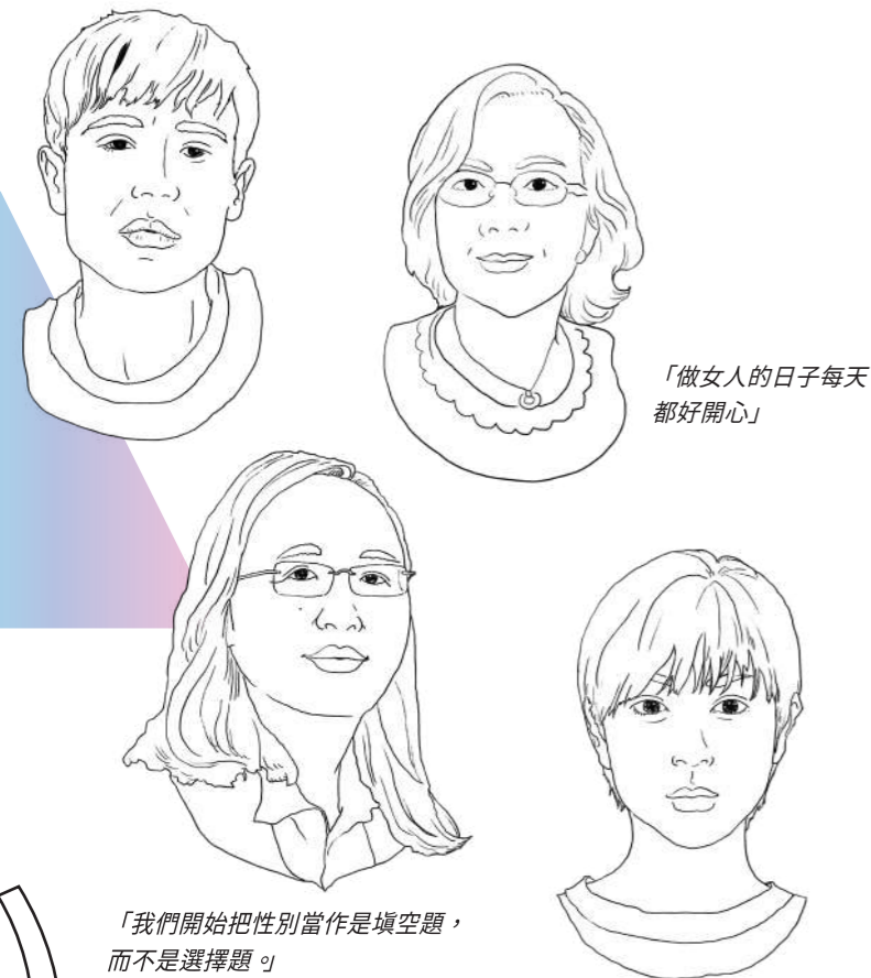
「做女人的日子每天都好開心」

行政院政務委員唐鳳 台中一中退休教師曾愷芯 加拿大演員Elliot Page 日本偶像音樂人宇多田光 他們都是知名的跨性別朋友