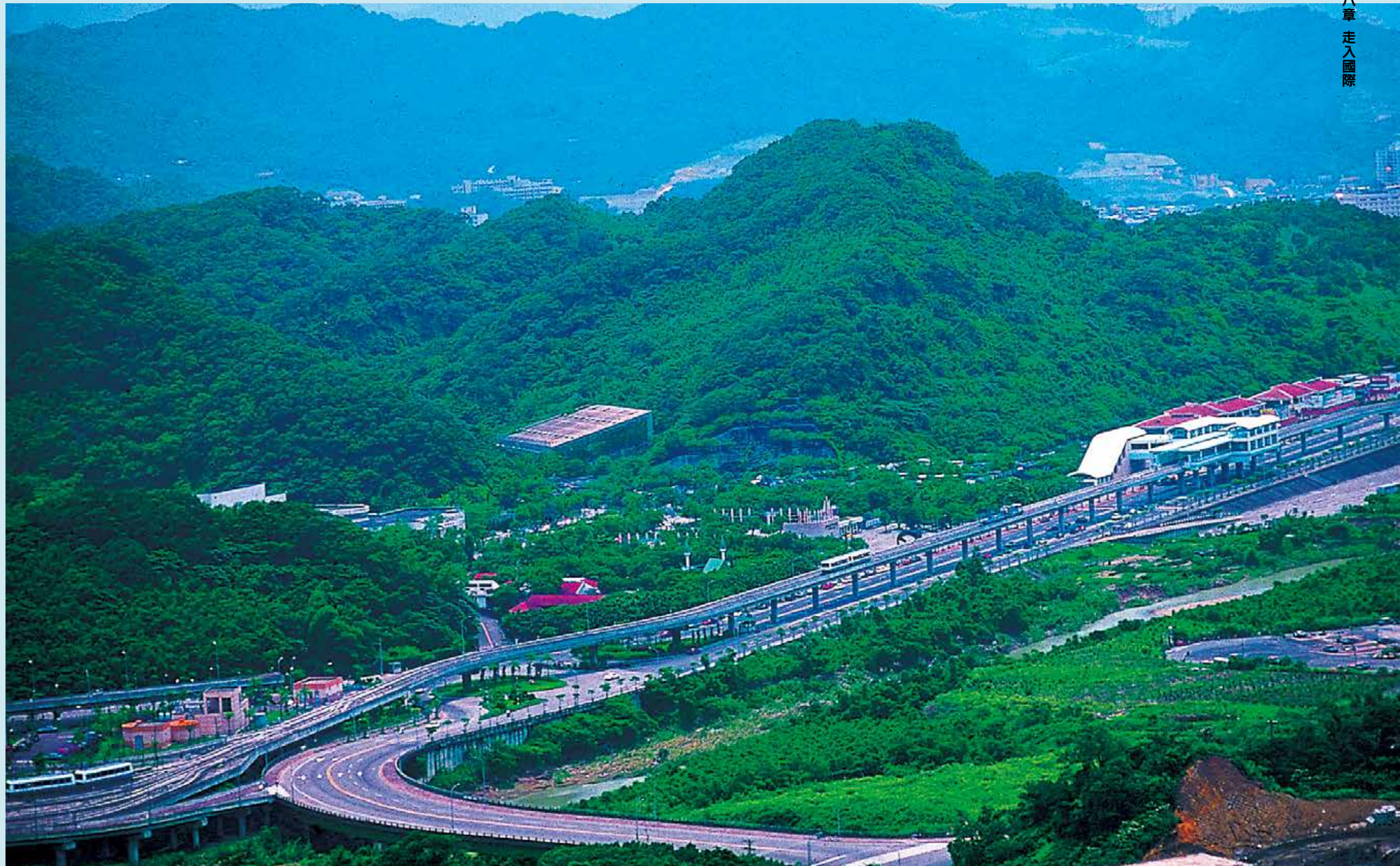
圖8-1：隱身在市郊丘陵間的木柵動物園。1996年捷運木柵線（今文湖線）正式營運，捷運「動物園站」就位在正門口的右側。2004年北二高全面通車，2005年北二高信義快速道路完工，大幅縮短中南部民眾及臺北市民前往動物園的交通時間。

為了尊重整體環境，規劃當時並未採取大規模整地、推平的方式，而是盡量依山而建，與大自然融合一體，因此木柵動物園的空間環境特色，在於與自然環境共存。加上鄰近景美溪、貓空和猴山岳，形成一個適合動植物生長的棲息地，在1993年以前動物園及其四周登錄了508種野生維管束植物，動物方面至2010年為止，記錄了哺乳類動物28種、鳥類115種、爬蟲類41種、兩棲類20種，以及132種蝴