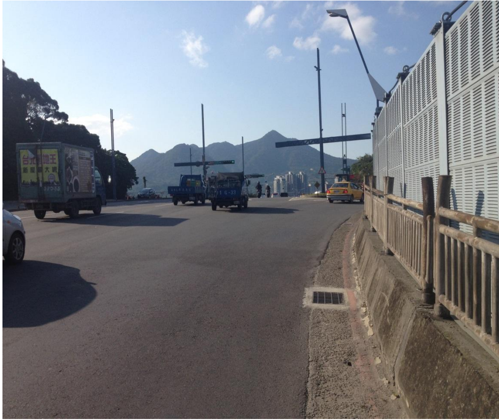
照片 1 大度路高架橋右轉道入口端