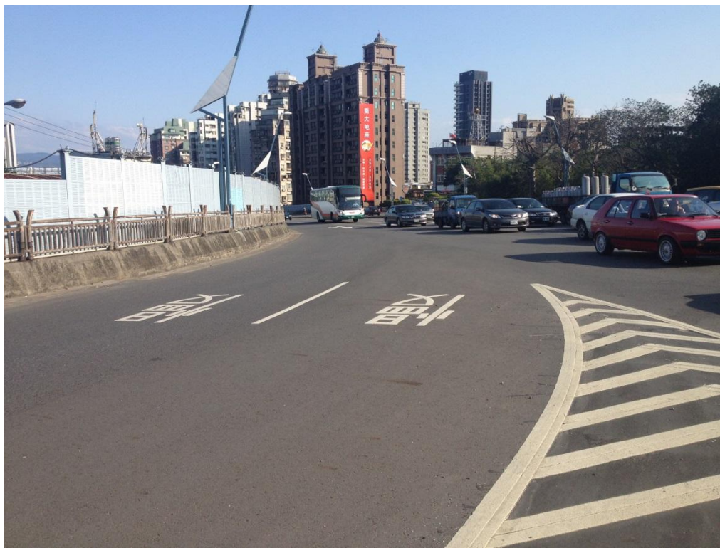
照片 2 大度路高架橋右轉道入口端