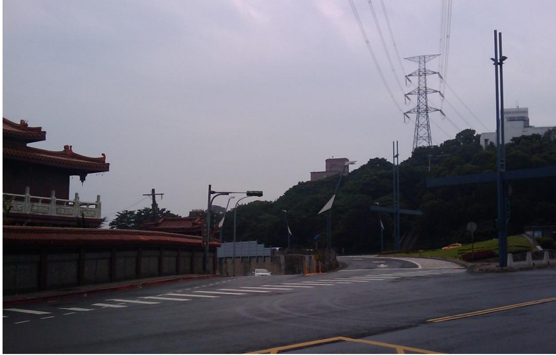
照片 3 大度路高架橋右轉道出口端與平面道路交岔口