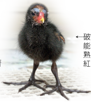
←破殼後全身絨羽即能隨親鳥活動的早熟型precocial，如紅冠水雞

成鳥/adult 成熟到能有繁殖力時。因繁殖需要，某些鳥種會產生繁殖及非繁殖羽色差異，或是長出特殊的飾羽。如鸛鷺群繁殖期頭後及胸前有絲狀飾羽。