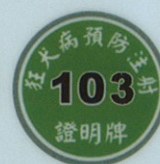
各年度之預防注射頸牌