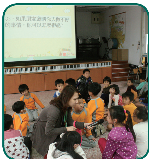
10/7北投少輔組泉源國小進行同儕衝突與傷害事件之預防宣導，學生十分活潑且反應熱烈。