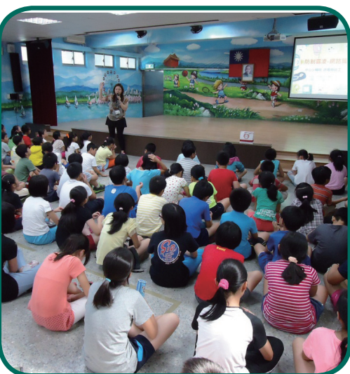
9/30中山少輔組大佳國小校園宣導，透過動畫協助學生認識網路霸凌及可能觸犯的法律，再以真實的新聞案件加深學生印象，反應熱烈，頗受好評。