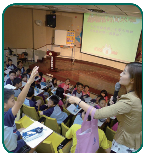
10/30士林少輔組蘭雅國小校園宣導正確兩性關係與交友應注意事項，讓學生瞭解健康性別關係、性騷擾認識與自我保護。