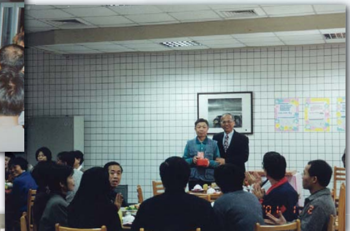
▲90. 1 餐廳舊貌