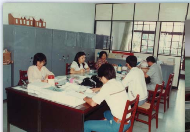
▲75年 昔為教務組辦公室