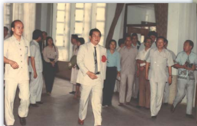
▲ 70. 9. 28 中正堂早期為活動禮堂