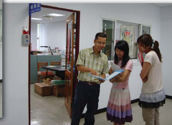
▲100.6.28 今為輔導組辦公室