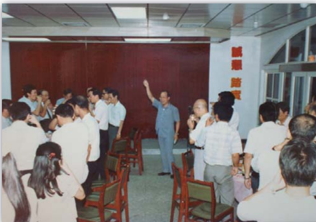
▲78. 9. 28 餐廳早期舊貌