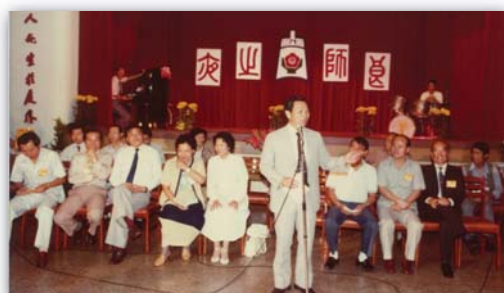
▲ 71. 1. 8 中正堂早期為活動禮堂