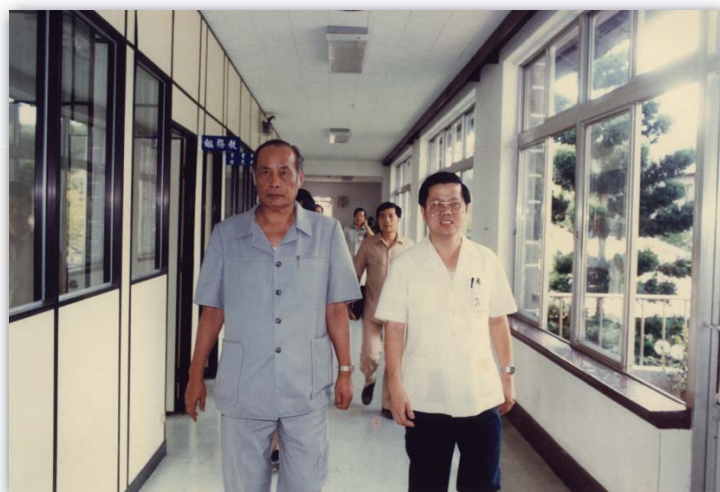
▲73.9 行政大樓2樓走廊舊景