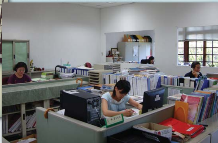
▲100.7.27 今為研究組辦公室