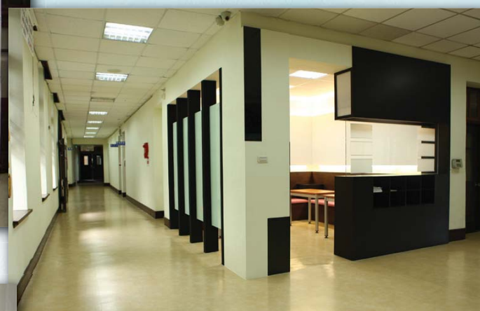
▲ 100. 7. 20 行政大樓1樓會客室新貌