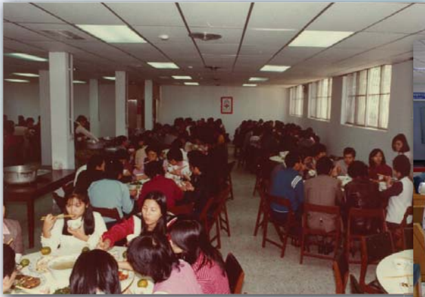
▲71. 1. 8 昔為研習員餐廳