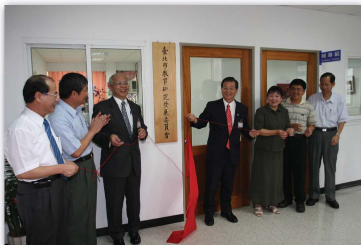
▲95.8.1 昔為教育研究發展委員會與輔導組辦公室