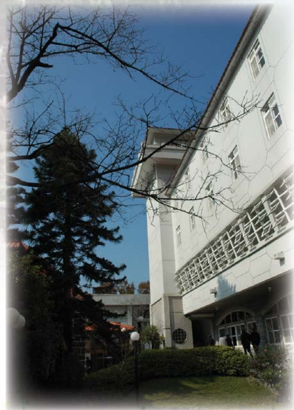
▲ 99.1.29 現今綜合大樓外觀