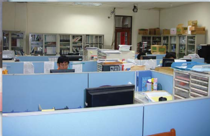
▲100.5.19 今為總務組辦公室