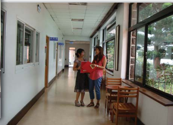
▲100.8.24 行政大樓2樓走廊新貌