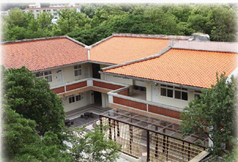
◀ 100.7.20 研習大樓俯視