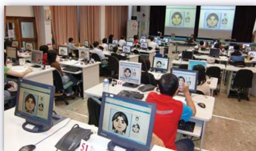
▲ 98. 4. 29 中正堂後改為電腦教室