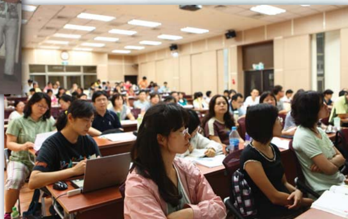
◆ 100. 7. 20 中正堂今日作為研習教室