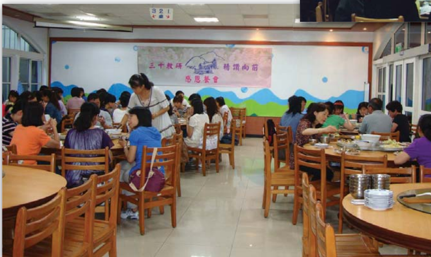
▲100. 8. 24 餐廳新貌