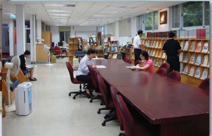
▲100. 6. 28 今為圖書室