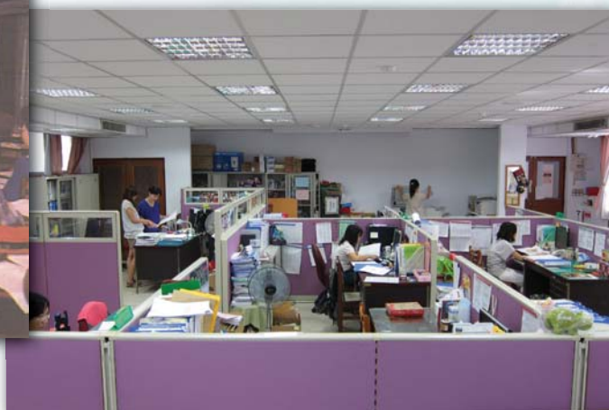
▲100.7.27 今為教務組辦公室