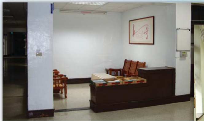
▲ 99. 8. 16 行政大樓1樓會客室舊景