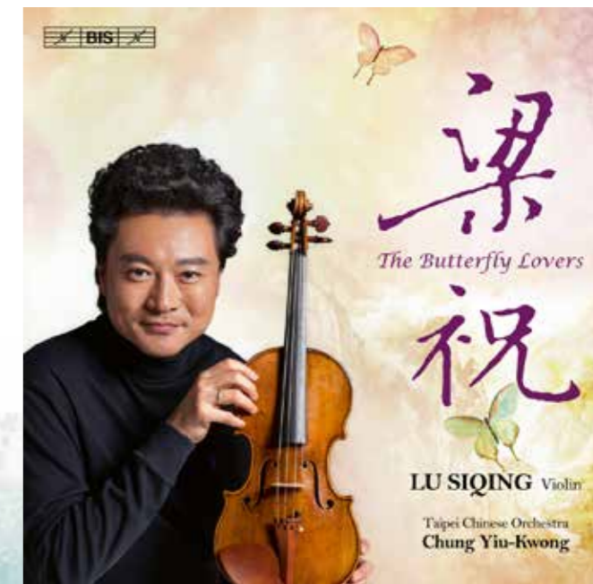
小提琴家呂思清與北市國合作的《梁祝》唱片五月發行。The new album The Butterfly Lovers recorded with violinist Lu Siqing was released this May.

In making the two new albums, with the western Chinese in mind, we invited Chen Sa, who have won the third place in Van Cliburn International Piano Competition, and Lu Siqing, champion of the Paganini Competition, to perform the featured pieces. Both are well known among the western Chinese circle and international music industry. Chen Sa performed the Piano Concerto by Wang Xilin. Lu Siqing did the all-time-classic The Butterfly Lovers' Violin Concerto , which was originally done