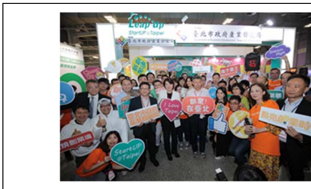
圖 5：109 年 11 月 17 日至 22 日辦理「2020 臺北國際創業週」-台北新創館現場合影