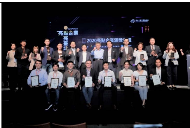
圖 3:109 年 11 月 19 日結合 臺北國際創業週辦理 亮點企業頒獎典禮。

7、提供新創獎勵補助：為以創新驅動本市產業發展，促進創新創業及招商引資，本府訂有「臺北市產業發展自治條例」，提供投資獎勵補貼及研發、品牌、育成、創業等創新補助，104年及105年均編列2億元，106年至110年各編列2.5億元，以提供新創獎勵補助，統計自104年1月至110年6月止，共受理4,487件獎勵或補助申請案，已審議通過1,396案，核准補助金額為19億2,372萬餘元，其中申請時為成立5年(含)以下之新創企業計有1,121案、占總數80.30%，核准補助14億3,760萬餘元、占總額74.7%，另外，104-109年年平均申請件數較100-103年大幅成長177%，年平均核准件數成長69%，核准金額更成長150%，足見鼓勵企業創新及投資已有一定之成效。