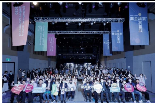
圖 4:109 年 11 月 19 日結合 臺北國際創業週辦理 亮點企業頒獎典禮。