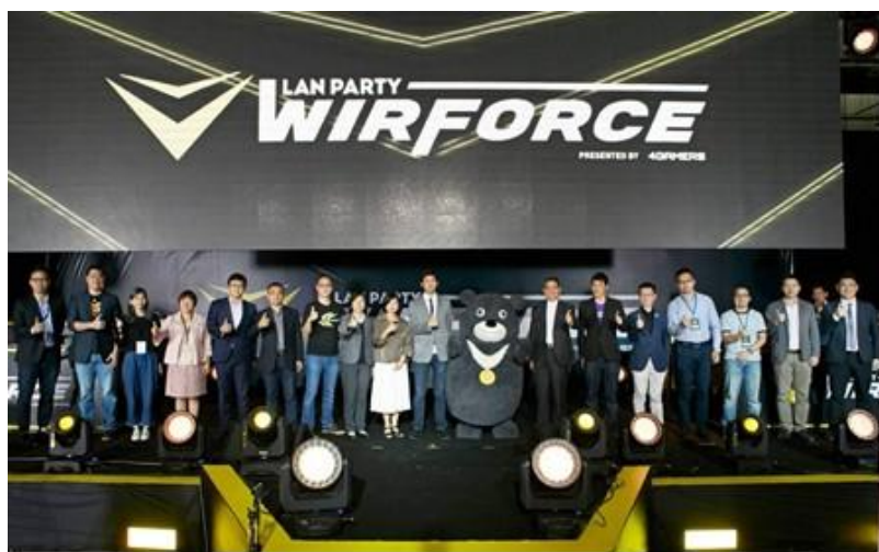
圖 1：亞洲最大電競嘉年華「WirForce2016」正式開跑，國內外廠商齊聚讚聲！

亞洲最大電競嘉年華「WirForce 2016」昨（11月10日）於花博公園爭艷館盛大展開，一直以來，臺北市政府非常重視臺灣電競產業的發展，並行動支持及力挺，讓臺北市成為全臺灣引領電競產業發展最快速的城市。「WirForce 2016」今年擴大舉辦，吸引各界熱烈支持，除了精心打造酷炫展攤外，還提供玩家VIP餐點，以高規格又豐富的活動內容讓玩家們吃得開心、玩得開心，即日起到11/13止，開放民眾免費入場，一起感受現場刺激歡樂的活動氛圍！