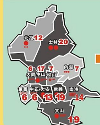
臺北市12行政區103年度有執行TCCP