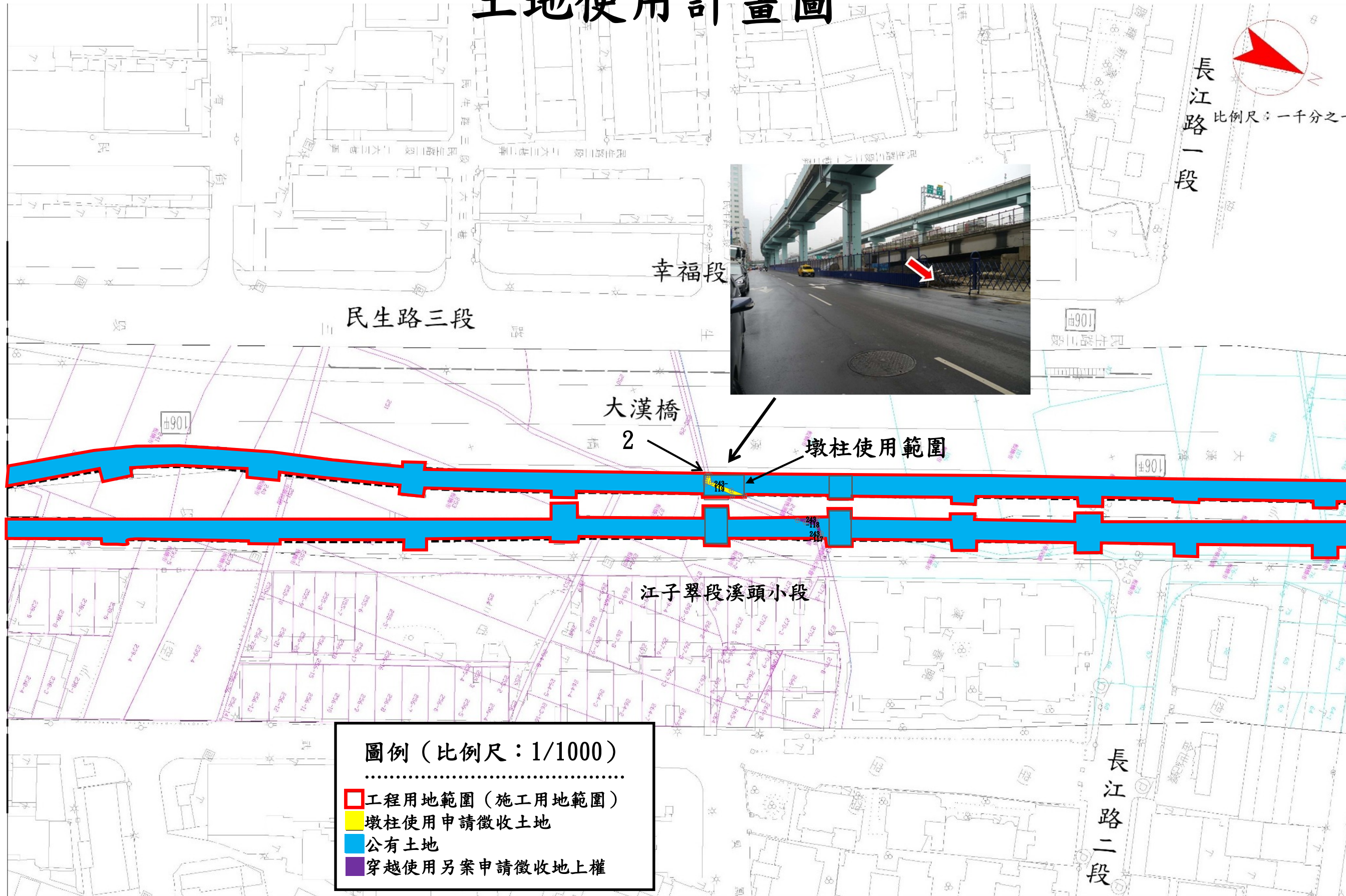
圖例 (比例尺: 1/1000)