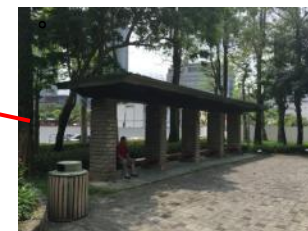
E.花架維護良好，使用率高，鋪面較為老舊。