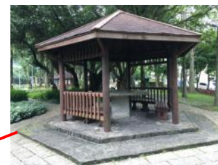
D.涼亭堪用，但油漆脫落需重新上漆