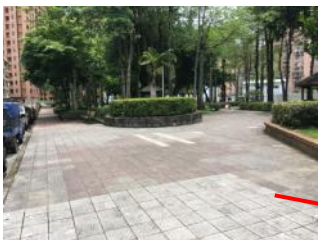
B.鋪面型式不一，較無整體感。