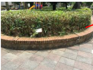
C.部分花台老舊破損，不美觀且易造成危險。