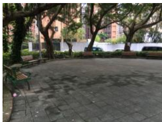
A.廣場鋪面較為老舊，有凹凸不平之情形。