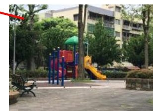
F.兒童遊具維護良好，使用率高。