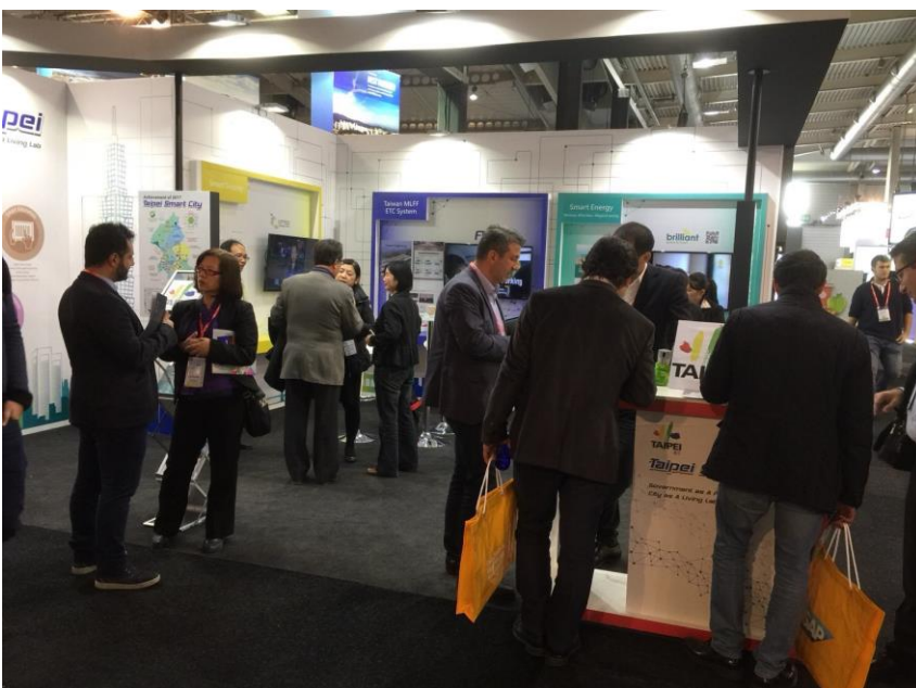
圖說：台北市政府參與巴塞隆納智慧城市展，吸引國外城市代表及廠商參訪台北館，進行國際交流。