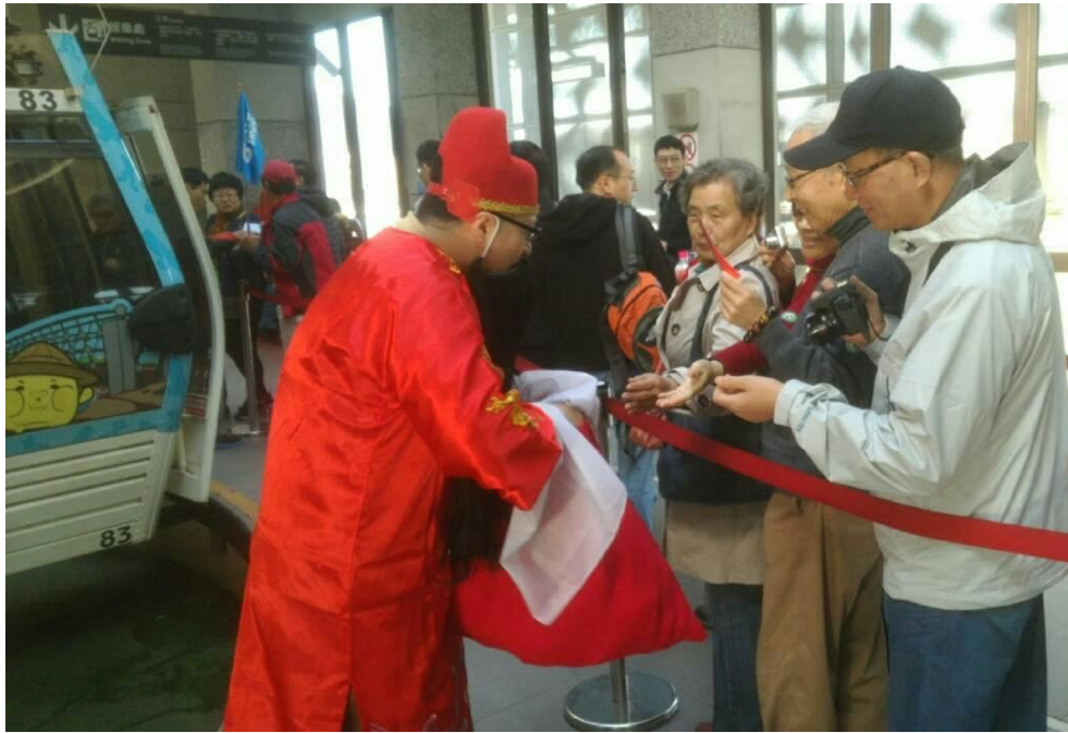
照片 3 貓空纜車農曆新年財神爺發紅包活動