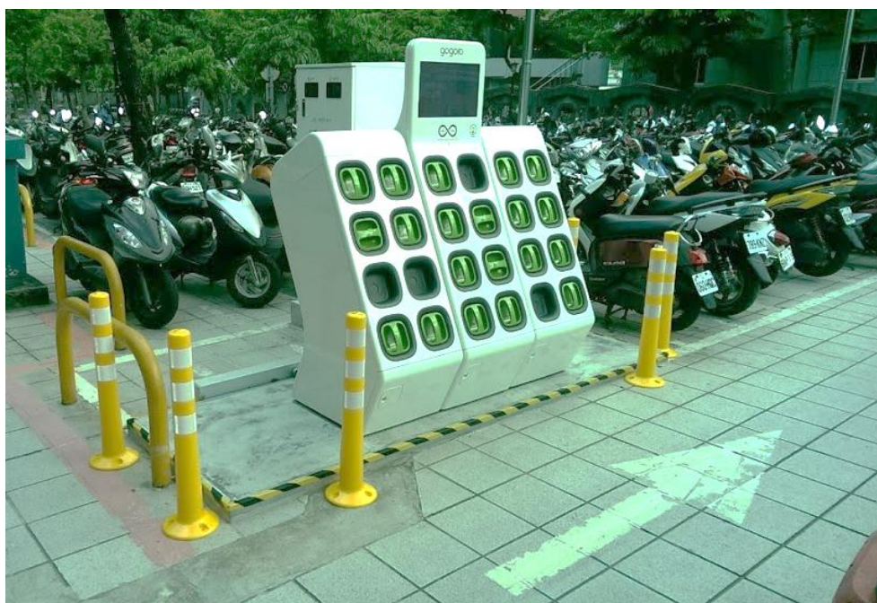
照片 10 民權西路站機車停車區設置電池交換站