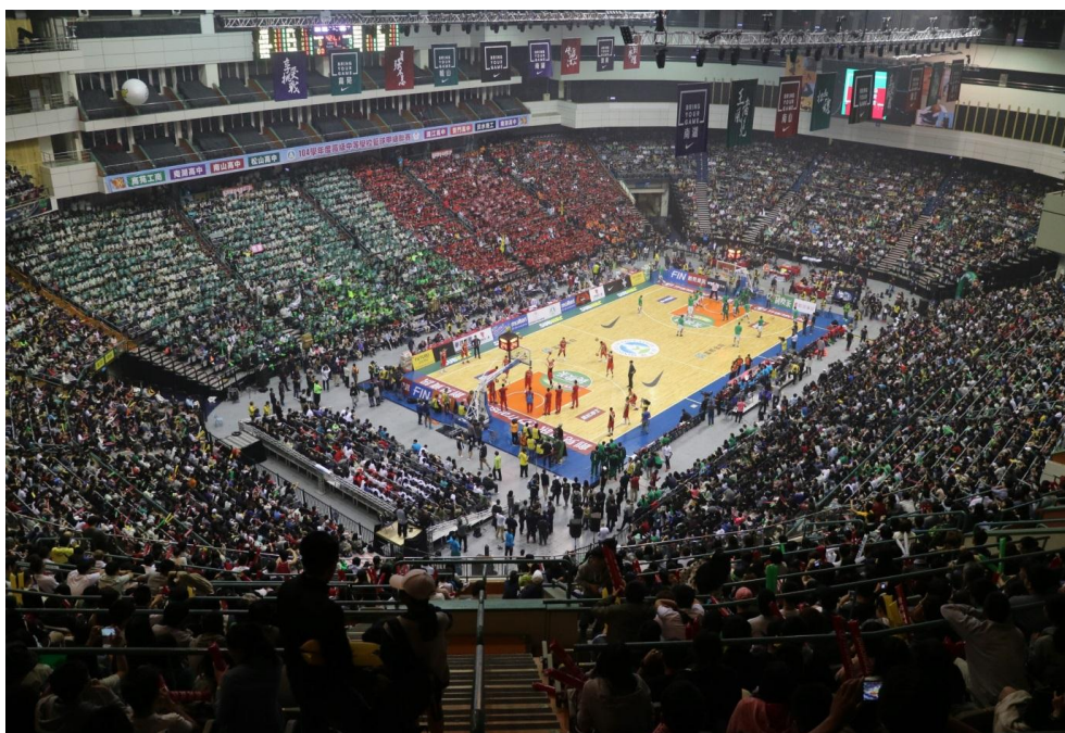
照片 5 104 學年度高中籃球甲級聯賽總決賽