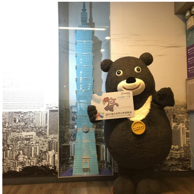
照片 2 世大運吉祥物「熊讚 Bravo」紀念一日票