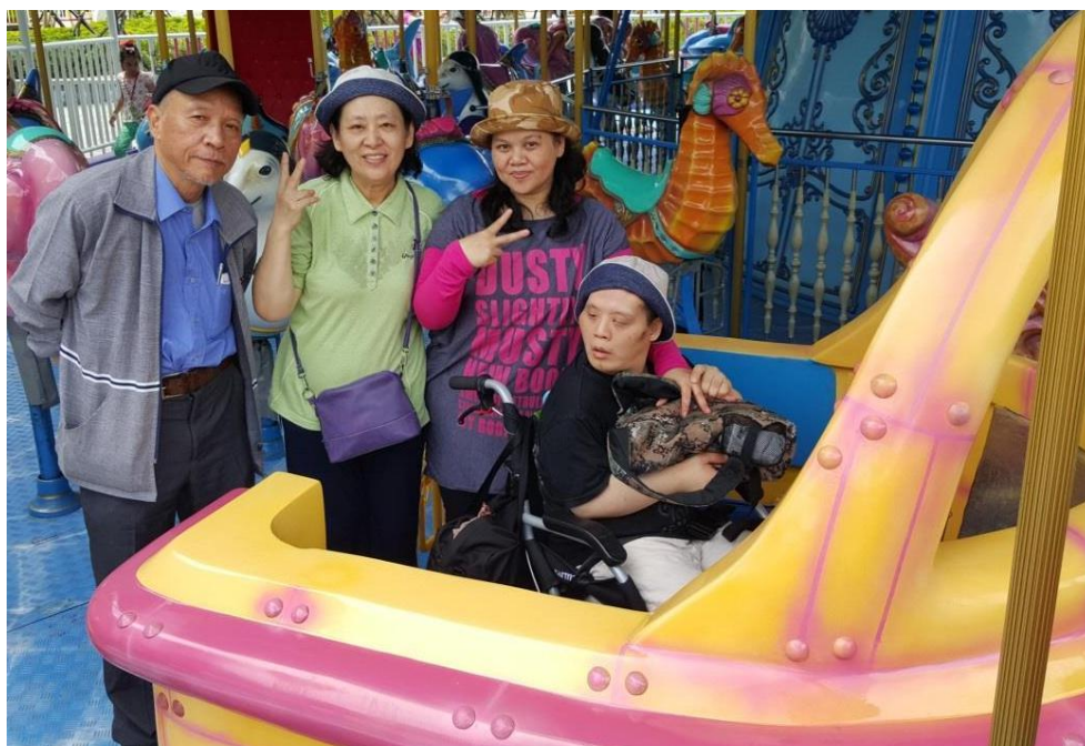
照片 9 兒童新樂園「海洋總動員」無障礙座艙