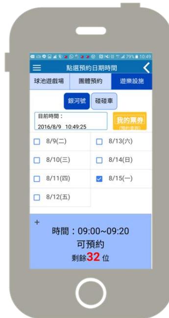
照片 8 「兒童新樂園」App 遊樂設施預約功能