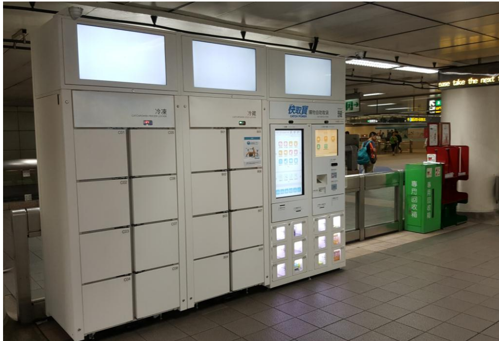
照片 7 中山站智慧取物櫃