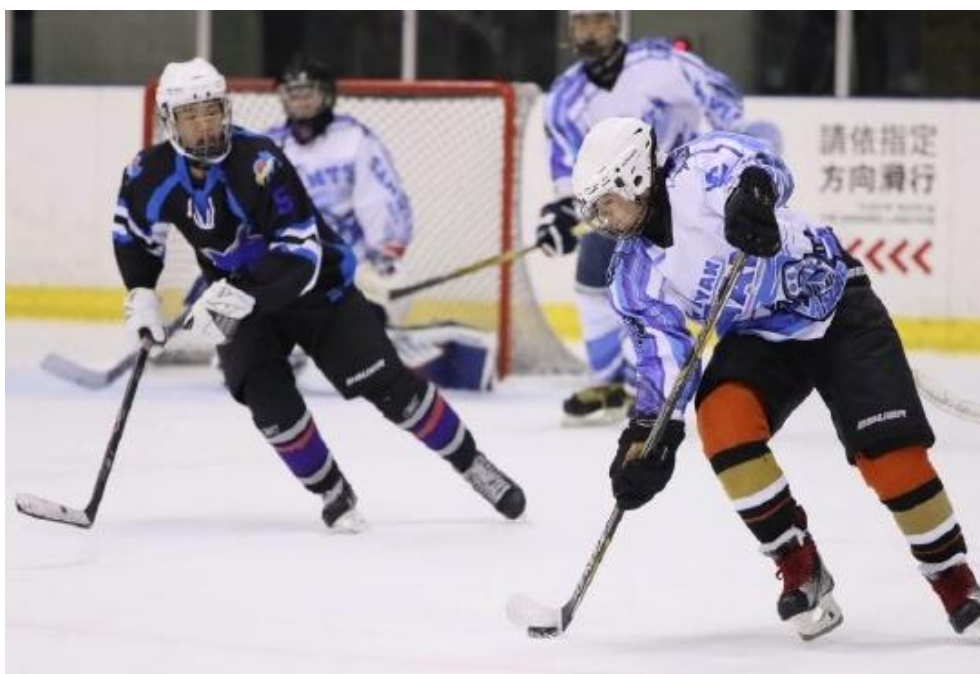
照片 6 105 年臺北市青年盃冰球錦標賽