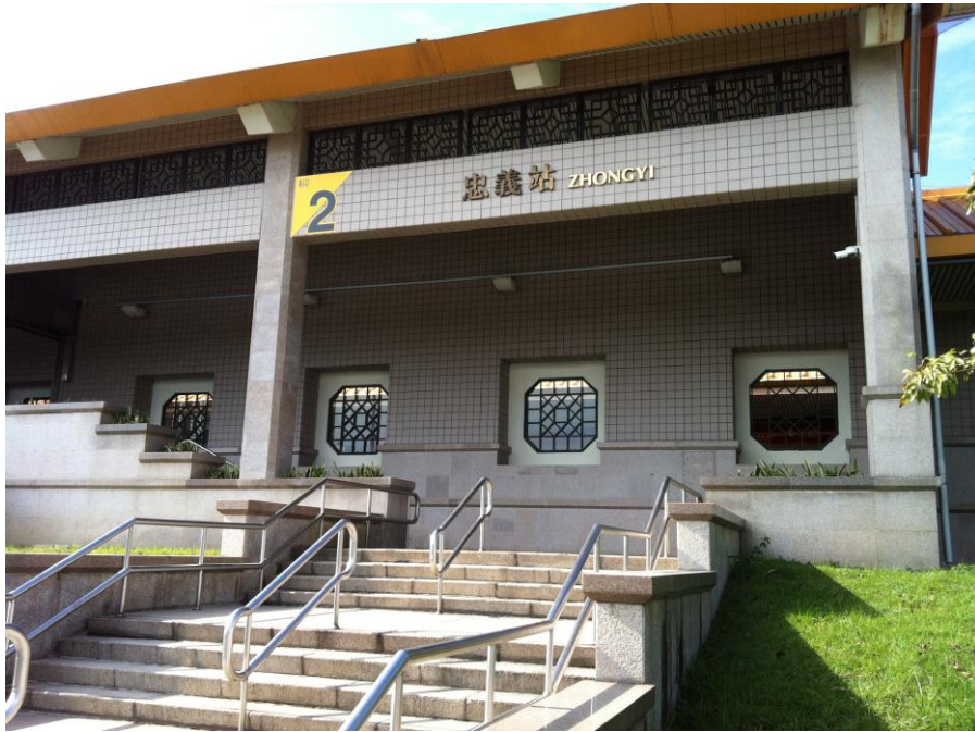
照片 1 忠義站 2 號出入口