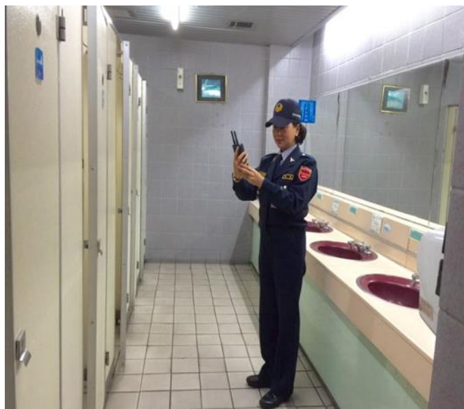
專屬巡檢由女性駐警同仁於女廁執行針孔偵測情形