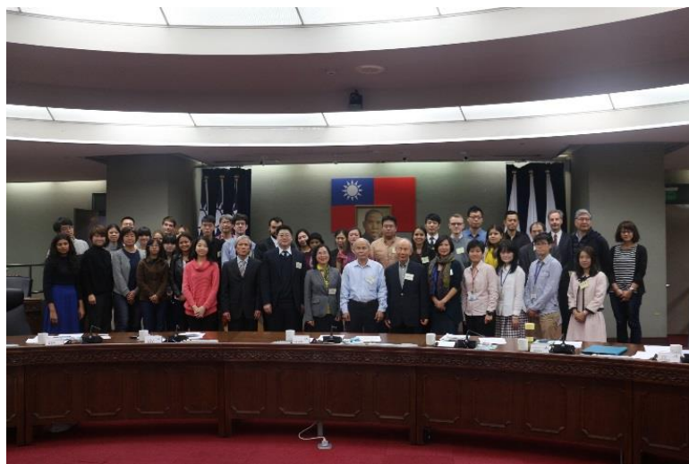
105年度協助案分享茶會

本處協助社會團體及各級學校辦理或參加國際會議或活動時，於不排擠各申請案件前提下，將「促進性別平等」及「促進婦女權益」等相關議題納入協助案評審的加分項目，酌增協助額度。105年已試辦於部分協助案件結合性平議題，建議8個受協助單位參加或辦理國際會議活動時，加入性別意識之研習場次或相關之課程，共計2個單位採行，本處並於105年年底邀請該2單位分享活動辦理成果。