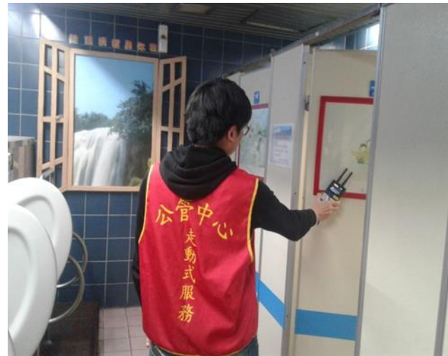
定期巡檢男廁執行針孔偵測情形