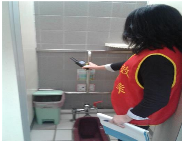
定期巡檢女廁執行針孔偵測情形

公管中心自 91 年 9 月 1 日依據「臺北市公共場所防止針孔攝影暫行管理辦法」於每週一及週四由中心同仁利用定期巡檢進行針孔攝影偵測本市政大樓 226 座男女廁所，每週二、週三及週五由女性駐警同仁檢測 3 樓以下公共區域及 11 樓、12 樓中央南北女廁，並於每月將偵測結果彙整送交本府建管處，防止針孔攝影非法入侵市府，保障市府同仁及洽公市民個人隱私。