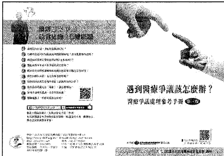
圖三、醫改會編印新版醫療爭議處理參考手冊