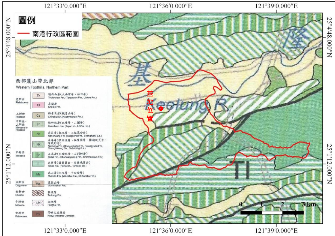
圖 2 南港行政區地質環境 (底圖引自陳文山 2016 台灣地質圖)