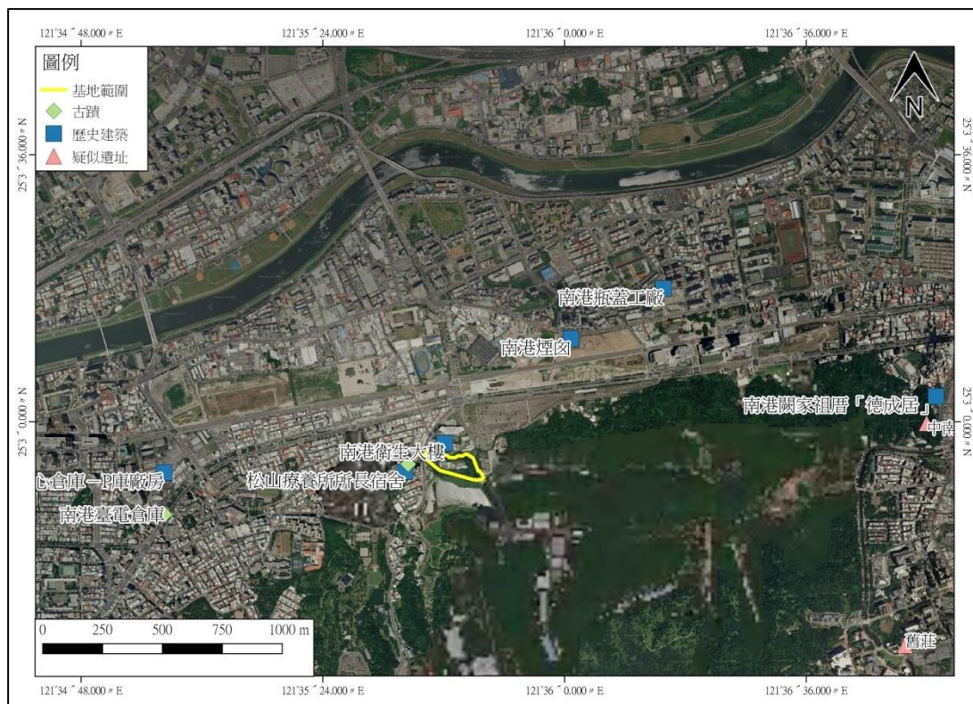
圖 3 計畫所在行政區域內有形文化資產與疑似考古遺址分布圖