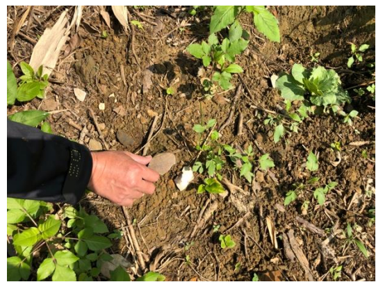
圖版 18 坡地地表見有瓷碗與現代硬陶破片