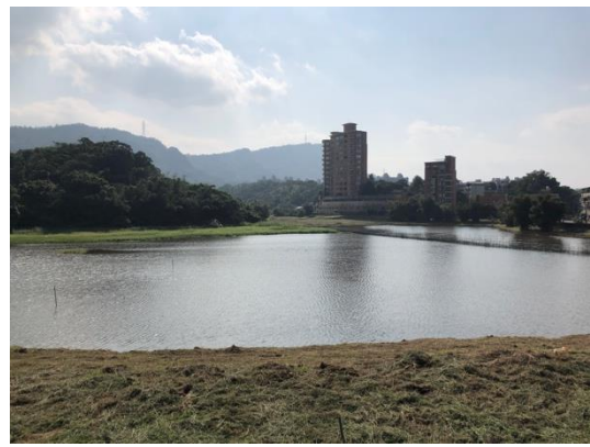
圖版 15 基地南方為東新陂