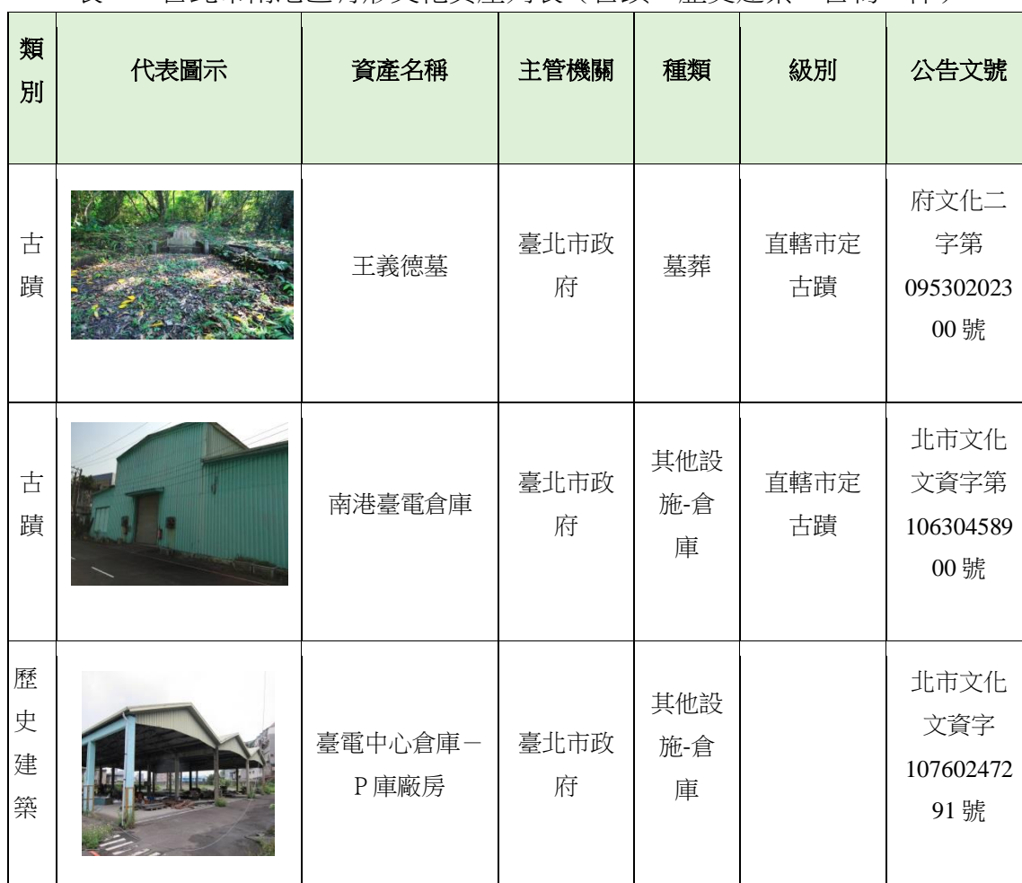
表二 台北市南港區有形文化資產列表（古蹟、歷史建築、古物 1 件）

計畫預定地位於台北市南港區，目前南港區內已登錄或指定的有形文化資產包括：古蹟 2 件、歷史建築 7 件、古物 121 件（表二）。其中古物類 120 件皆典藏於中央研究院，1 件位於南港國防部軍備局生產製造中心第 202 廠內；以下列舉定著於地的有形文化資產（古蹟、歷史建築），以及前述 1 件置於室外的古物資料。