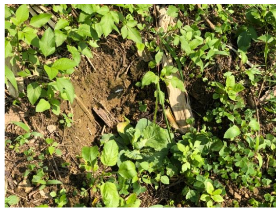
圖版 17 坡地地表為褐色壤土