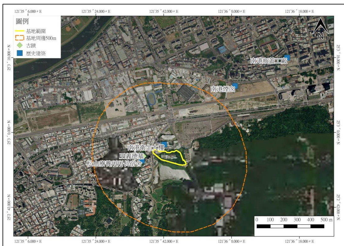
圖 4 基地周邊文化資產分佈圖