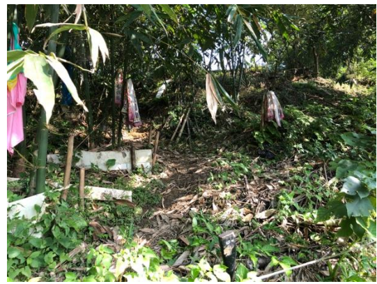
圖版 16 基地南側邊界坡地