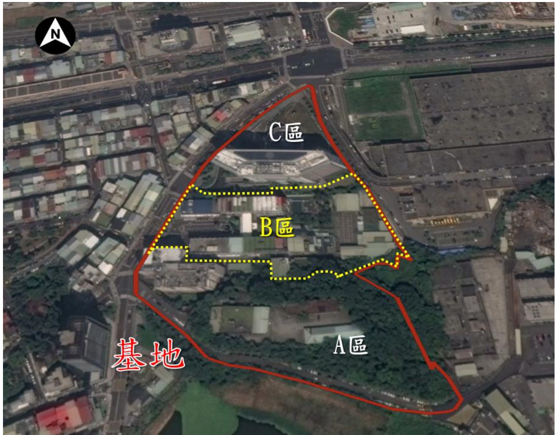
圖 1 基地位置圖 (A區)