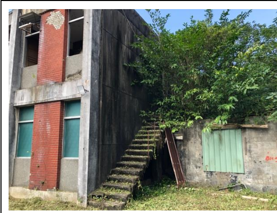
圖版 13 二層樓建物後方附屬設施