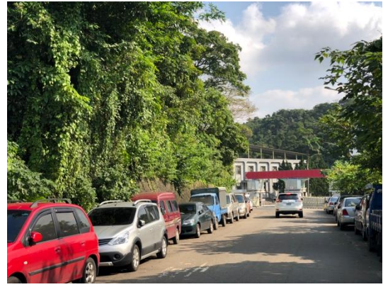
圖版 14 基地南側邊界龍華路，路底為國軍營區