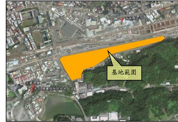
圖 4 基地與鄰近古蹟關係圖