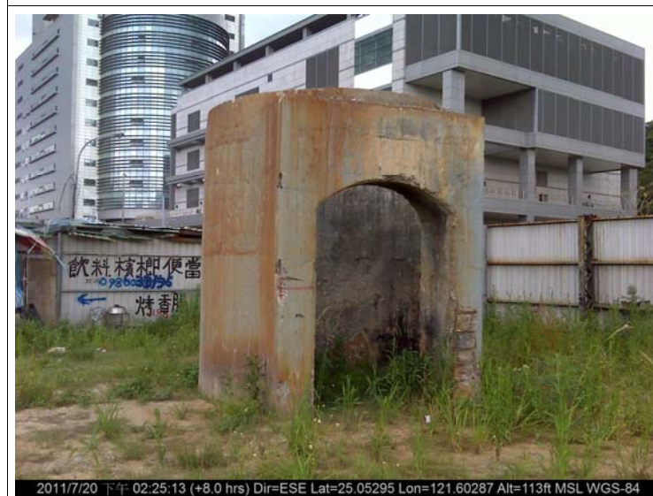
圖版 5 南港煙囪拆除後地表現況

2011/7/20 下午 02:25:13 (+8.0 hrs) Dir=ESE Lat=25.05295 Lon=121.60287 Alt=113ft MSL WGS-84