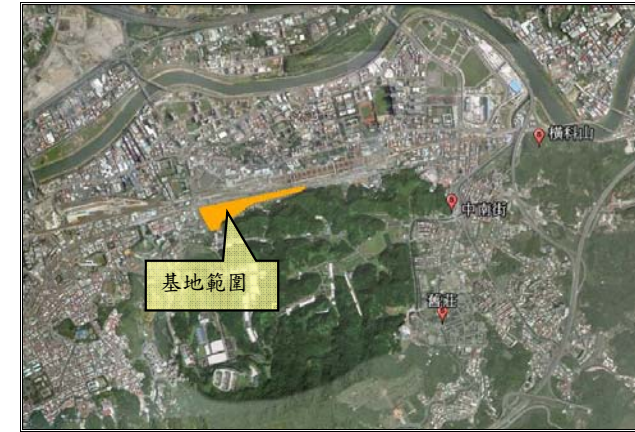
圖 5 基地位置與鄰近考古遺址分布關係圖