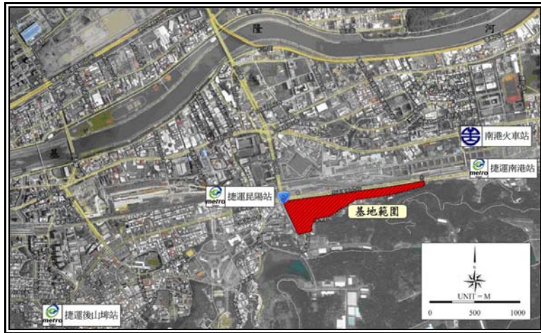
圖 1 基地位置圖-1

為界；西至八張犁截水道至縱貫鐵路與松山區為界及至中坡南、北路接福德街至姆指山山脊與信義區為界；南至福壽(大坪)山山脊與文山區和台北縣深坑鄉石碇鄉為界；北至基隆河中心線與內湖區為界 1 。地質方面包括以礫石、砂及粘土為主的全新世沖積層、與以泥質砂岩、白砂岩為主的中新世-上新世桂竹林層大埔段、以及中新世石底層與南港層 2 (圖 3)。