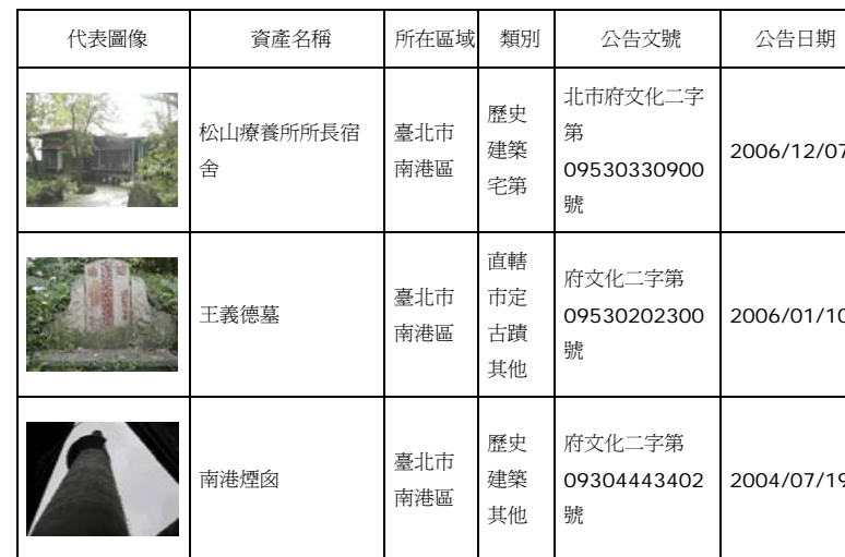
表 2 南港區文化資產表