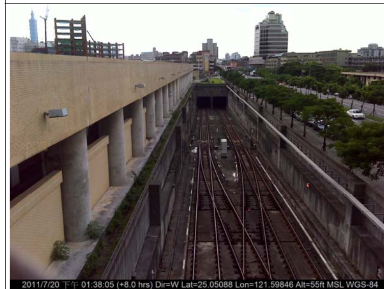
圖版 1 基地東側現況

2011/7/20 下午 01:38:05 (+8.0 hrs) Dir=W Lat=25.05088 Lon=121.59846 Alt=55ft MSL WGS-84