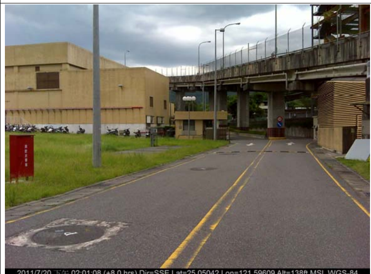
圖版 3 基地分構區現況

2011/7/20 下午 02:01:08 (+8.0 hrs) Dir=SSE Lat=25.05042 Lon=121.59609 Alt=138ft MSL WGS-84