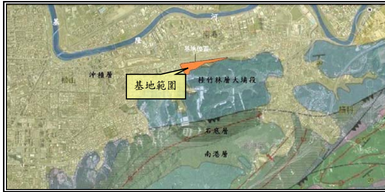
圖 3 基地附近地直分布圖