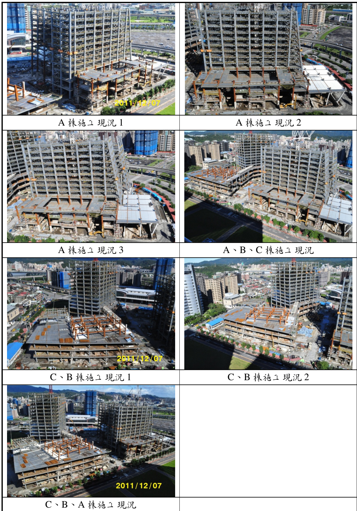
圖 2-1 施工現況相片圖