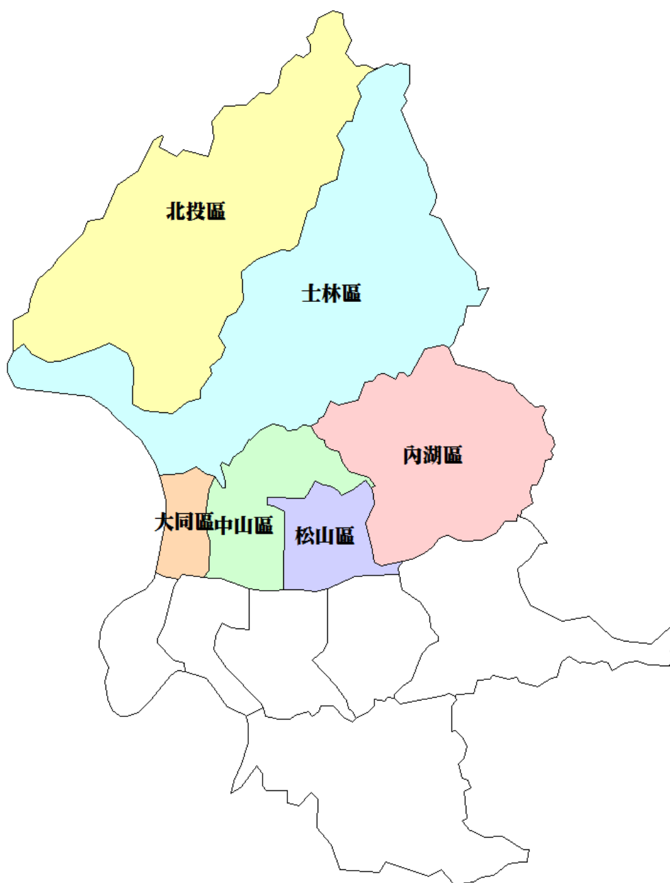
圖 1-2 本計畫調查範圍示意圖

本(109)年度調查範圍為臺北市北投區、士林區、大同區、中山區、松山區及內湖區等 6 個行政區，詳如圖 1-2 所示；此 6 個行政區範圍共計有 374 個交通分區，進行各項目調查工作，各行政區之交通分區範圍圖彙整如附錄一之附 1-1 頁~附 1-6 頁。