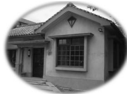
圖3-6-1文山區公民會館