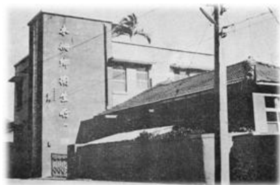
圖3-7-1木柵鄉衛生所