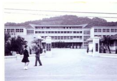
圖3-8-1考試院