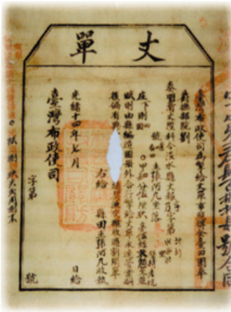
圖3-4-1清代土地測量憑證--丈單