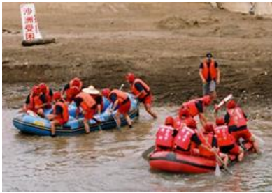
圖3-5-1防災演習一沙洲救援