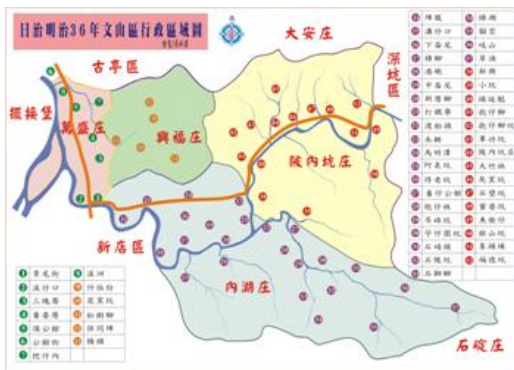
圖3-1-2 明治36年行政區域圖 周祥傳 重繪