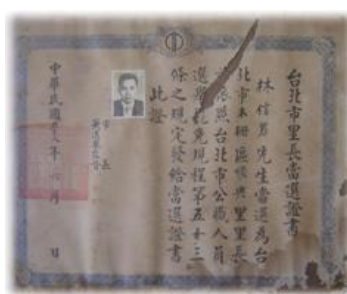
圖3-2-1 木柵區第1屆里長當選證書