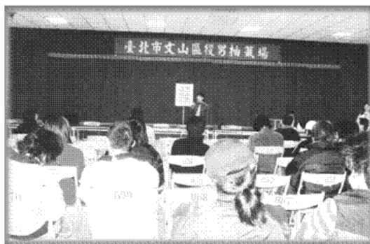
圖3-3-2 役男抽籤會場