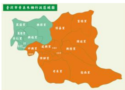
圖3-1-3 民國54年景美木柵行政區域圖 周祥傳 重繪