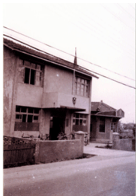
圖3-3-1 復興派出所