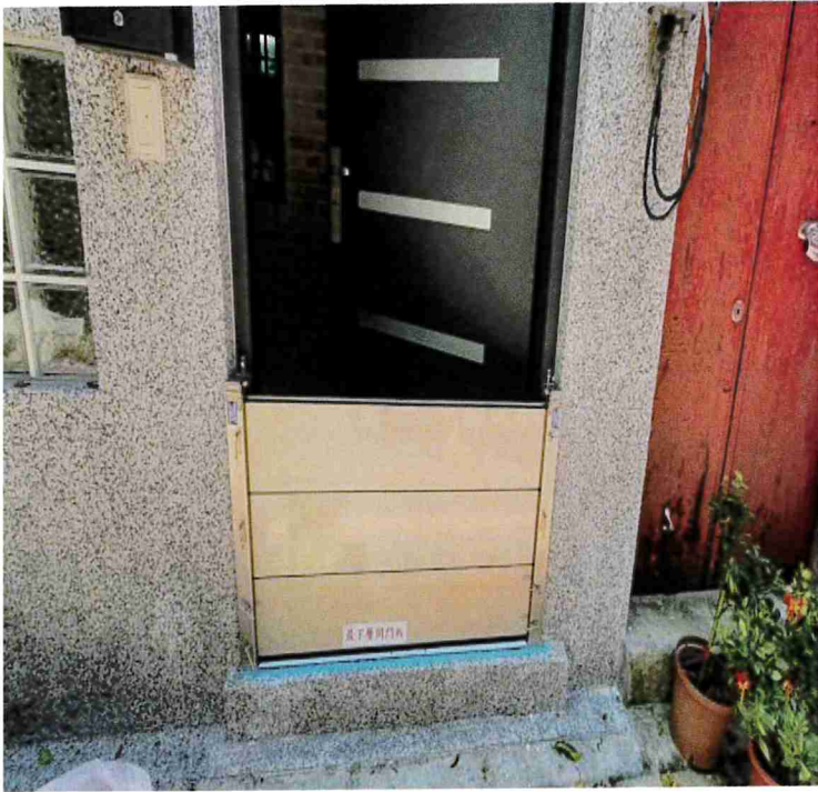
家戶組合式防水閘門