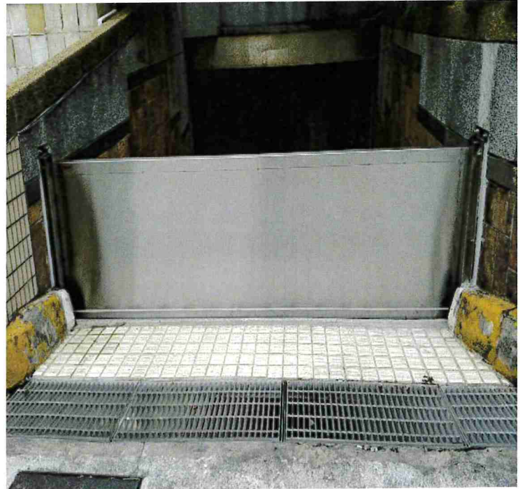
車道擺動式防水閘門