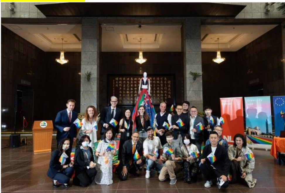
荷蘭在台辦事處今年與歐洲經貿辦事處 (EETO) 及台北市政府合作，舉辦「阿姆斯特丹彩虹裙」(Amsterdam Rainbow Dress) 藝術特展，今天開始展開為期6天的展覽。

(3) 積極運用與結合資源拓展性別平等業務，鼓勵、督導區公所、所屬機關、民間組織(如人民團體、基金會、機構等)與企業推動性別平等