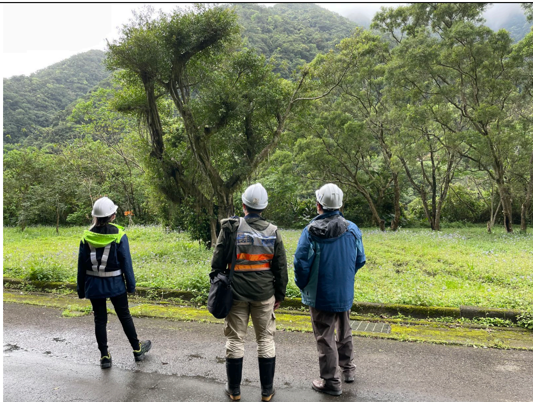
SGS 河川水質取樣勘查(110.3.8)