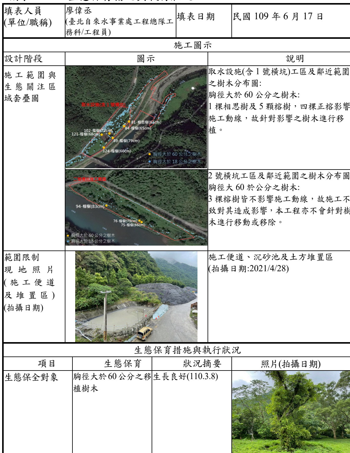
附表 C-06 生態保育措施與執行狀況