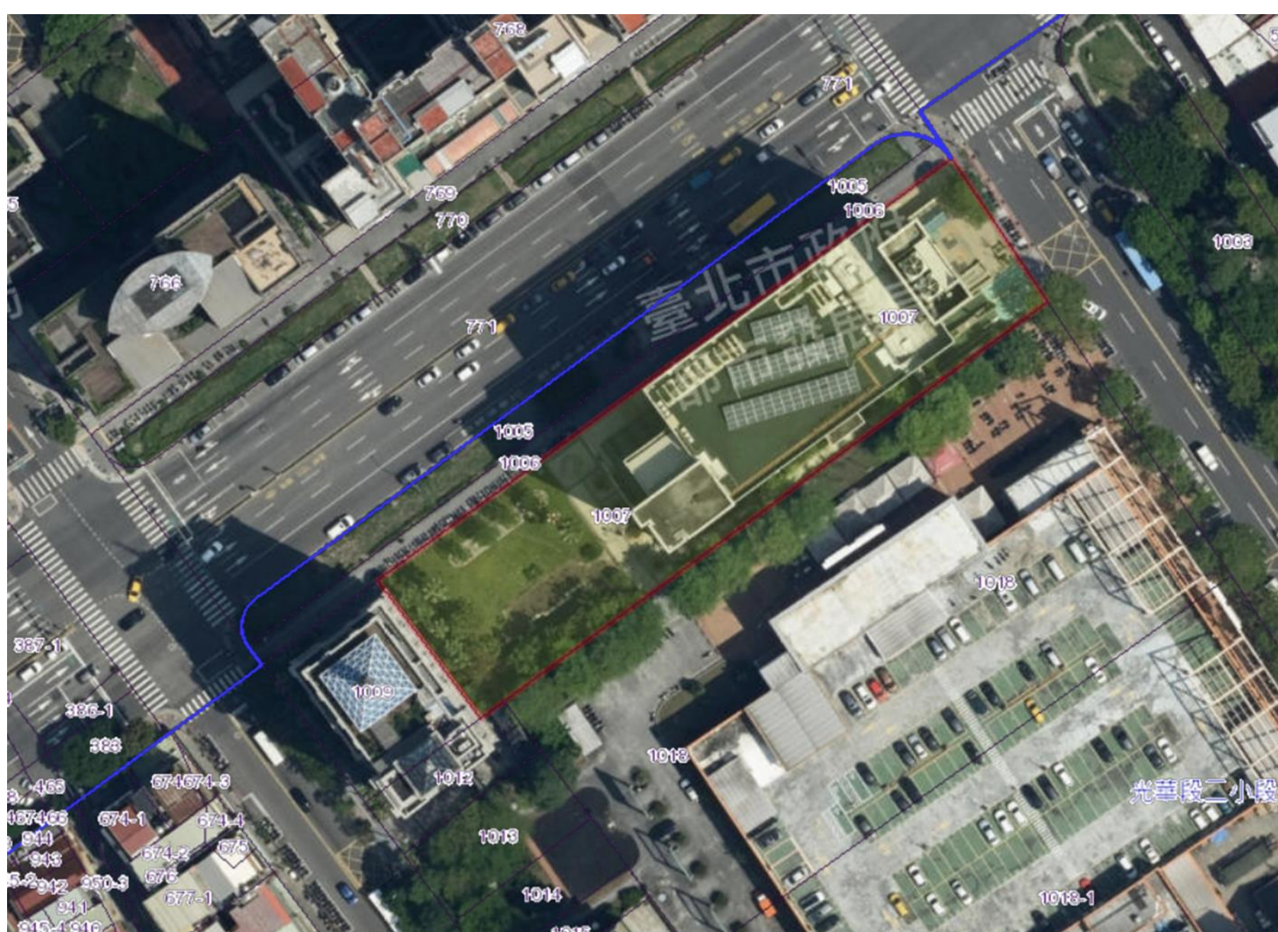
可由圖面看到現場道路及建物在地籍圖中的影像