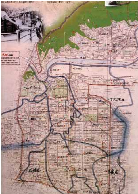
12- (1) 日據時代中山區全景，資料來源：大地地理雜誌。