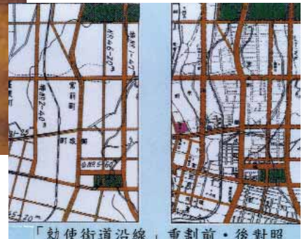
「敕使街道沿線，重劃前·後對照」 13- (2) 「敕使街道沿線」重劃前·後對照圖