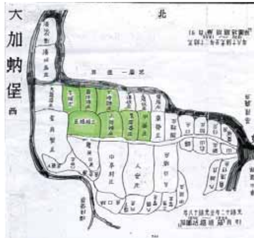
12- (2) 清代行政圖—清光緒十二年(1886年)今日中山區政範圍，東起向西為中崙庄（部分）、朱厝崙庄、上陂頭庄（部分）、下埤頭庄；由南向北起有三板橋庄、番仔埔庄（後分中庄仔庄與西新庄仔庄）、牛埔庄，共七大庄。