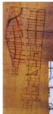
13- (1) 日據時期中山北路（敕使街道）沿線土地重劃圖