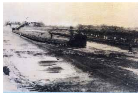
加蚋仔庄·中崙採土場 (1914-1917) 13- (3) 加蚋仔庄·中崙採土場照片