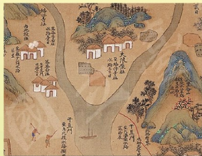
▲圖2、1704年的《康熙臺灣輿圖》繪出大浪泵社與附近的關係。

聽見原鄉 臺北市「大同」區名的由來，除紀念孔子天下大同的精神及取國父世界大同的崇高理念外，還帶有舊地名的特殊意義。今大同與舊地名大隆同、大龍峒、大龍峒山(今圓山)，都是源於十七世紀以前居住於此之原住民平埔族「大浪泵社」的閩南語音譯。今天，我們從三百年前的古地圖和近一百年的戶籍登記資料，見證了“原”鄉情緣的歷史印記。