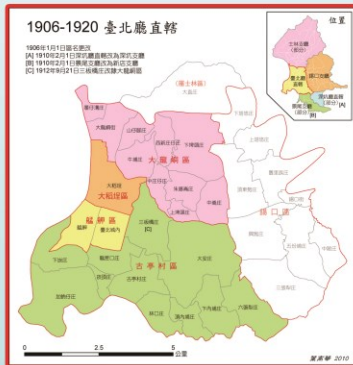
▲1906年, 屬於臺北廳直轄的大龍峒區, 其區名正是引用原住民大浪泵社名。