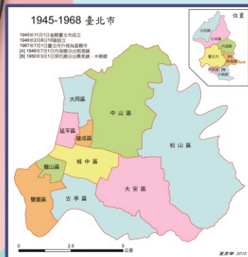
▲光復後, 1946年臺北市行政區域調整分設10個行政區, 其中大同、延平、建成3區, 即今之大同區, 再次印證原鄉情緣。

19世紀中葉清領時期 , 圭武卒社與大浪泵社合併為「圭泵社」, 因通婚、文字、改名等因素逐漸漢化, 原活動的地方也分別漢化音譯為「大龍峒莊(早期稱大隆同)」及「奎府聚莊」。20世紀後漢化迅速的主泵社, 連同凱達格蘭族於臺北一併消失。