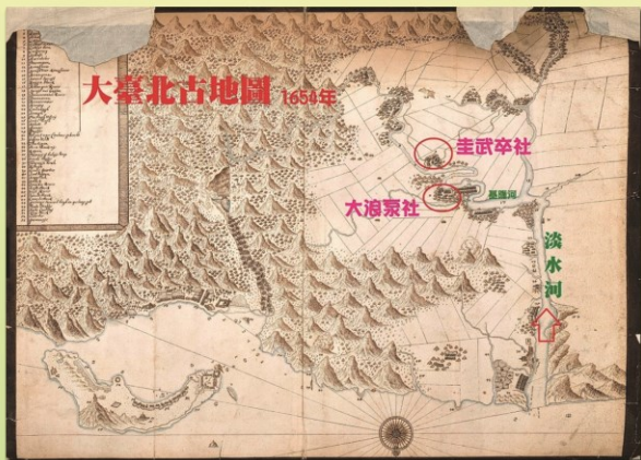
▲圖1、1654年的荷蘭人所繪《大臺北古地圖》，是以由淡水河入臺北方向所繪製的古地圖。

在三百多年前，大臺北地區曾是平埔族(凱達格蘭族)人的領域，大約有三十多社，散居在各地以漁獵和簡易農耕為生。而大臺北地區古時稱為「大加蚋堡」(大加臘堡)，即是以平埔族發音而來。而根據荷蘭人1654年所繪的《大臺北古地圖》(圖1)，當時在今大同區範圍內的，就有「大浪泵社」及「圭武卒社」兩個聚落，是文獻最早的記載。