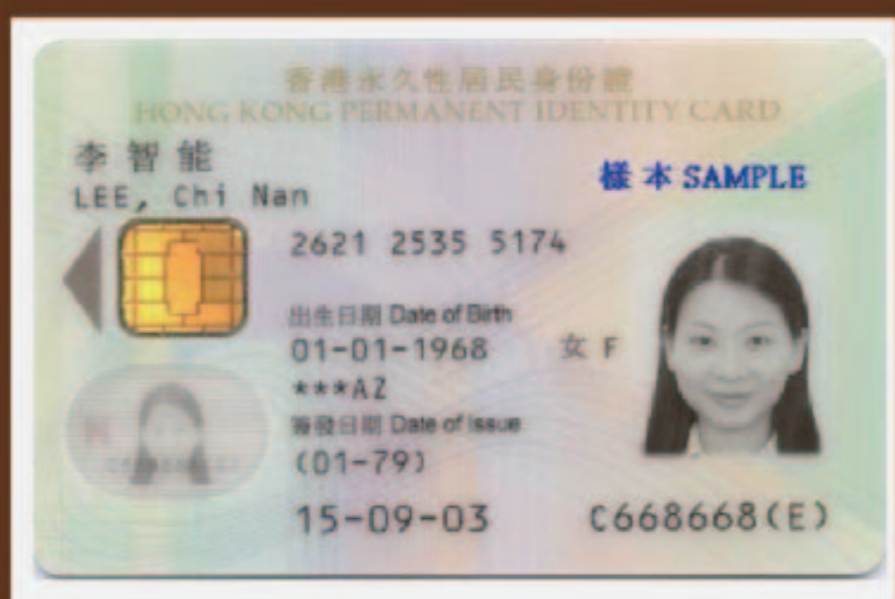
(2) 香港永久性居民身份證