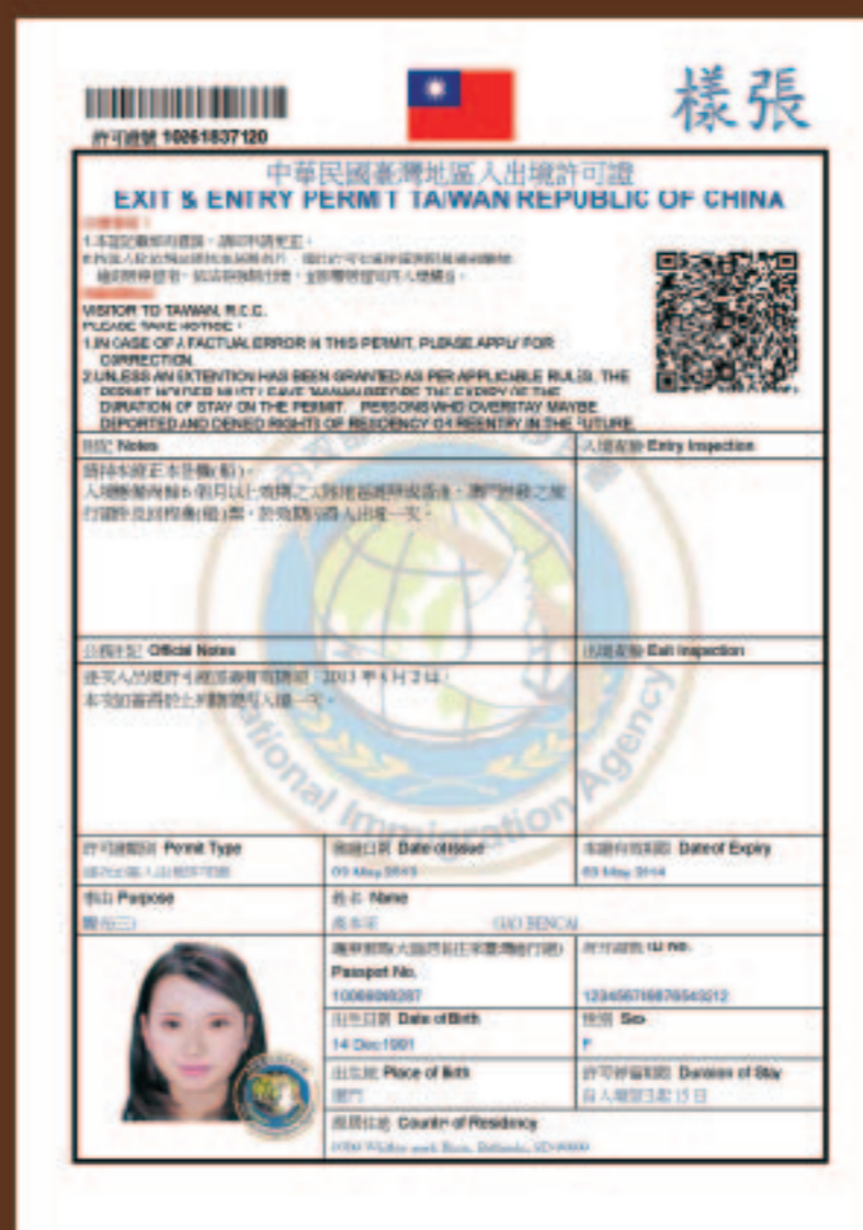
(3) 移民署蓋有入境章 戳之入出境許可證