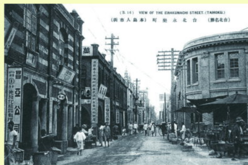
▲1930年代的永樂町（今迪化街）