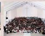
2008年台北衛理堂55週年會友合影