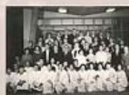
第二代學生中心落成典禮，安放磨角石後與會者合影