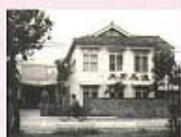
1954~1962時的學生中心，從照片中還可以看出當時的詩班制服竟然是深色的，相當特別的新生南路還很窄小，路旁有有蓋的福公圳