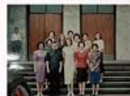
聖家堂是許多外國元首參加彌撒及朝聖的聖堂-本圖為1992年拉脫維亞總統夫人蒞臨