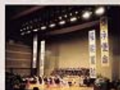
1994年台北靈糧堂40週年慶