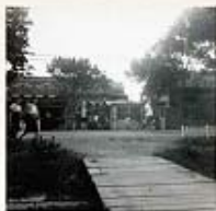
臺一冰店創始人古先生於新生南路3段自行搭建木橋橫越瑠公圳道