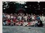
1993年5月23日聖家堂前往關西苔林越榕院朝聖及捐助新竹仁愛智障中心