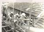
1962年鍾教士向美國教會募款，改建第二代的學生中心，此為施工情形