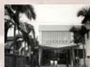
當年的學生中心，門外花木扶疏