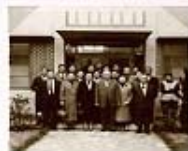
1961年1月於福音團契長老牧師及退休會全體合影