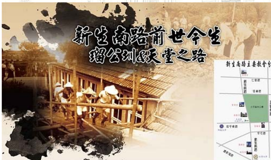
新生南路主要教會分布圖