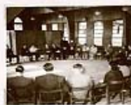
1961年1月於福音團契交流