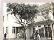
1969年購買信義女舍(教牧宿舍現址)，11月完成二層樓建築，此為奉獻後喬遷時留影