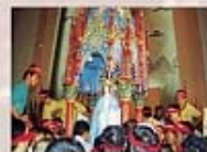
2002年屏東萬金聖母全台巡迴繞境-福臨聖家堂