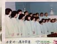
1984年衛理堂31週年堂慶