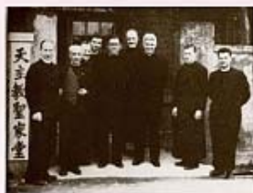
1952年創堂神父合影於第一座聖堂(安東街)

「聖家堂」的建築外觀鳥瞰呈十字架型，堂高63尺，帳棚式的建築，使人無空間壓迫感及視覺障礙而能靜心靈修，舉心向上。聖堂內巧妙運用彩繪玻璃及天光，使「聖家堂」呈現自然神聖的氛圍，好像進入神聖的聖地，掃除人內心世俗的煩擾。聖堂內所呈現宗教意涵的一景一物，使人與神聖更加接近，宛若進入天主的家。「聖家堂」主內弟兄姊妹們的使命，是尋求不同團體和善會的聯合互動；建設一個生動活潑的教會，以實踐宗教的信仰，並傳播給他人。培育有德行、有能力、有熱情的領導者，以推動教會工作和促進天主子民的團結。