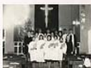
1959年時，真理堂內部景觀，當年聖誕節，服事的同工於聖壇前留影