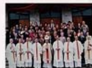
1992年12月27日台北總教區聖家堂建堂40週年結婚滿週年夫婦祝禱紀念活動