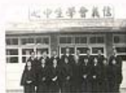
1954~1962時的學生中心，從照片中還可以看出當時的詩班制服竟然是深色的，相當特別