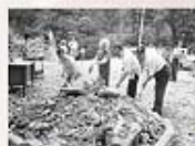
1983年改建靈糧堂教大樓破土典禮