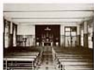
1958年白神父將老堂拆除後用禮堂2樓做為臨時聖堂(第三座聖堂)