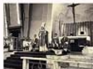
1965年羅光主教蒞臨聖家堂主持彌撒及證道