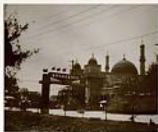
民國49年臺北清真寺落成，前面道路即為新生南路，左下方即是瑠公圳