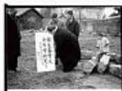
1957年2月台北靈糧堂舉行破土禮