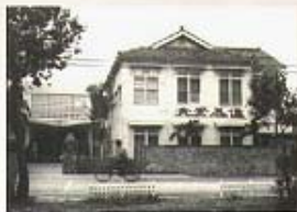
真理堂1954~1962時的學生中心，前方的新生南路還很窄小，路旁為瑠公圳