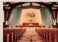
現今聖家堂(聖堂正殿)