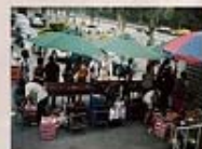
2006年7月9日聖家堂協助尖石區原住民-水蜜桃面銷活動