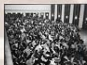
1999年靈糧山莊第1次主崇