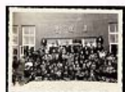
1954年，真理堂弟兄姊妹合影