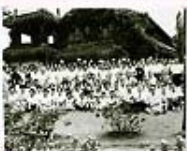
1961年全教會大會合影