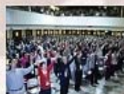
靈糧山莊聚會實景