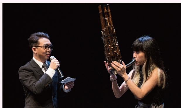
國家兩廳院以「新上市投資說明會」方式用網路直播介紹「新點子實驗場」計畫演出。