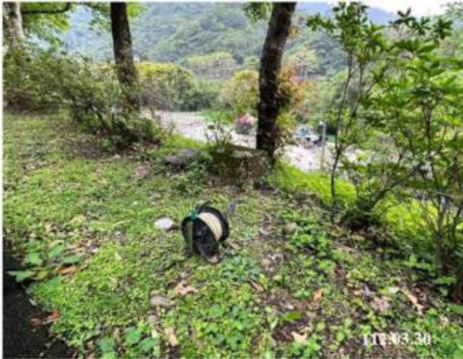
3 月 份 水 位 觀 測 (W51)