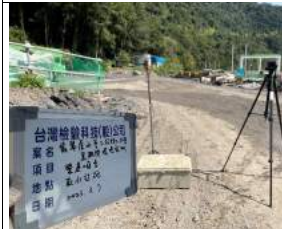
營建噪音(取水設施)