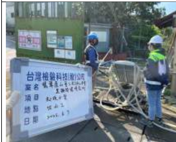
工區放流水(出水工)