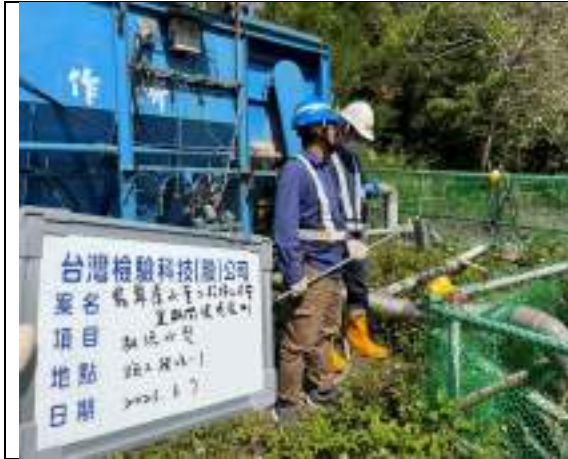
工區放流水(1號施工橫坑)