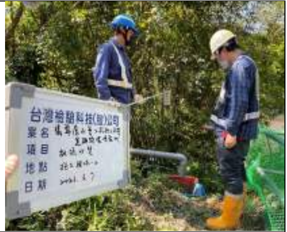
工區放流水(2號施工橫坑)