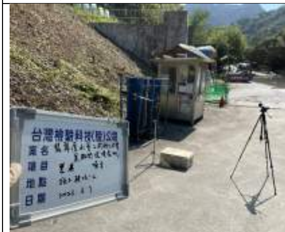
營建噪音(2號施工橫坑)