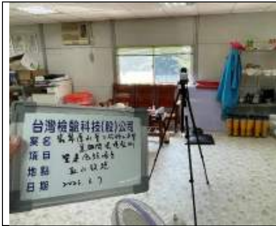
低頻噪音(取水設施)