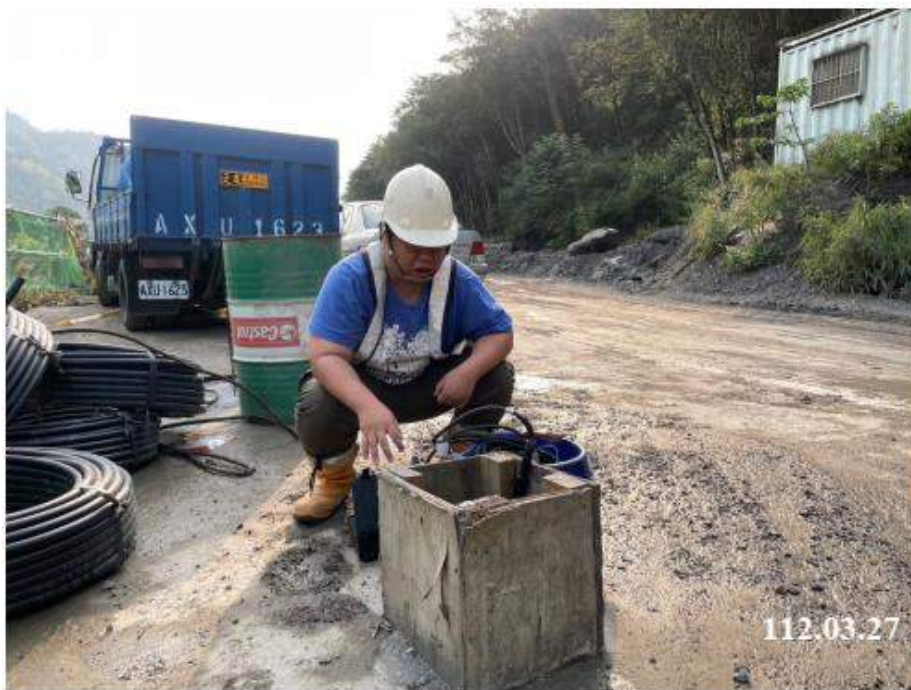
3 月 份 傾 斜 觀 測 (C11)