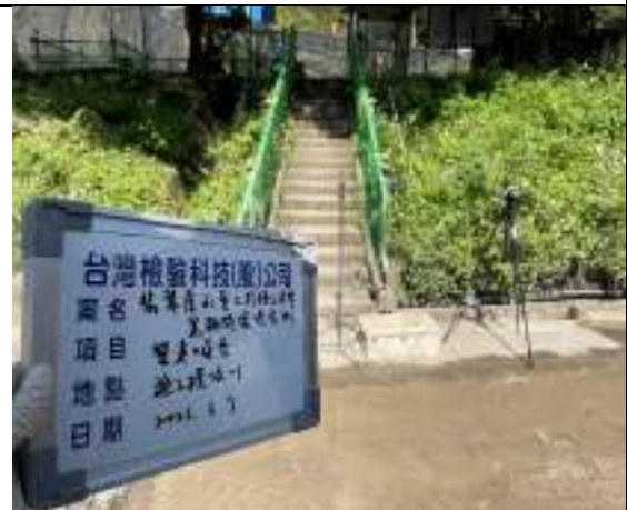
營建噪音(1號施工橫坑)