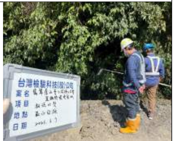
工區放流水(取水設施)