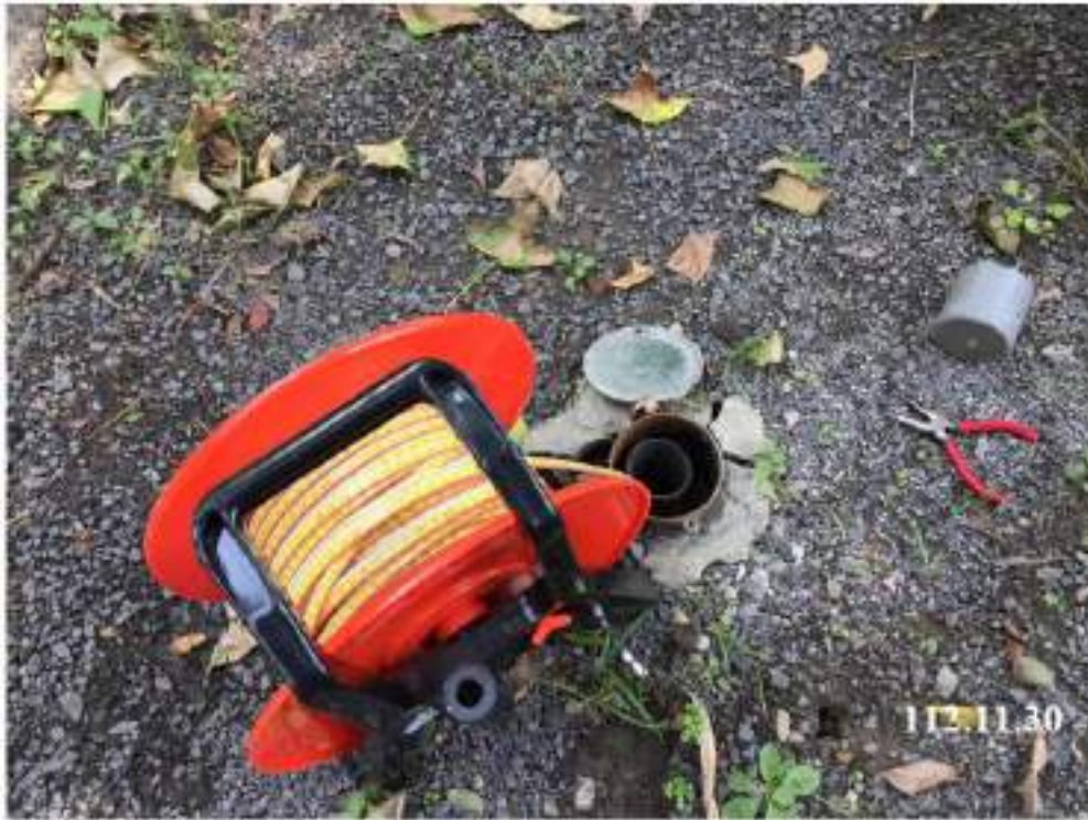
11 月 份 水 位 斜 觀 測 (W51)