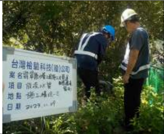
工區放流水(2號施工橫坑)