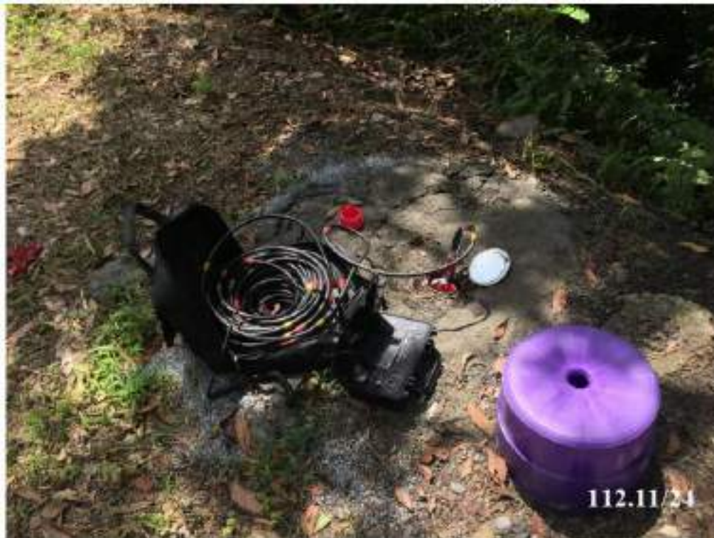
11 月 份 傾 斜 觀 測 (C62)