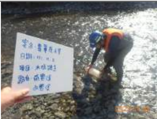
蝦蟹螺貝類調查(放置蝦籠)