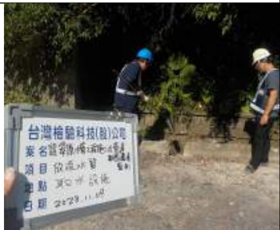
工區放流水(取水設施)