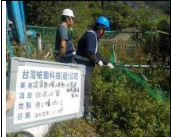
工區放流水(1號施工橫坑)