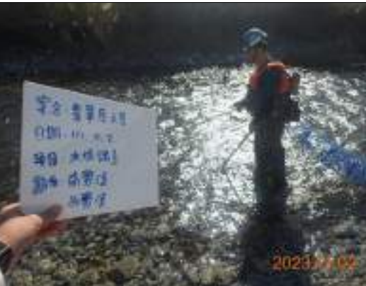
魚類調查(電魚工作照)