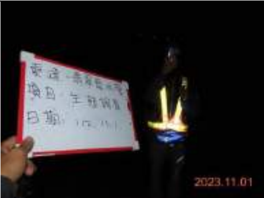
蝙蝠超音波偵測調查工作照