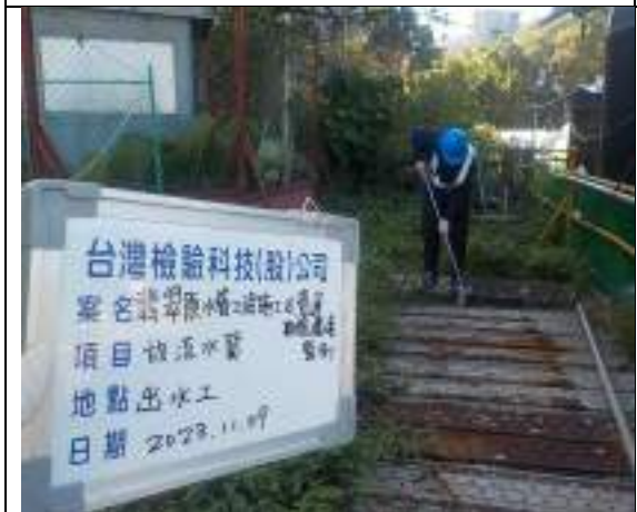
工區放流水(出水工)