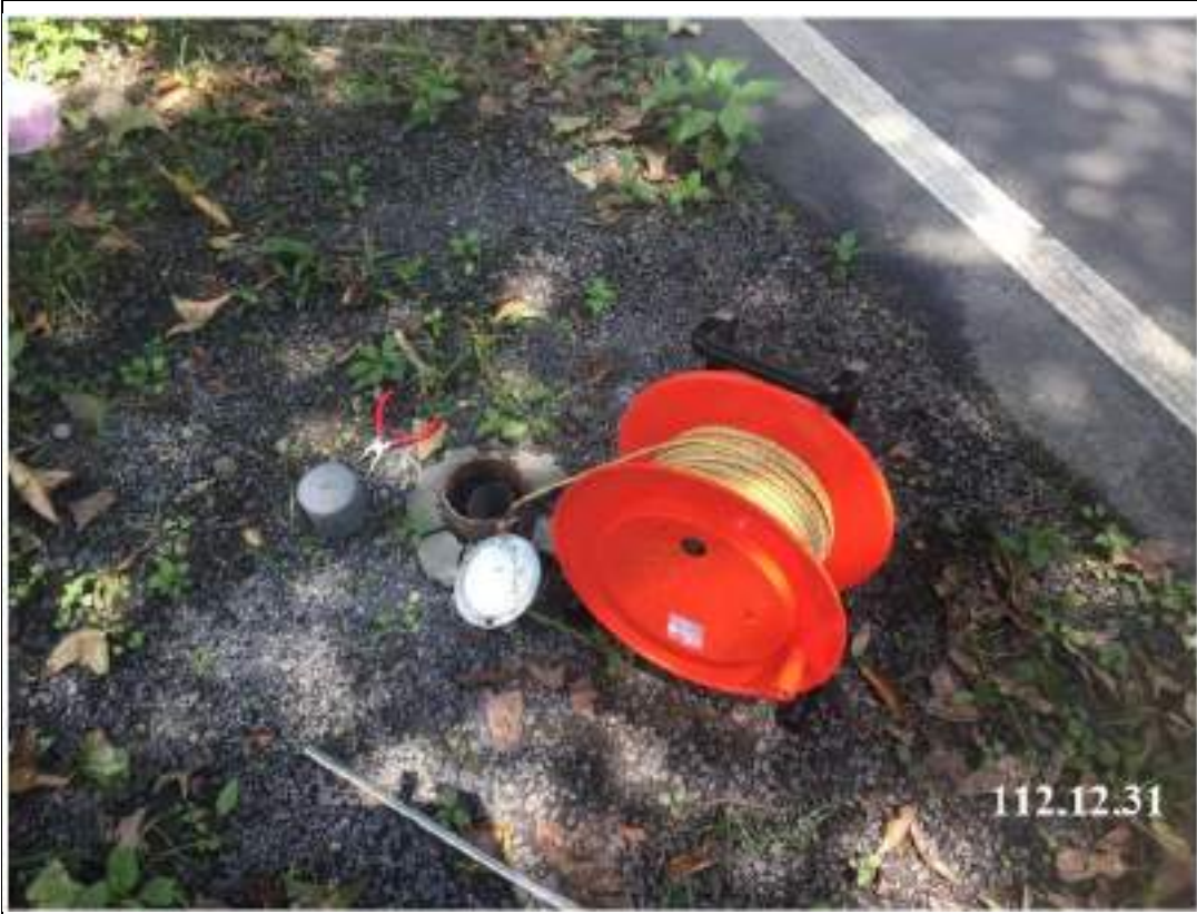
12 月 份 水 位 觀 測 (W51)