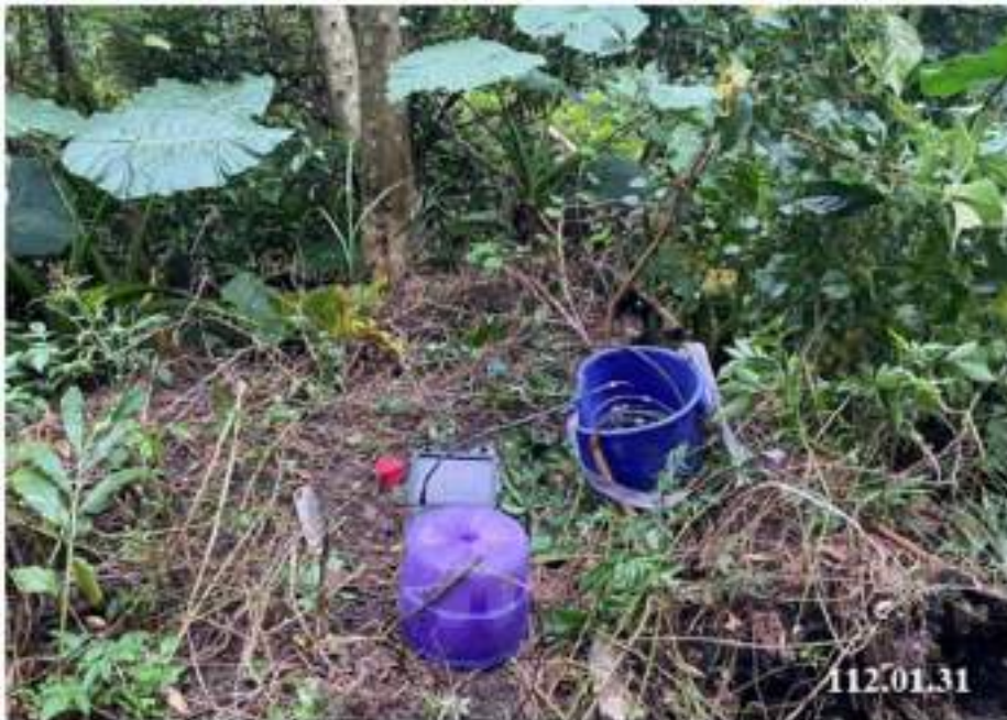
10 月 份 傾 斜 觀 測 (C61)