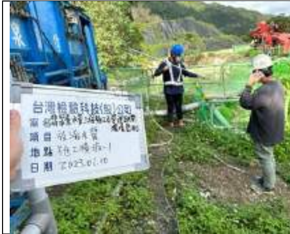
工區放流水(1號施工橫坑)