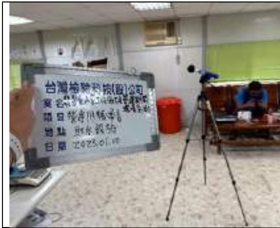
低頻噪音(取水設施)