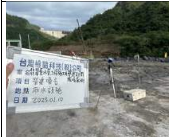
營建噪音(取水設施)