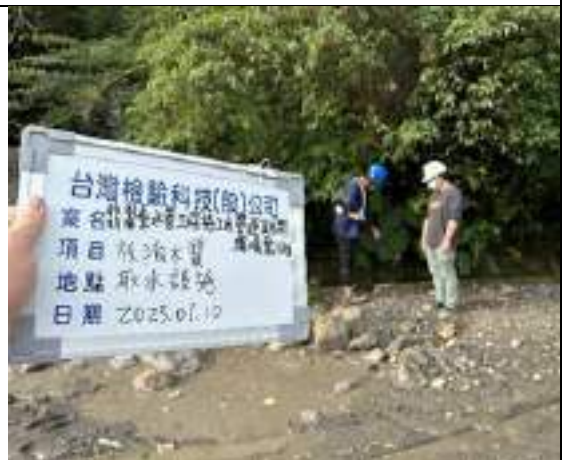
工區放流水(取水設施)