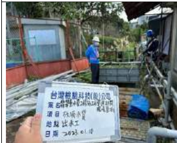
工區放流水(出水工)