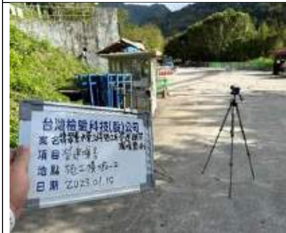
營建噪音(2號施工橫坑)