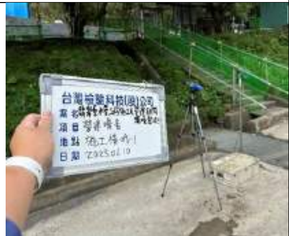
營建噪音(1號施工橫坑)