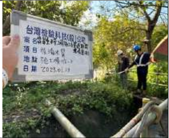
工區放流水(2號施工橫坑)