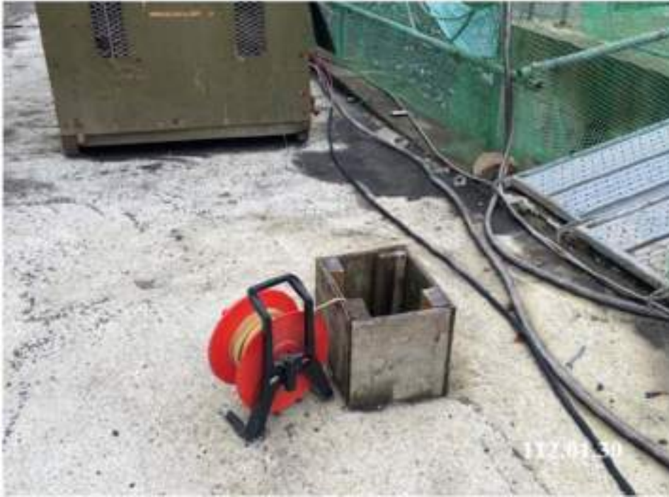
10 月 份 水 位 觀 測 (W11)