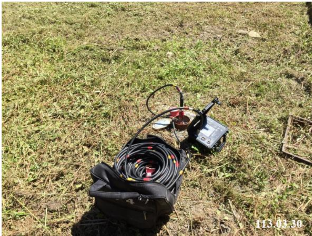
3 月 份 傾 斜 觀 測 (C22)