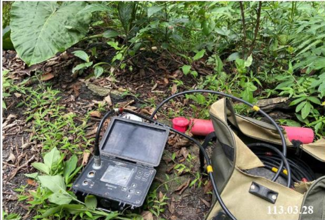
3 月 份 水 位 觀 測 (C62)