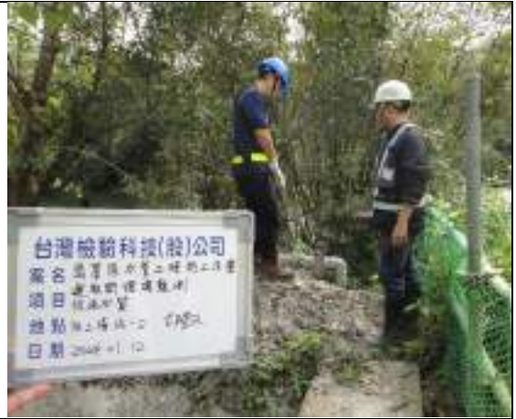
工區放流水(2號施工橫坑)