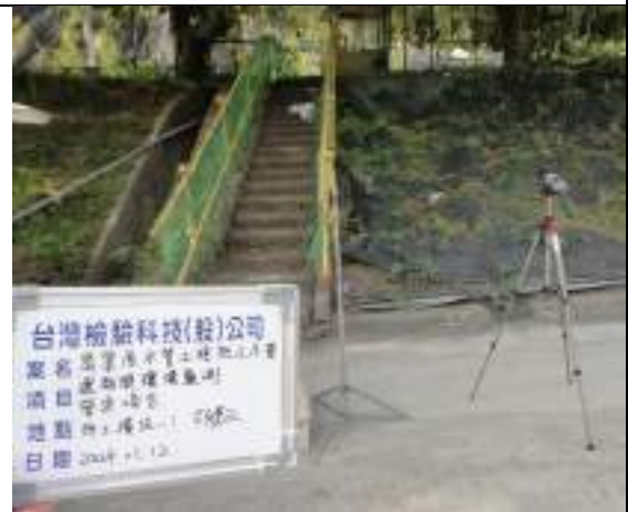
營建噪音(1號施工橫坑)