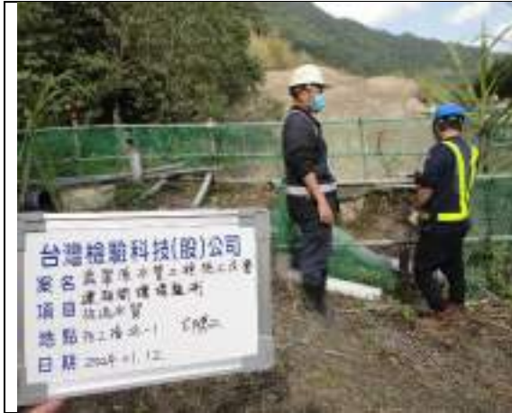
工區放流水(1號施工橫坑)