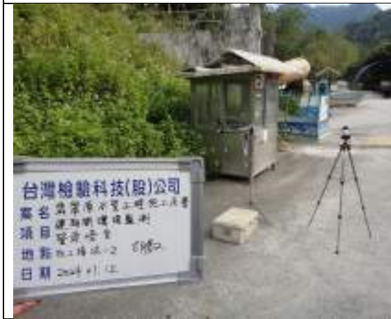
營建噪音(2號施工橫坑)