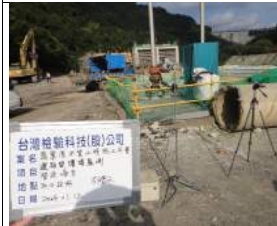
營建噪音(取水設施)