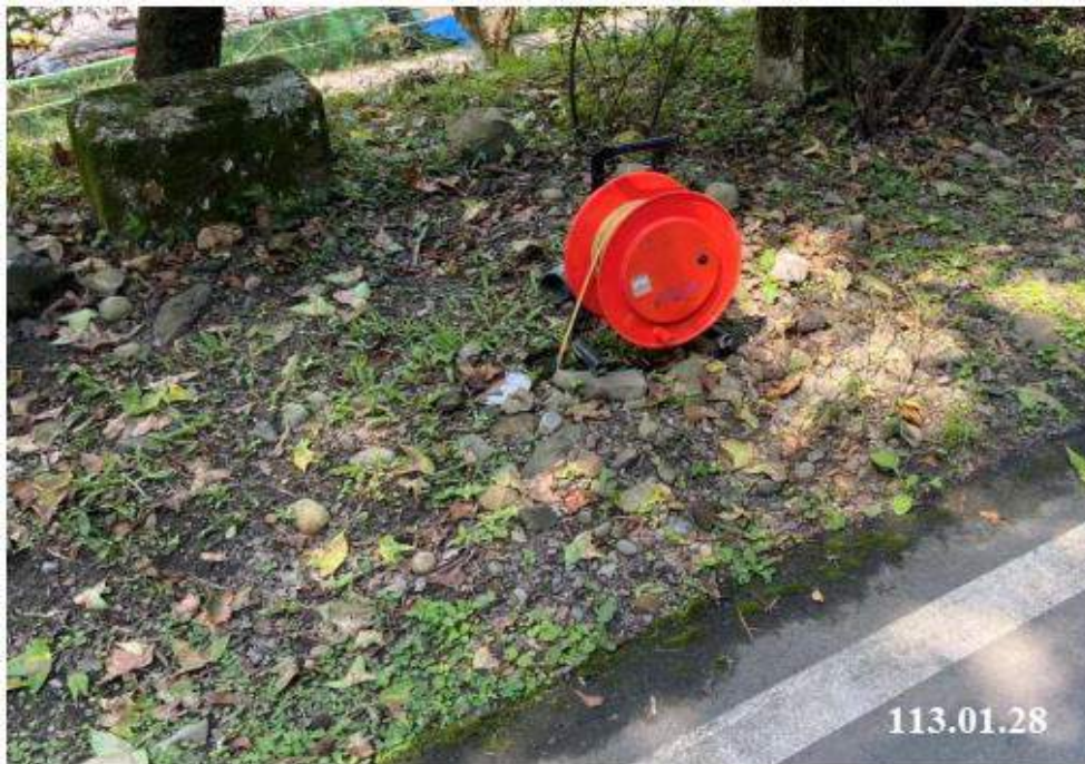
1 月 份 傾 斜 觀 測 (C51)