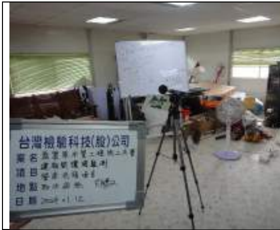
低頻噪音(取水設施)