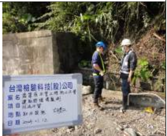
工區放流水(取水設施)