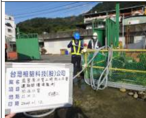
工區放流水(出水工)