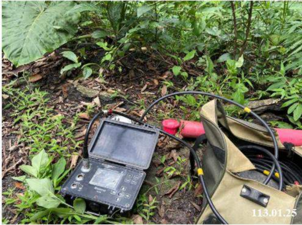
1 月 份 傾 斜 觀 測 (C61)