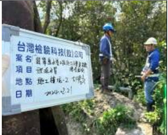
工區放流水(2號施工橫坑)