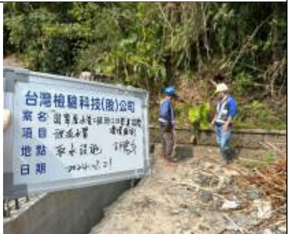
工區放流水(取水設施)