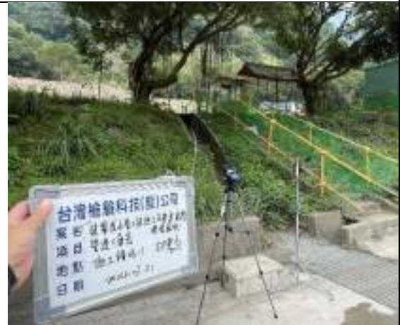
營建噪音(1號施工橫坑)