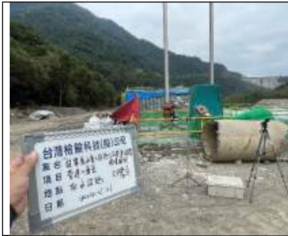
低頻噪音(取水設施)