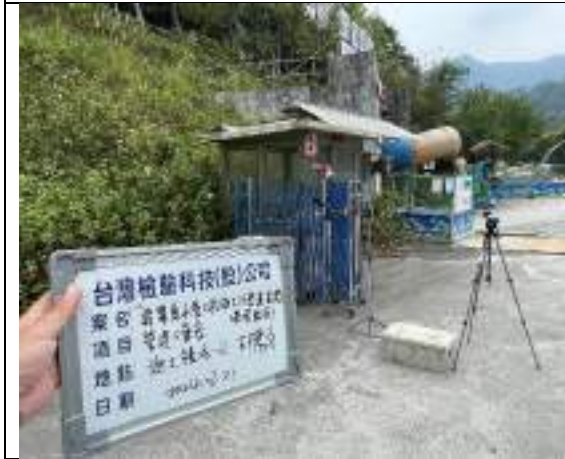
營建噪音(2號施工橫坑)