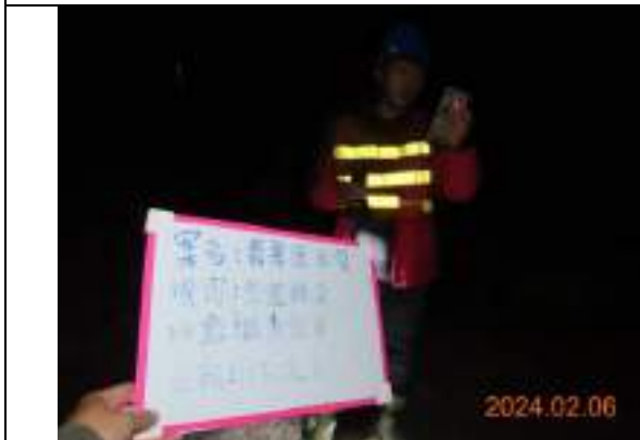
蝙蝠超音波偵測調查工作照