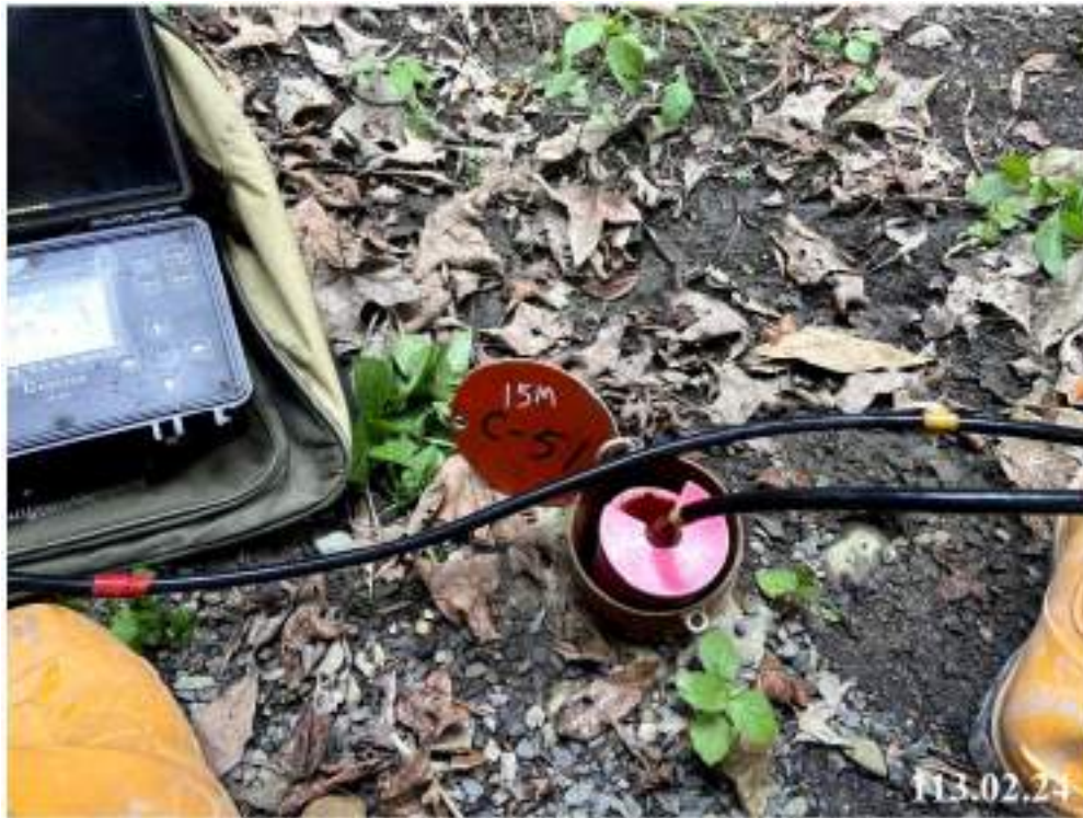
2 月份傾斜觀測 (C51)