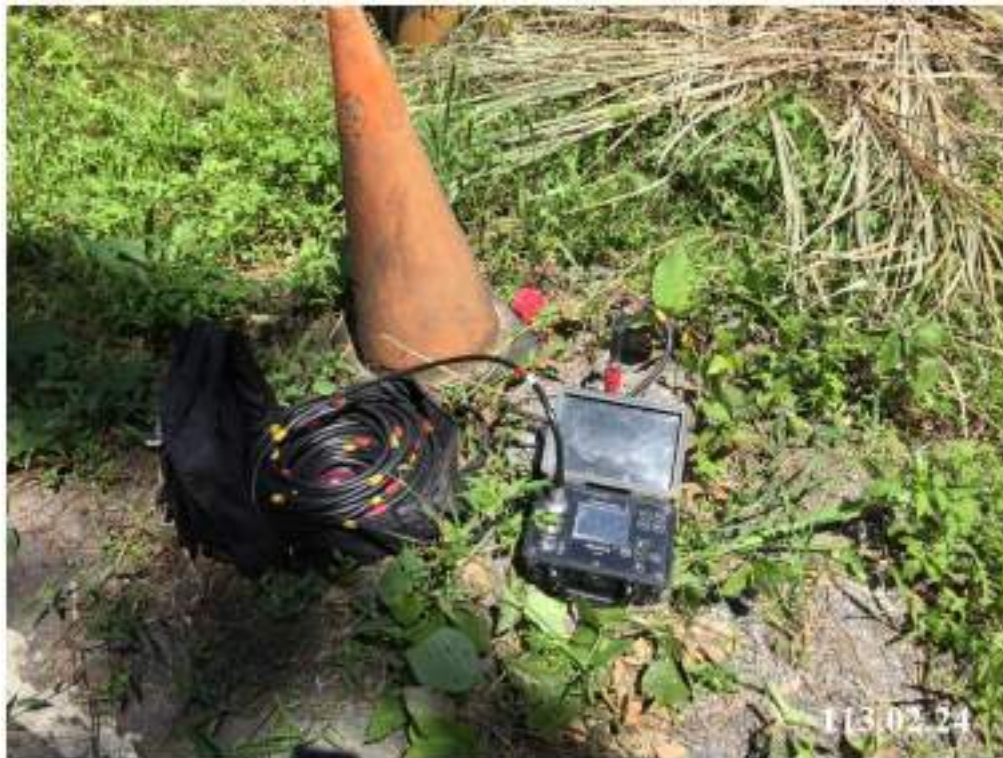
2 月份傾斜觀測 (C21)