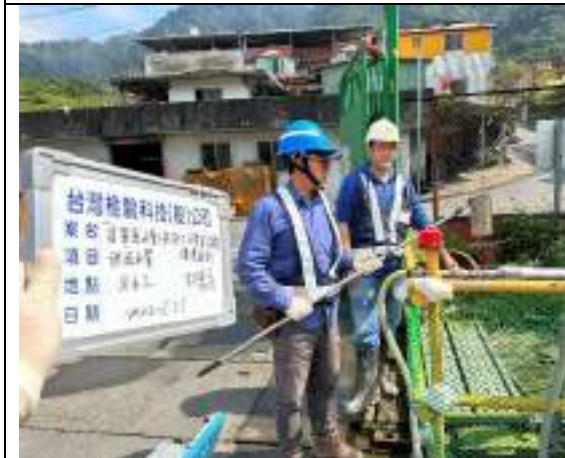
工區放流水(出水工)