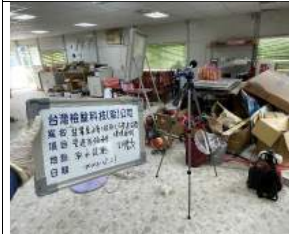
營建噪音(取水設施)