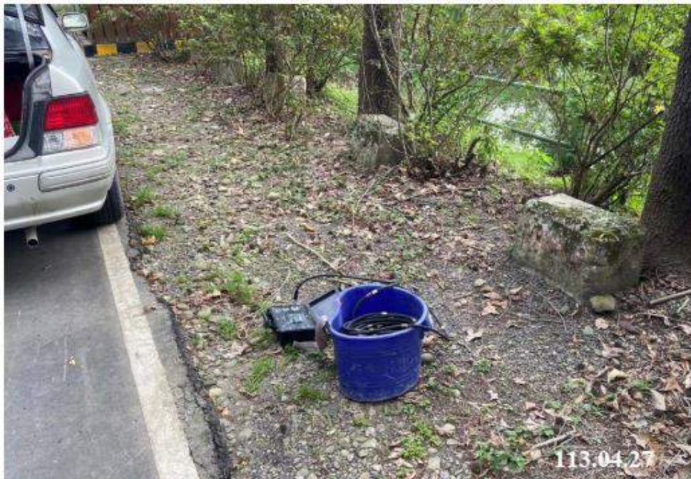
4 月 份 傾 斜 觀 測 (C51)