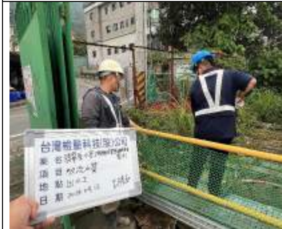
工區放流水(出水工)