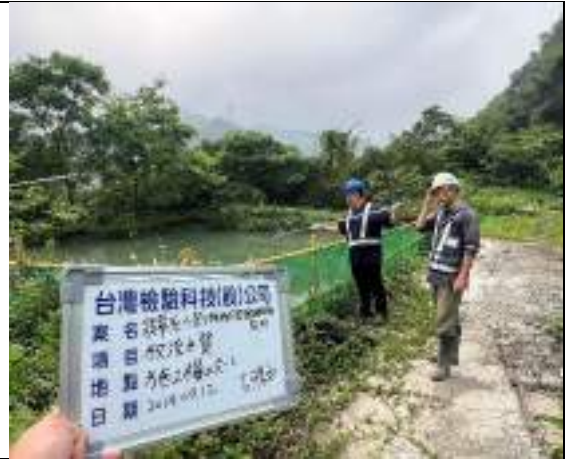
工區放流水(2號施工橫坑)