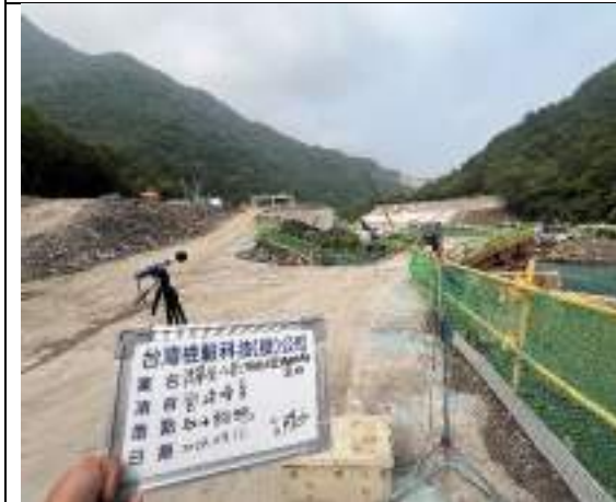
營建噪音(取水設施)