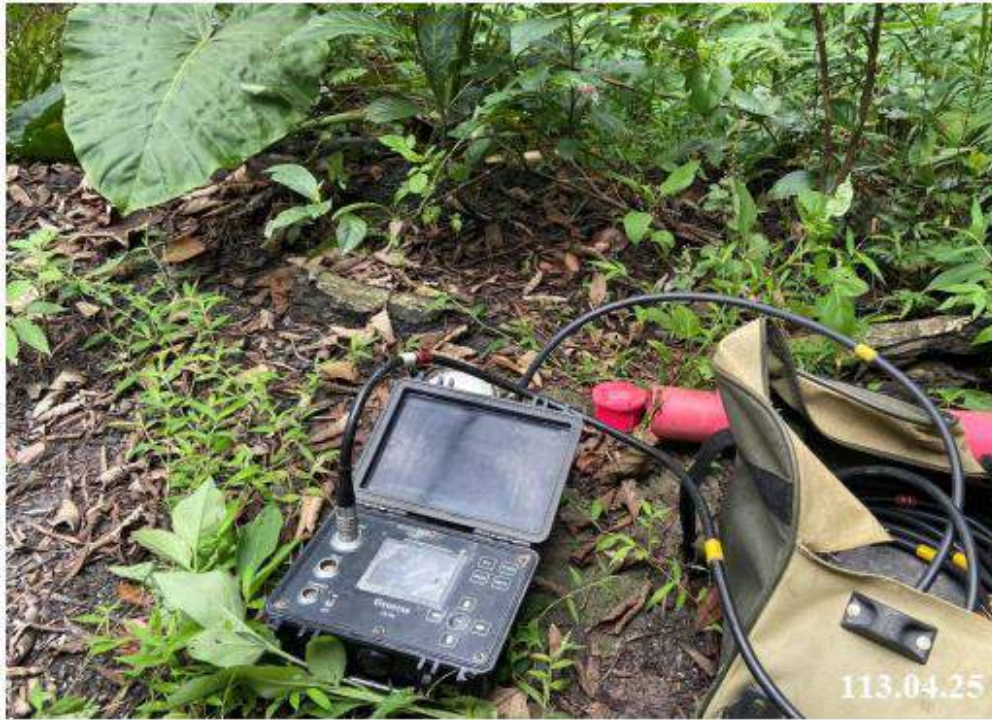
4 月 份 傾 斜 觀 測 (C62)