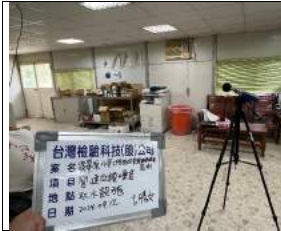
低頻噪音(取水設施)