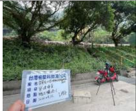
營建噪音(1號施工橫坑)