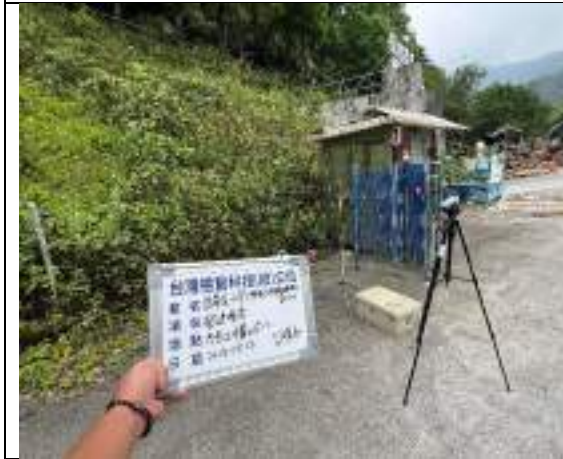
營建噪音(2號施工橫坑)