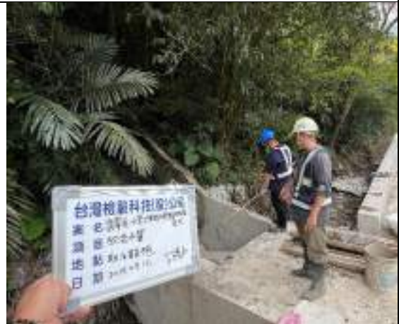
工區放流水(取水設施)