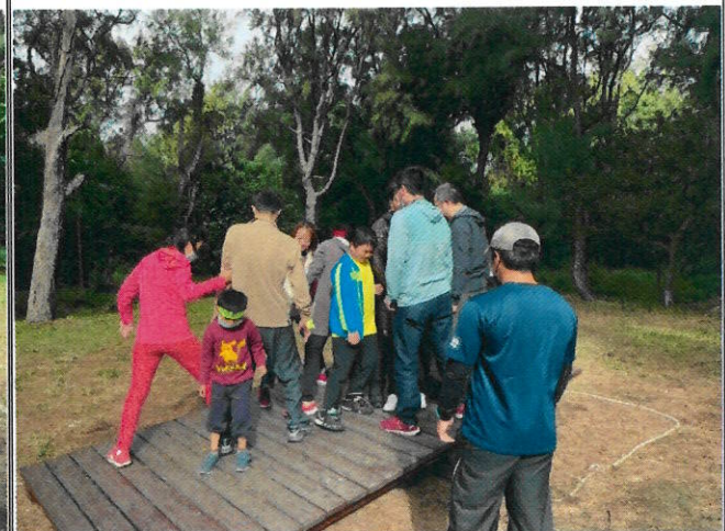
18.19. 桃園新屋親子旅遊活動 - 在分組活動中學會彼此關照與合作才能安全取得平衡。團隊的目標要靠每一份子的彼此照應。