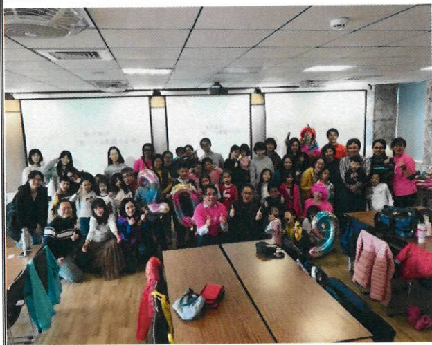
3. 冬日暖心辦理歲末感恩餐會 凝聚情感