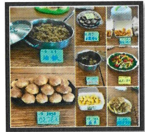
4. 一家一菜 美食饗宴 家庭溫馨互動