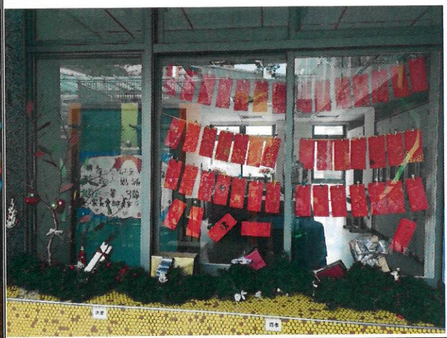
2. 利用作品營造節日氣氛創造生活趣味