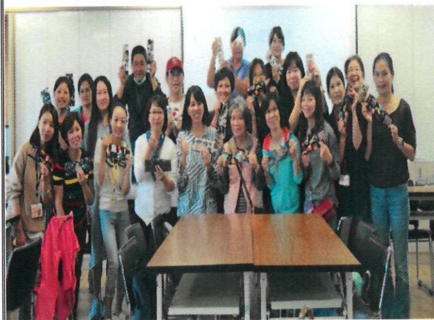
7. 辦理親職講座《神老師-作孩子生命中的貴人》幫助家長認識特教生特質，有助提升教養策略。