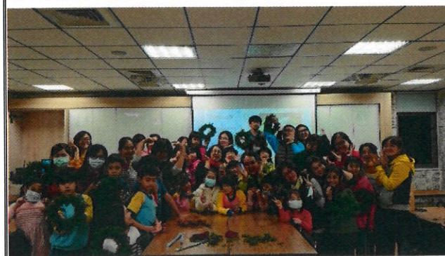
9. 開心手作-環保餐具包 DIY，用行動愛地球，大家一起來。