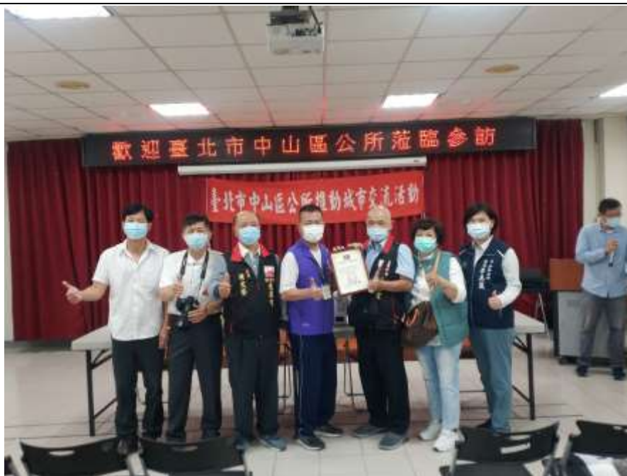
相片內容說明：南澳鄉鄉長致贈感謝狀給文昌宮