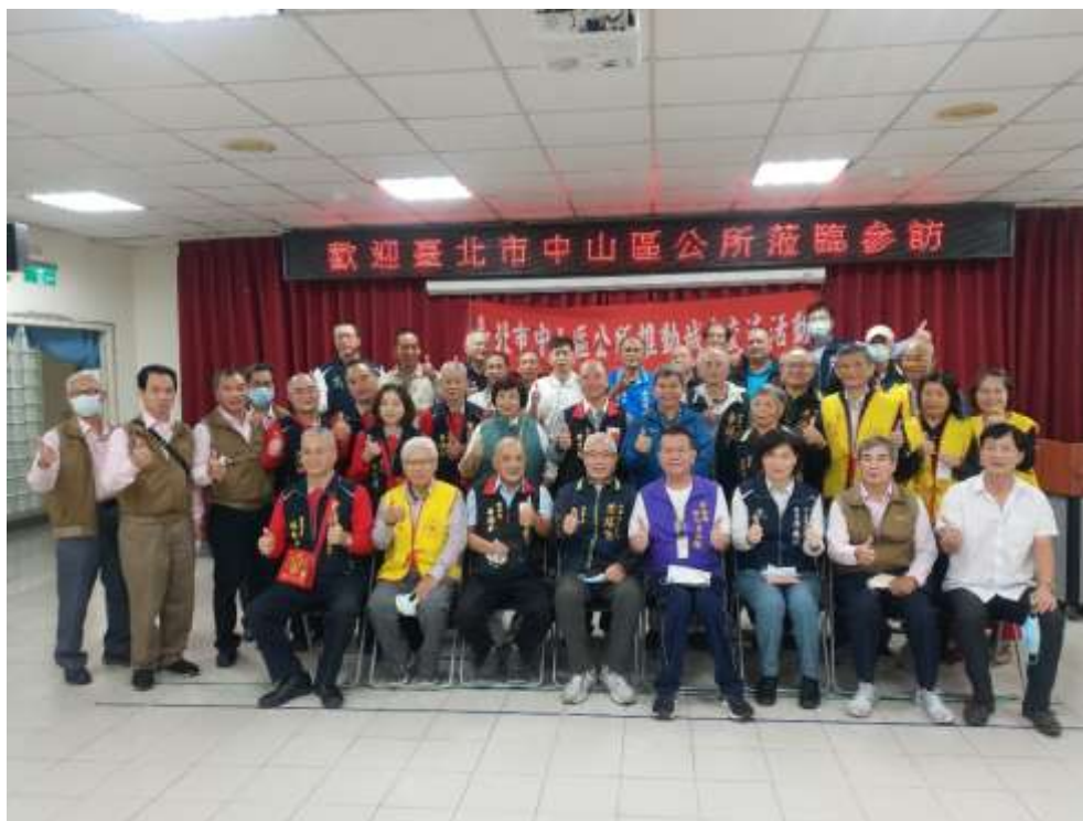
相片內容說明：本區參訪人員與南澳鄉公所出席人員合照