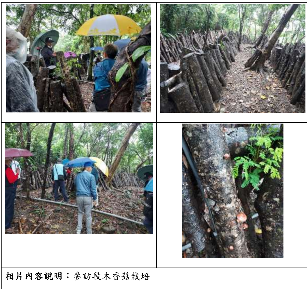
相片內容說明：參訪段木香菇栽培