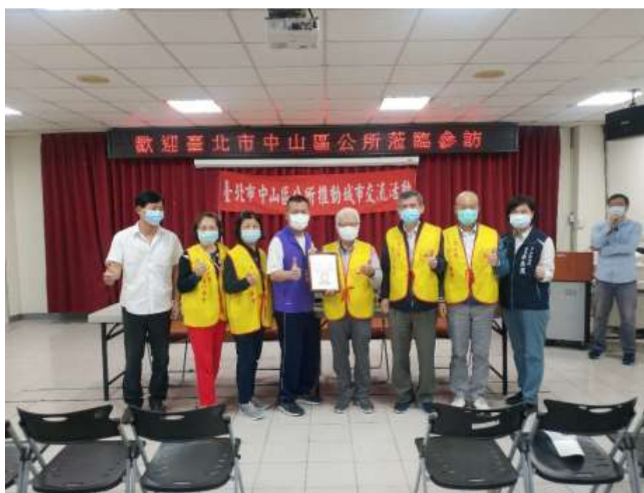
相片內容說明：南澳鄉鄉長致贈感謝狀給愛心行善會