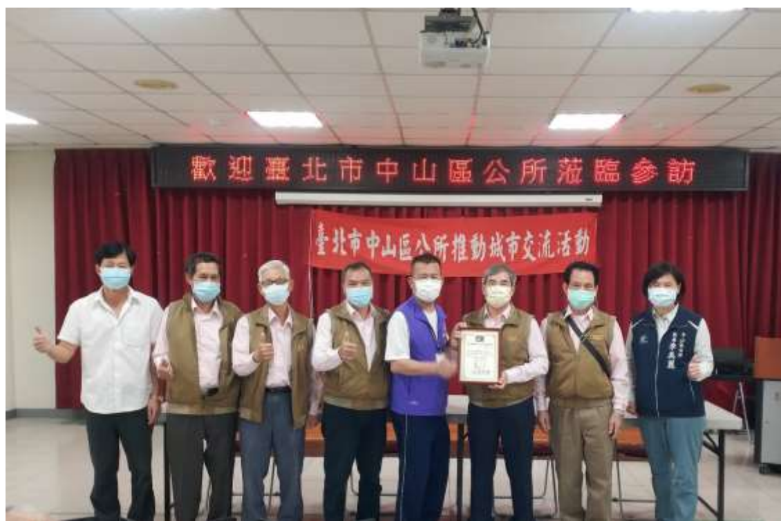
相片內容說明：南澳鄉鄉長致贈感謝狀給植福宮