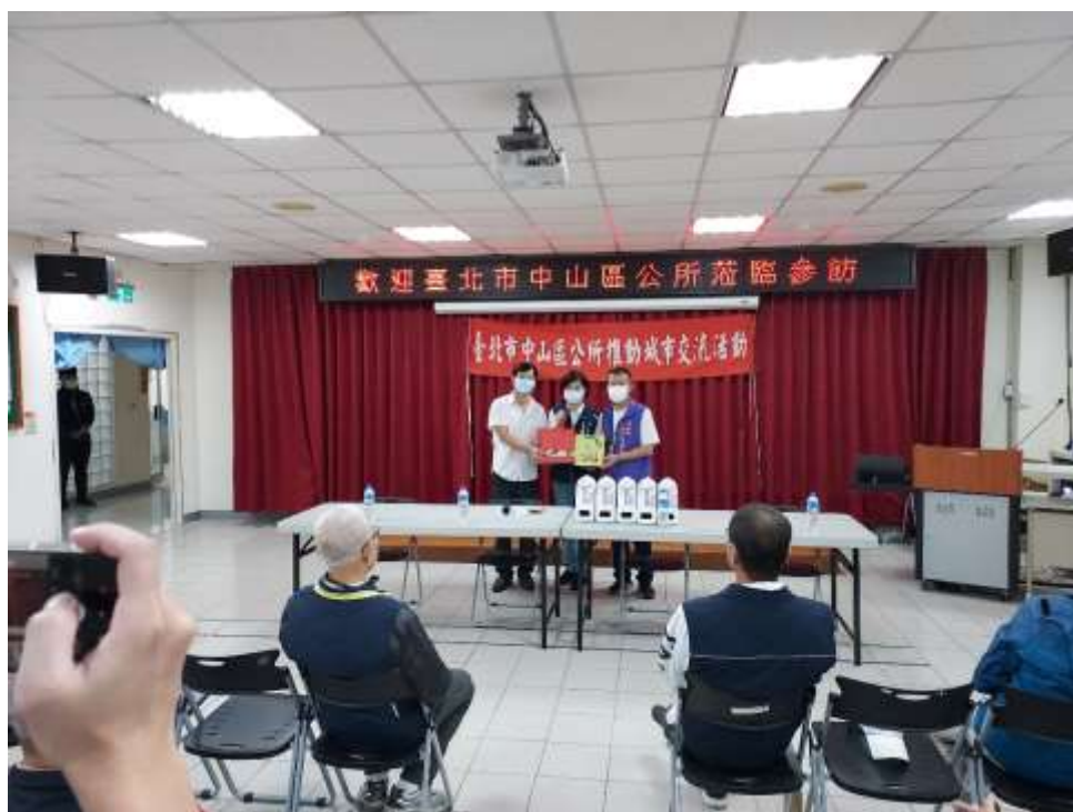
相片內容說明：愛心送暖-本區區長贈與伴手禮品