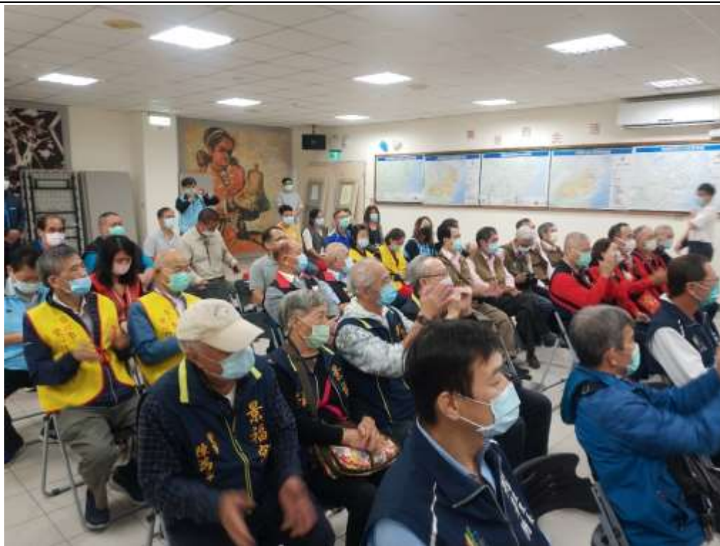
相片內容說明：本區參訪團熱烈參與交流過程