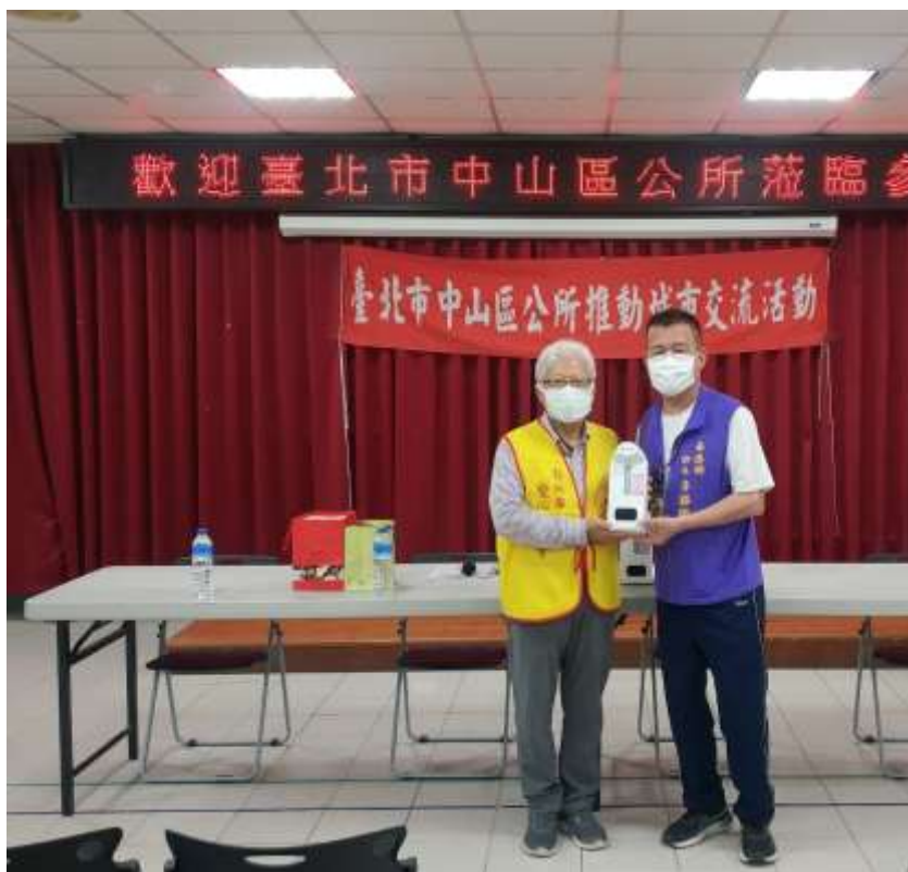
相片內容說明：愛心送暖-愛心行善會代表捐贈防疫物資