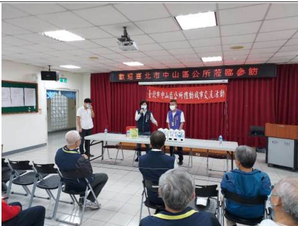
相片內容說明：愛心送暖-本區區長介紹捐贈之防疫物資-體溫計