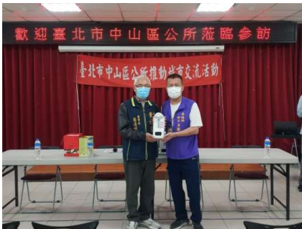
相片內容說明：愛心送暖-景福宮代表捐贈防疫物資