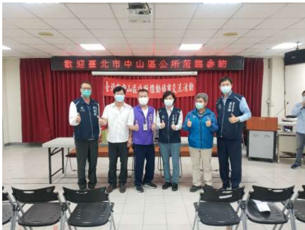
相片內容說明：與本區參與里長合照