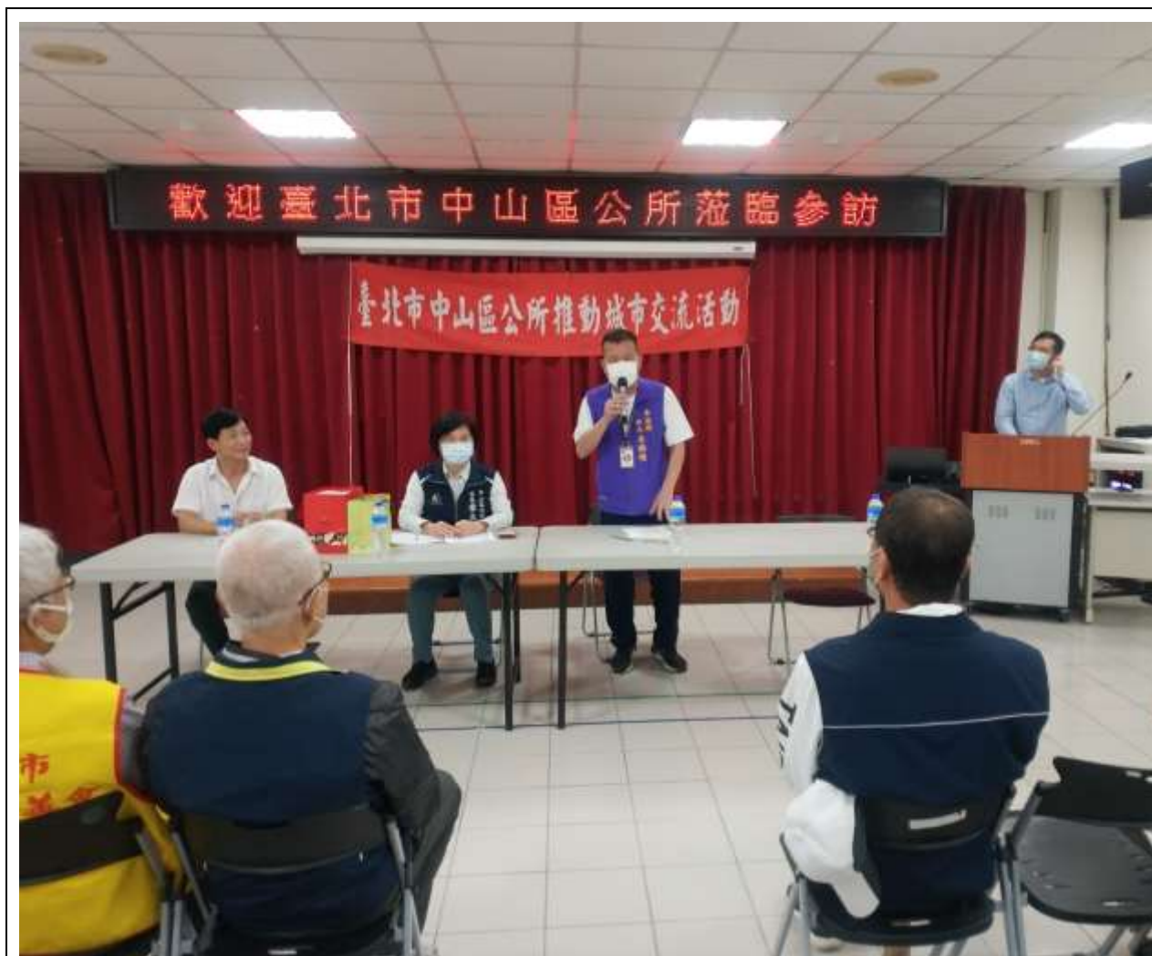
相片內容說明：南澳鄉鄉長致歡迎詞暨介紹出席人員