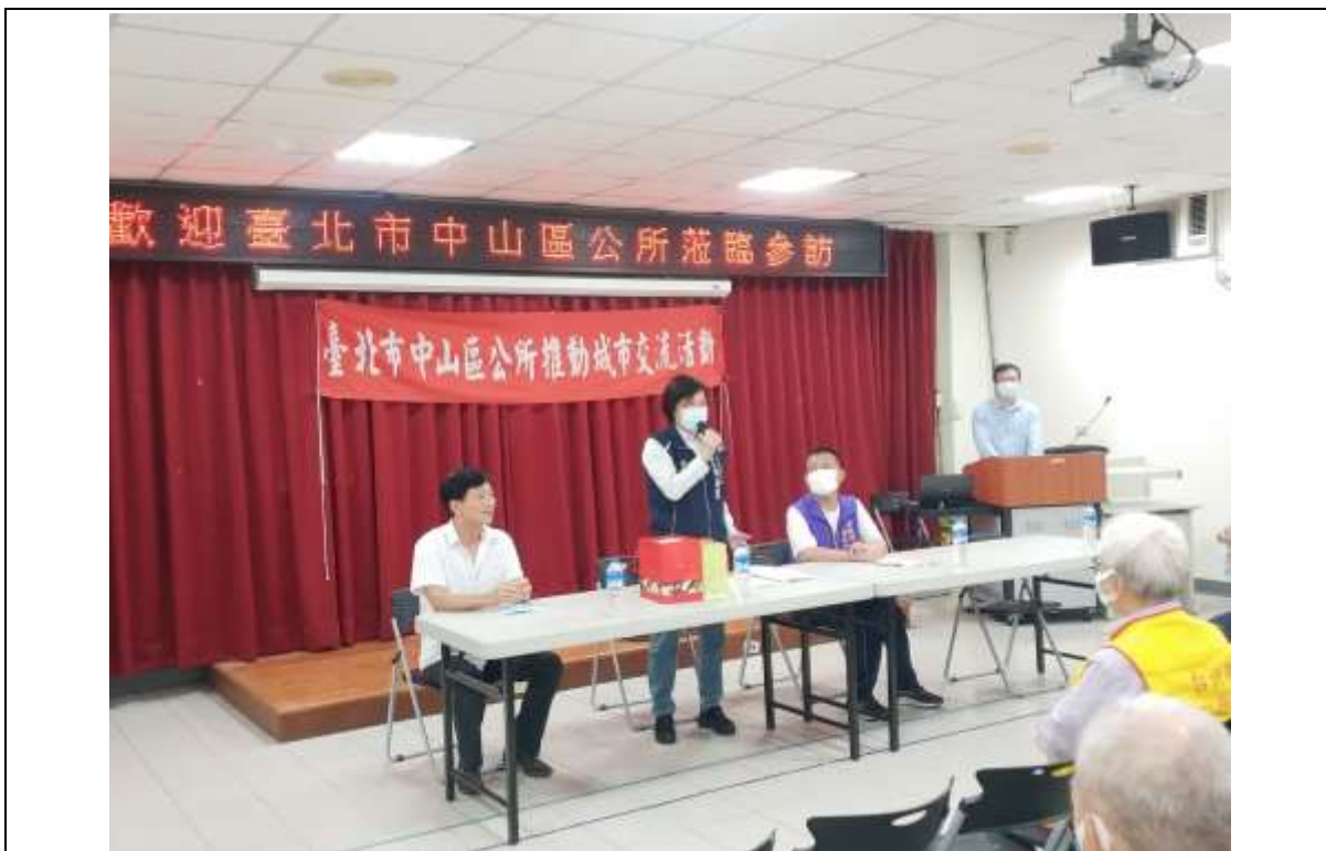
相片內容說明：本區區長致感謝詞暨介紹隨行人員