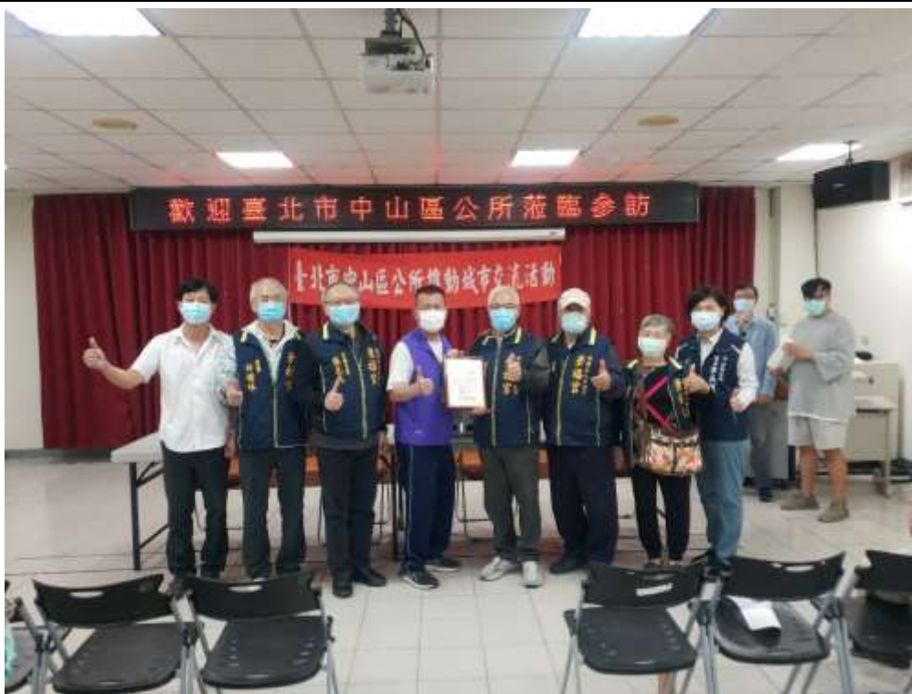
相片內容說明：南澳鄉鄉長致贈感謝狀給景福宮