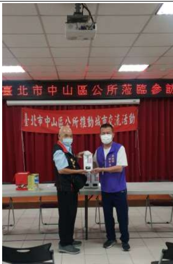
相片內容說明：愛心送暖-文昌宮代表捐贈防疫物資