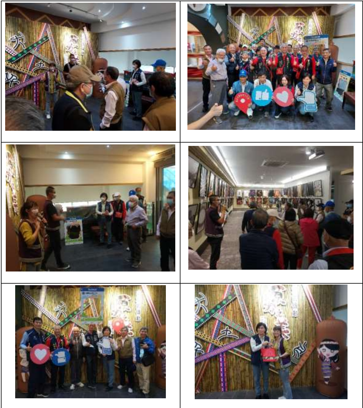
相片內容說明：參訪南澳泰雅文化館

宜蘭縣南澳鄉泰雅文化館係以泰雅族為主的文化館，收藏約有 100 件傳統文物。為一座具有鄉土、民俗色彩的地方博物館，以展示為主，輔以各類教育、研習活動，並結合收藏、保存、維護、教育、推廣等多項功能。展示規劃以南澳泰雅文化為主，包括遷徙史、南澳大記事、籐編區、世界口簧琴、生態觀光等介紹，並有莎韻專區對歷史事實之呈現，使來訪民眾在參觀的過程中，瞭解南澳泰雅文化變遷的歷史過程。(介紹源自原展群博網站)