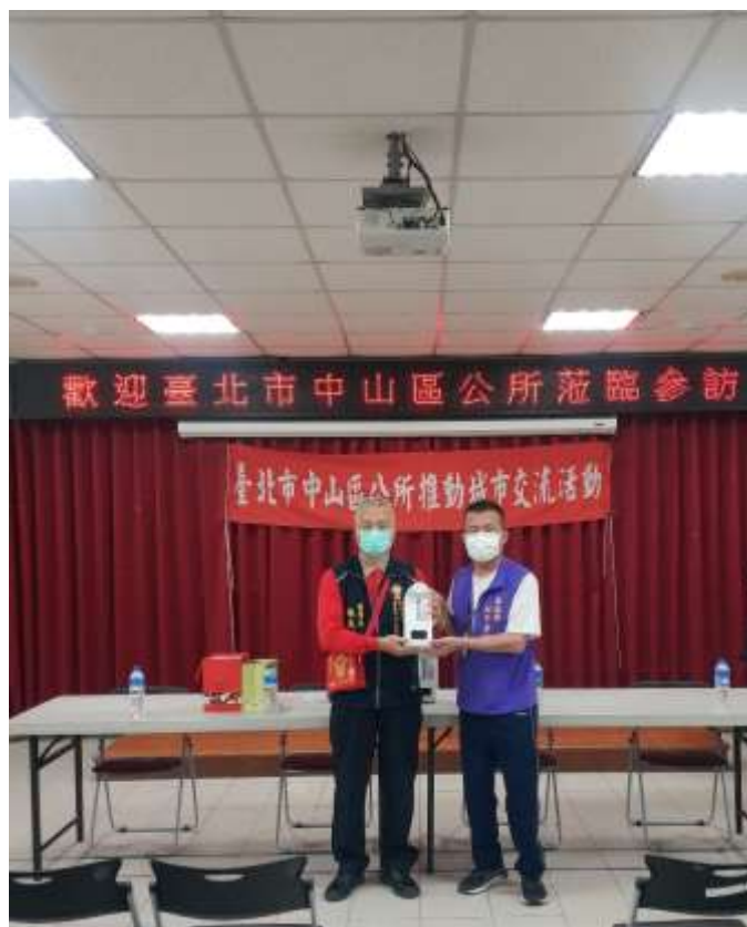
相片內容說明：愛心送暖-中庄仔福德宮代表捐贈防疫物資