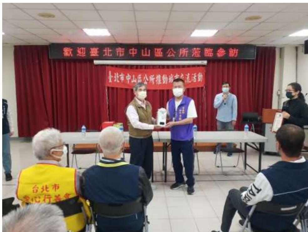
相片內容說明：愛心送暖-植福宮代表捐贈防疫物資