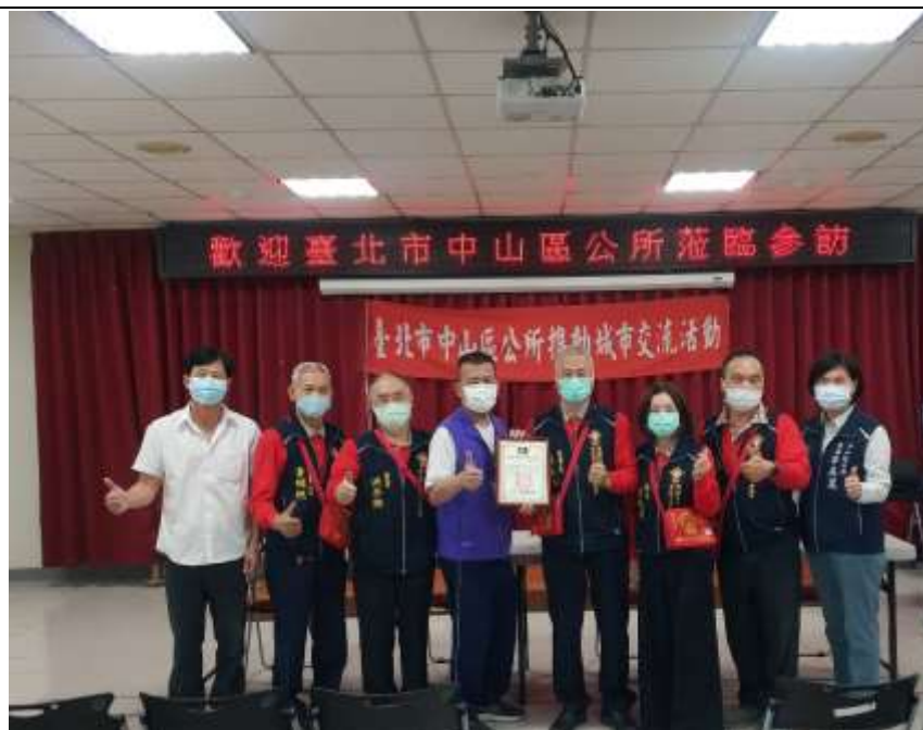
相片內容說明：南澳鄉鄉長致贈感謝狀給中庄仔福德宮