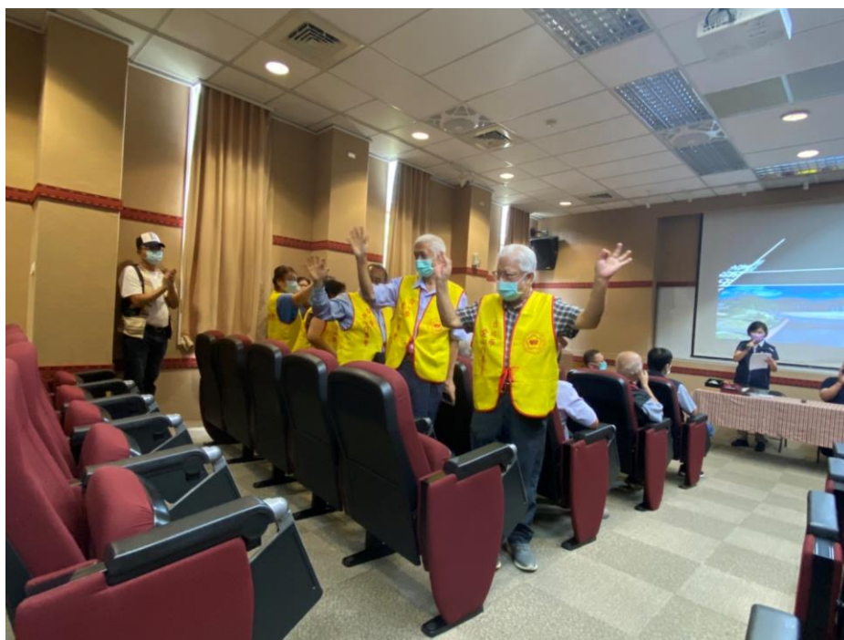
相片內容說明：區長致感謝詞暨介紹隨行人員