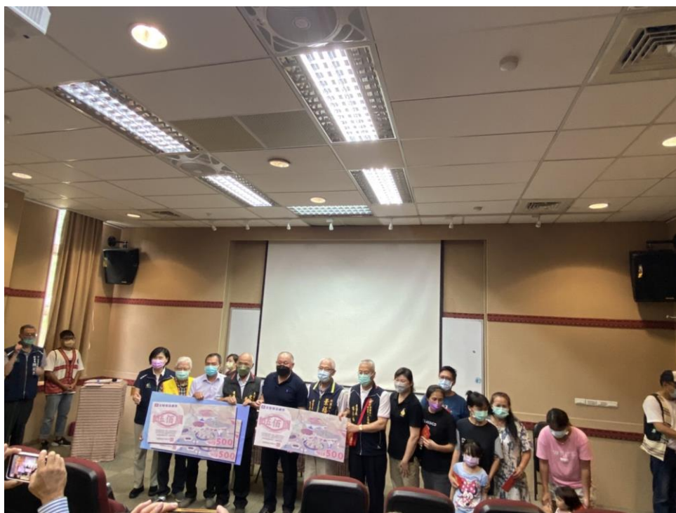
相片內容說明：商品禮券捐贈團體合影