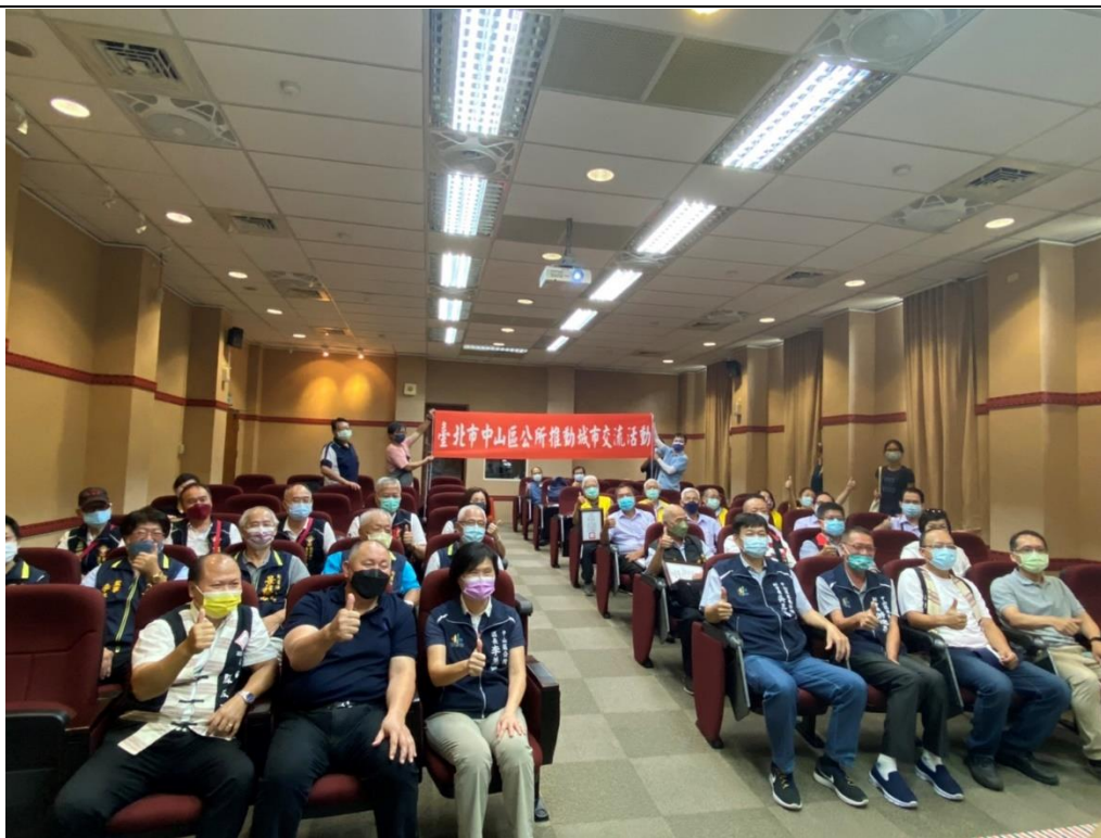
相片內容說明：本區參訪人員與大同鄉公所出席人員合照