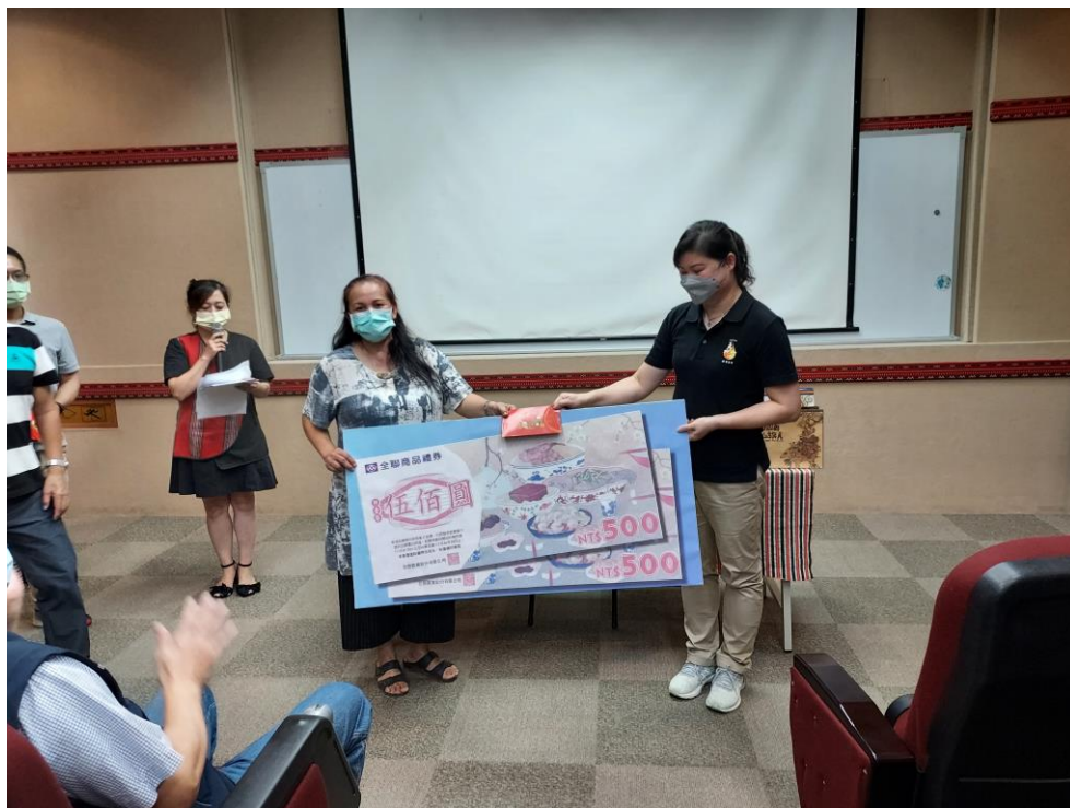
相片內容說明：愛心送暖-真如苑佛教會代表捐贈商品禮券