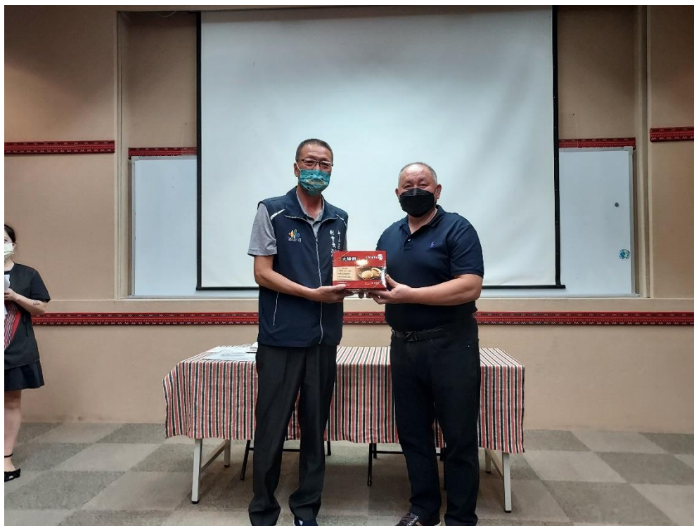
相片內容說明：里長聯誼會副會長代表致贈伴手禮