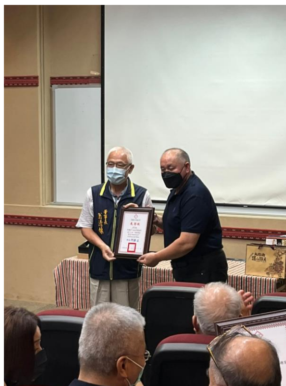
相片內容說明：鄉長致贈感謝狀給景福宮