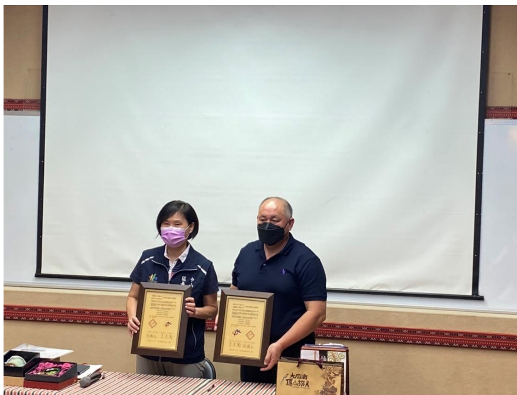
相片內容說明：簽訂友好城市關係共同聲明