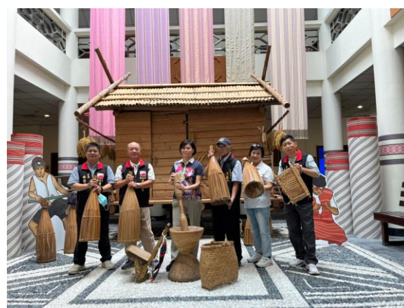
相片內容說明：參訪泰雅生活館