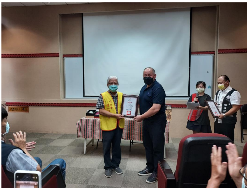
相片內容說明：鄉長致贈感謝狀給愛心行善會