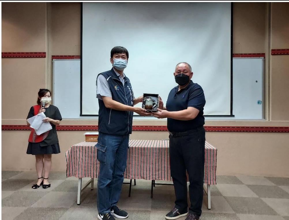
相片內容說明：里長聯誼會副會長代表致贈伴手禮