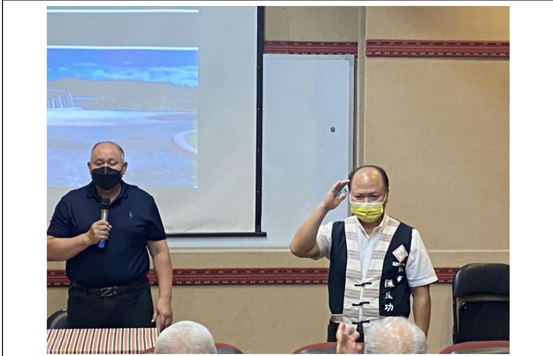
相片內容說明：鄉長致歡迎詞暨介紹出席人員