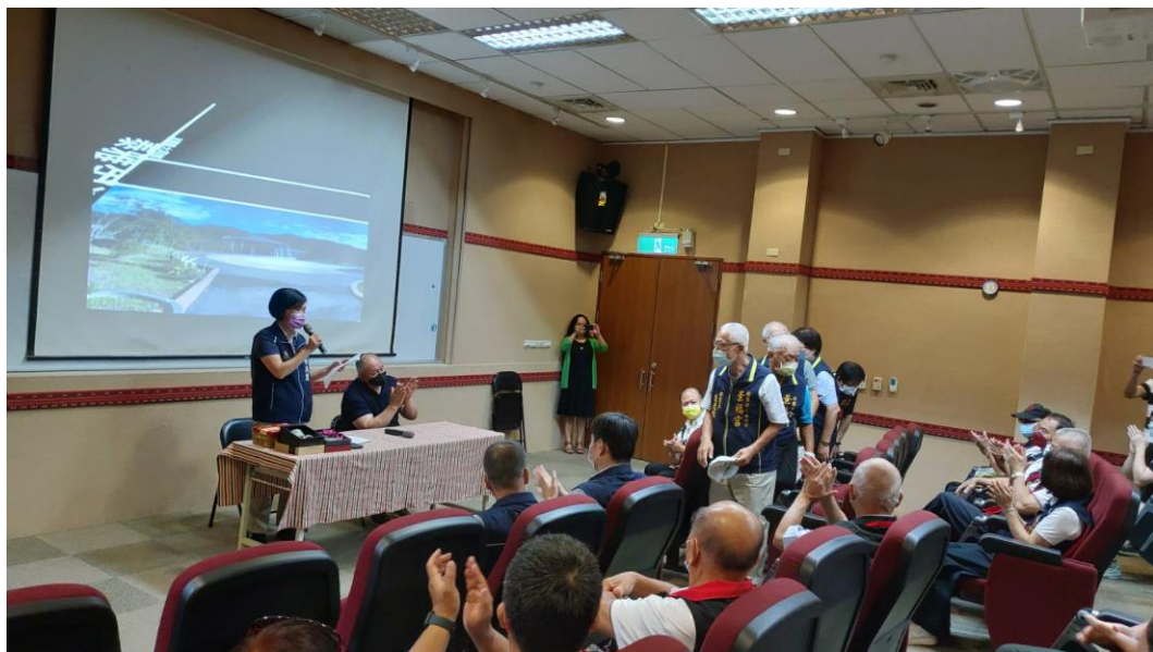
相片內容說明：區長致感謝詞暨介紹隨行人員