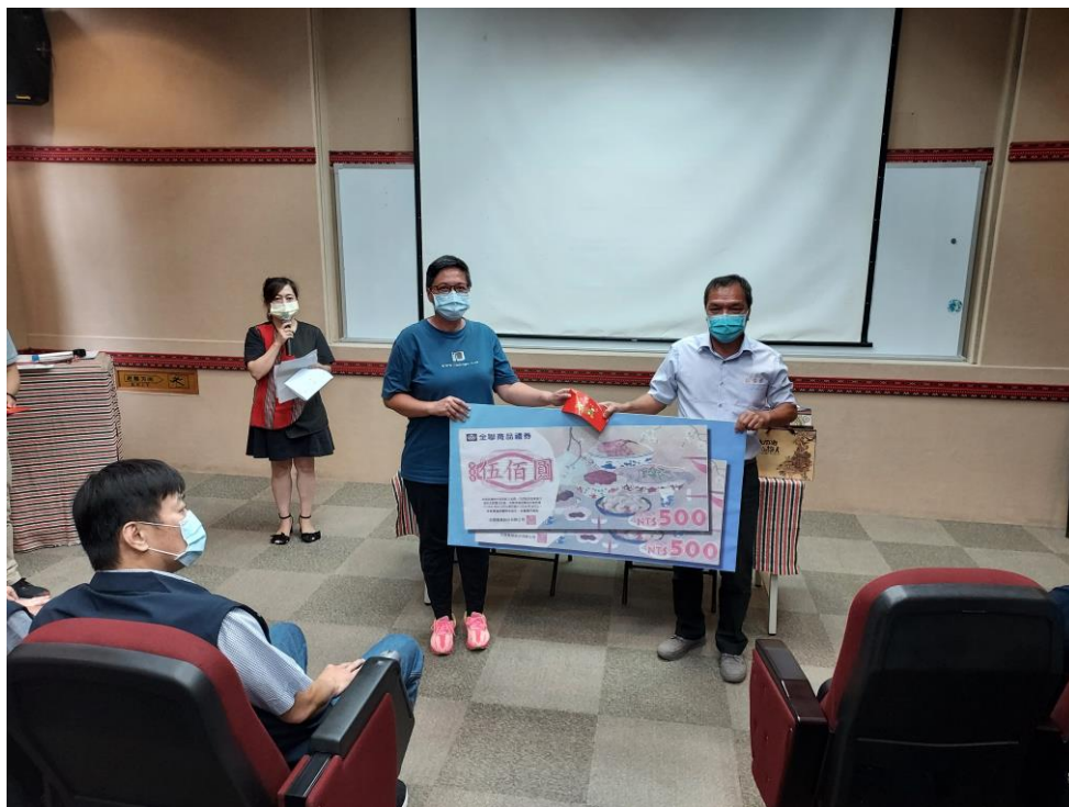
相片內容說明：愛心送暖-植福宮代表捐贈商品禮券