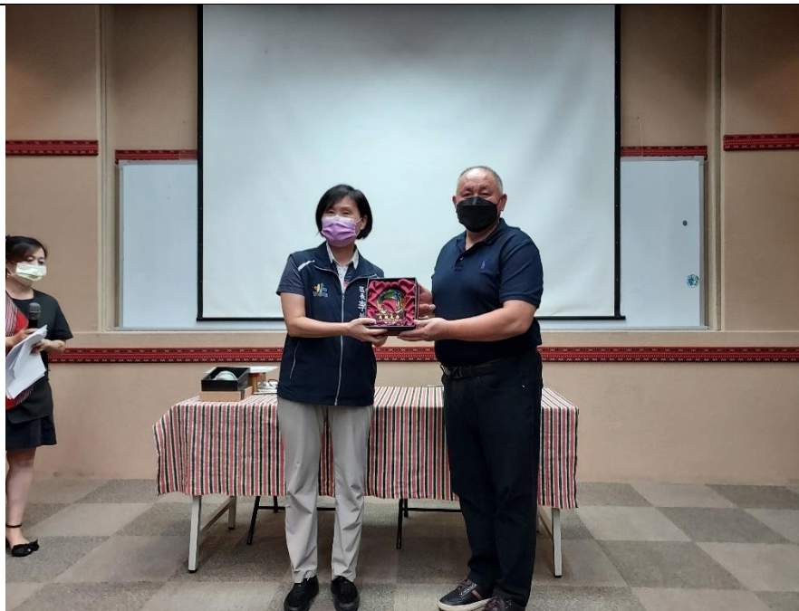
相片內容說明：區長贈與紀念友好獎座