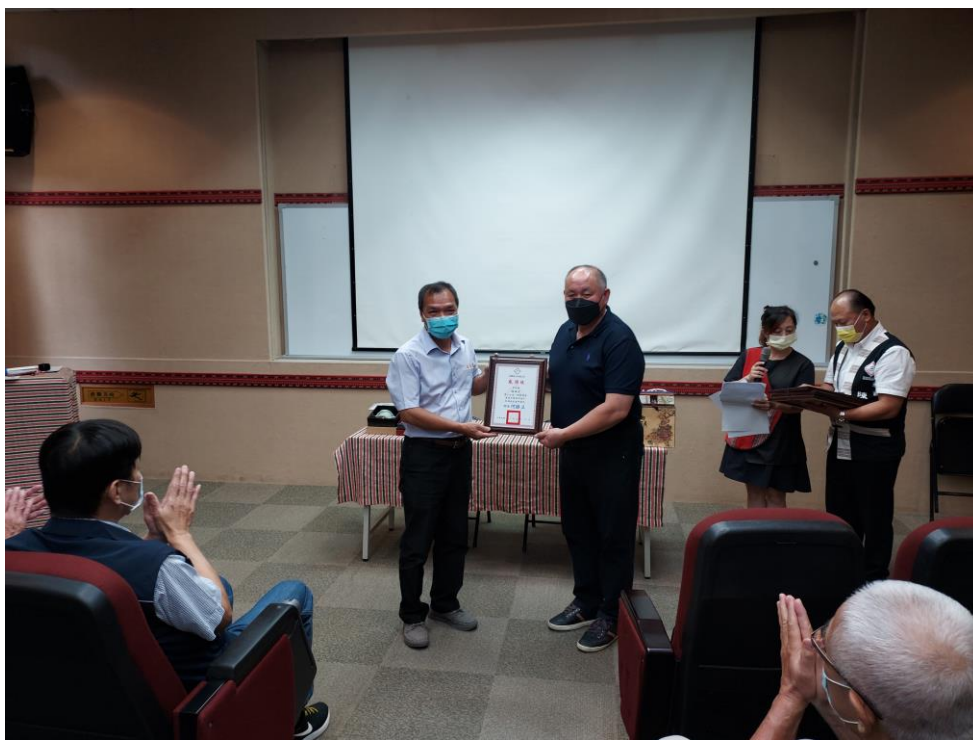
相片內容說明：鄉長致贈感謝狀給植福宮