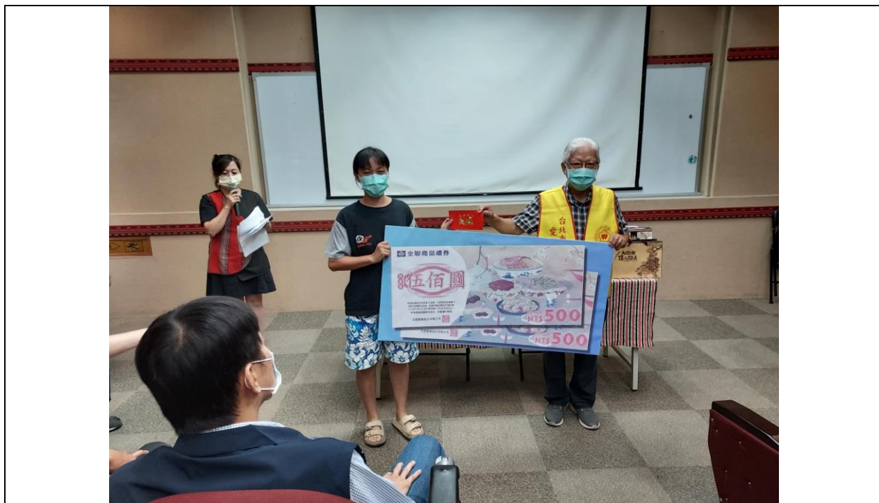
相片內容說明：愛心送暖-愛心行善會代表捐贈商品禮券