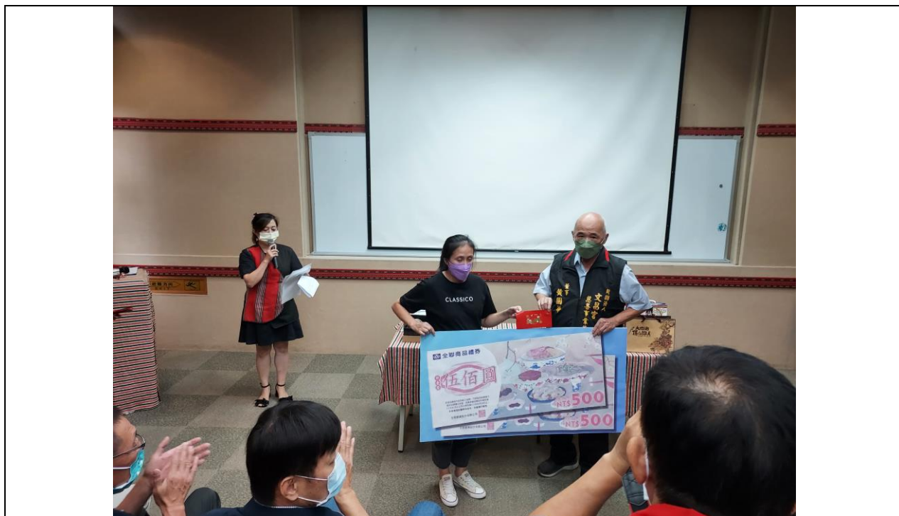
相片內容說明：愛心送暖-文昌宮代表捐贈商品禮券