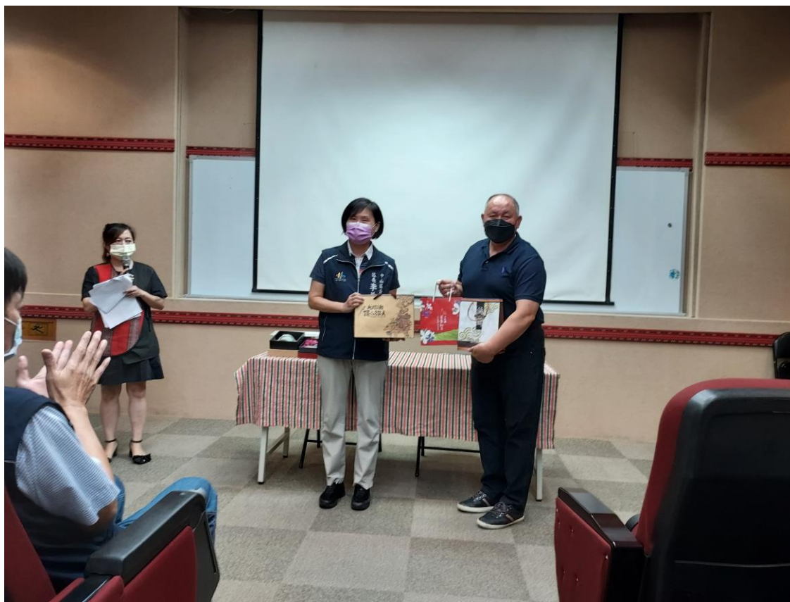
相片內容說明：鄉長致贈當地農特產品