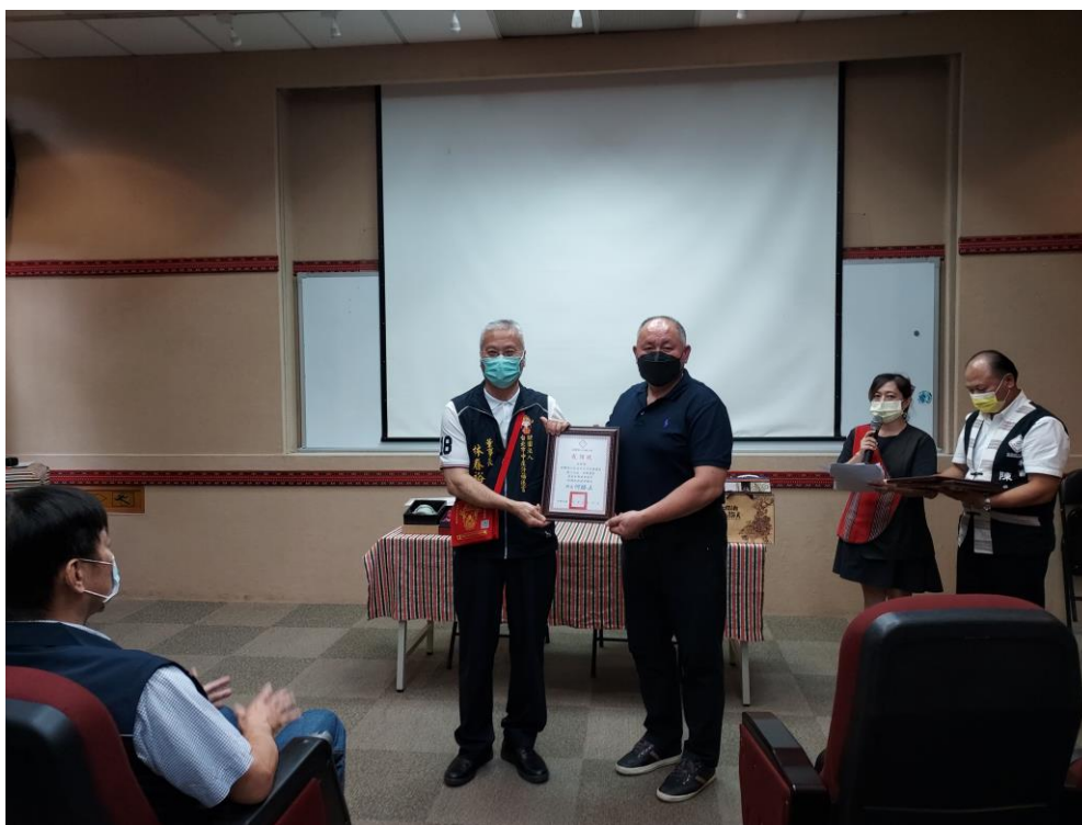
相片內容說明：鄉長致贈感謝狀給中庄仔福德宮