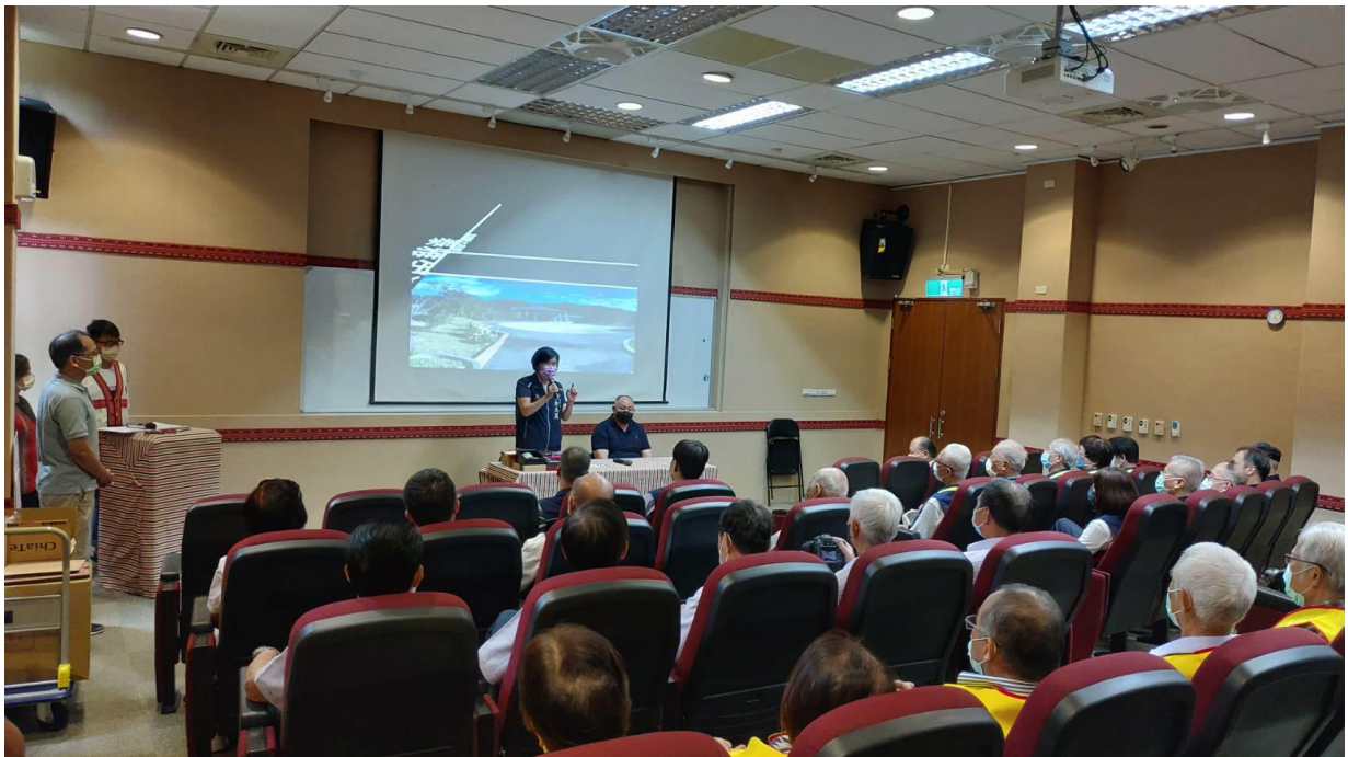
相片內容說明：業務交流