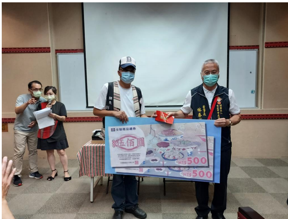
相片內容說明：愛心送暖-中庄仔福德宮代表捐贈商品禮券