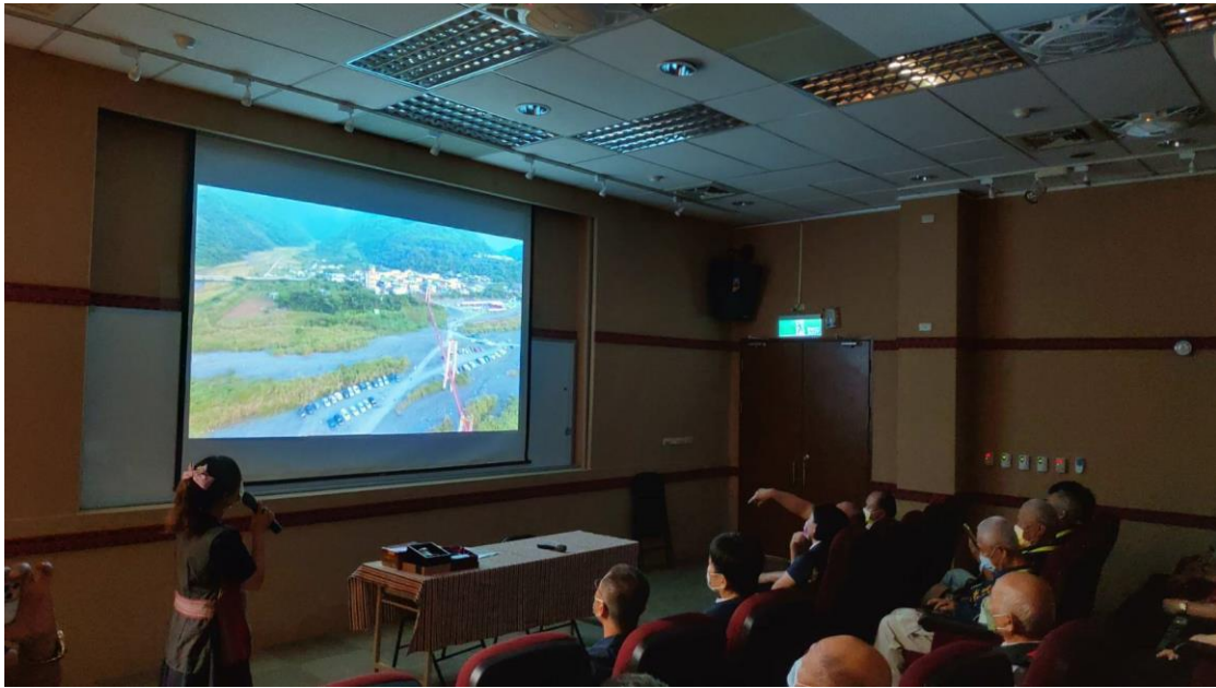
相片內容說明：業務交流