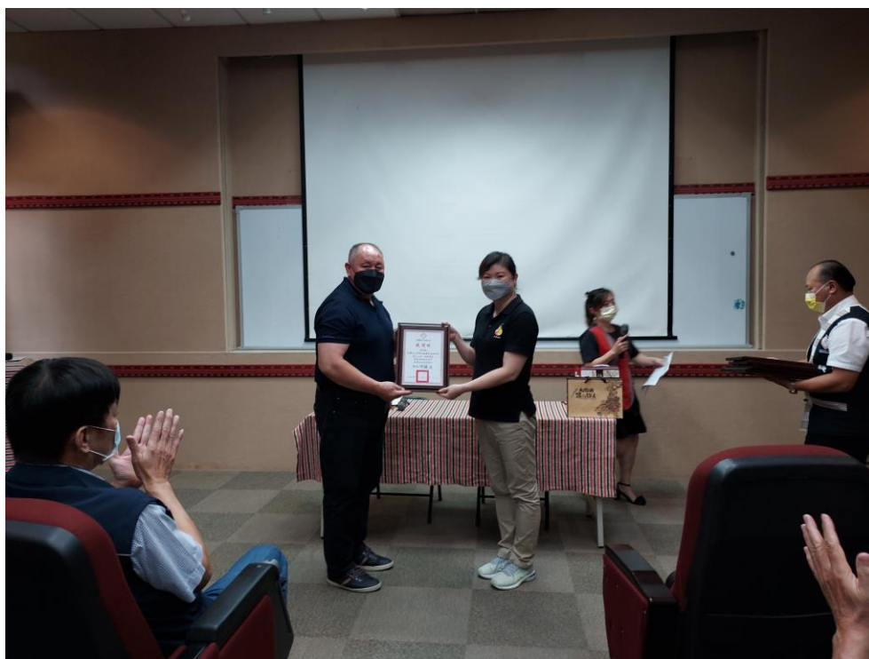
相片內容說明：鄉長致贈感謝狀給真如苑佛教會