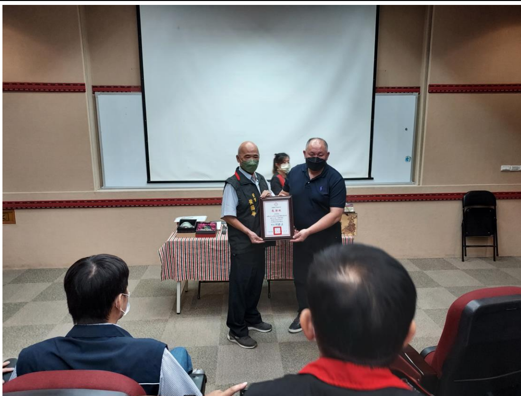
相片內容說明：鄉長致贈感謝狀給文昌宮