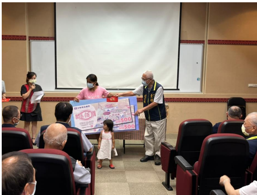
相片內容說明：愛心送暖-景福宮代表捐贈商品禮券