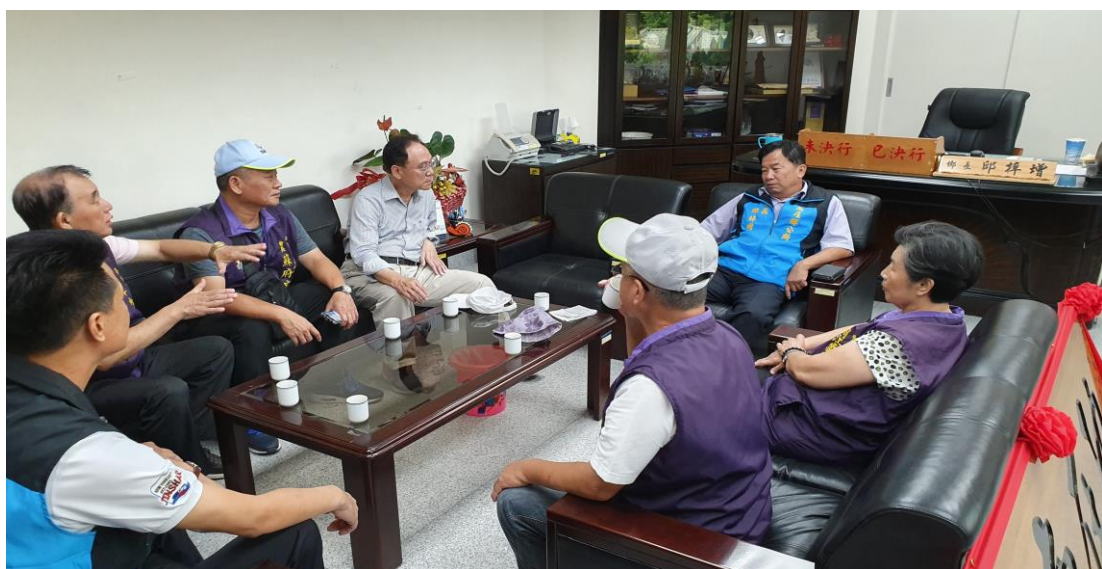
本區區長及里長與南庄鄉長進行交流研討