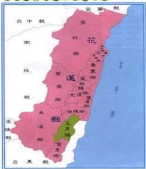
花蓮縣玉里鎮關係位置圖

玉里鎮首先納入行政區劃，是 1875 年（清光緒元年），當時稱璞石閣，歸卑南廳所轄。1917 年（日大正 6 年），東線鐵路通車到本鎮，璞石閣支廳改稱玉里支廳；璞石閣區改稱玉里區。1946 年（民國 35 年），玉里街改為玉里鎮，劃分為 23 里。1971 年（民國 60 年）區劃為現今的 15 里。