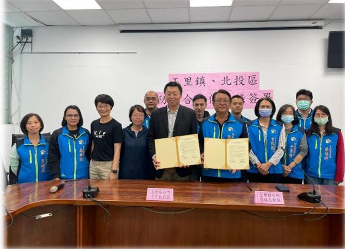
城市交流雙方進行合照。