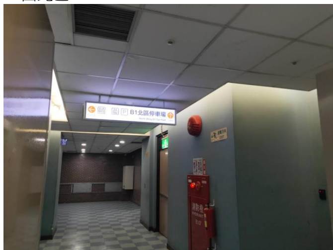
感應器 (可調亮度、時間、背景照明時間)