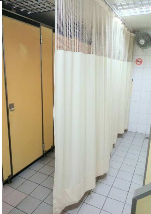
大便器及小便器兩區域僅用拉簾做分區，隱私性不足。