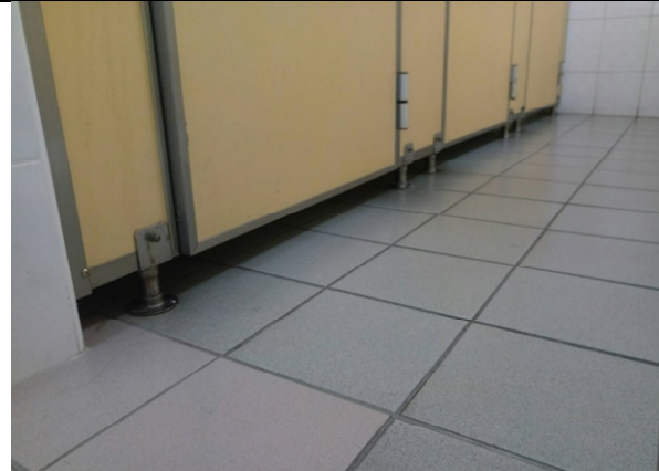
大便器廁間隔板之下部空隙皆大於1公分，使用上較無法達到隱私及安全之需求。