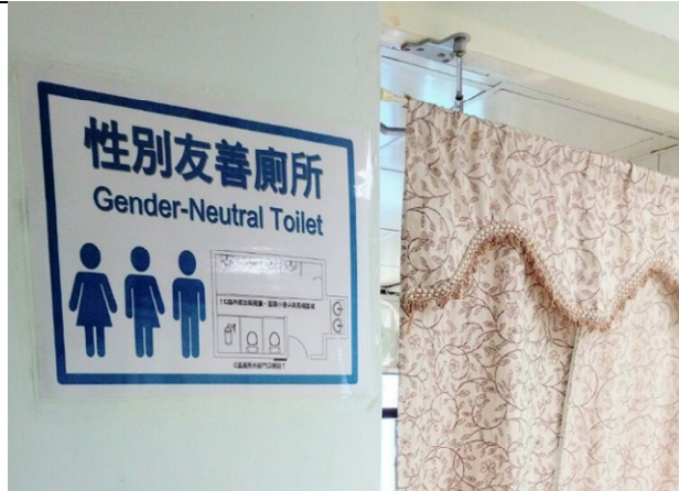
使用裙裝/褲裝標誌有善度不足且宣導、說明文字應再加強。