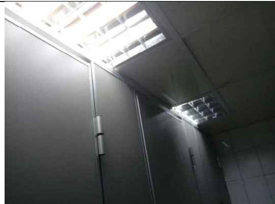
大便器廁間隔板之上部空隙皆小於1公分，以維護使用者隱私。