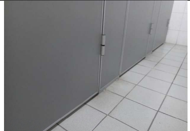
大便器廁間隔板之下部空隙皆小於1公分，以維護使用者隱私。