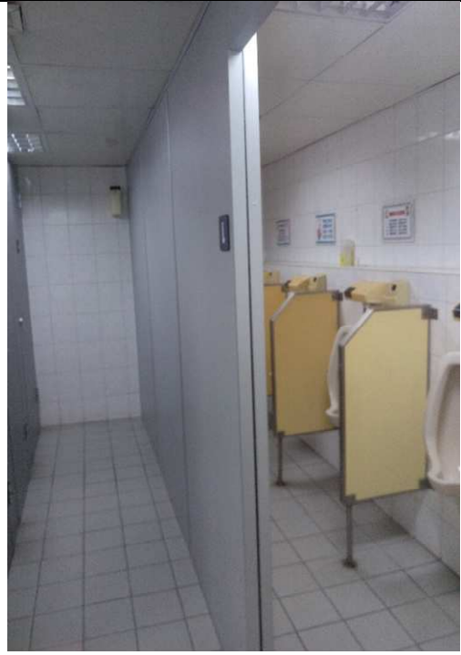
原有拉簾改為固定隔屏並縮小隔板之上、下部之空隙，以維護使用者隱私。