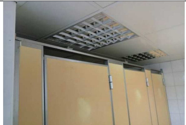
大便器廁間隔板之上部空隙皆大於1公分，使用上較無法達到隱私及安全之需求。