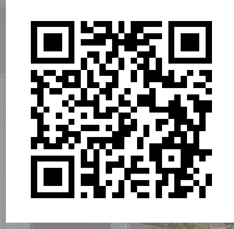
臺北市使用執照 查詢