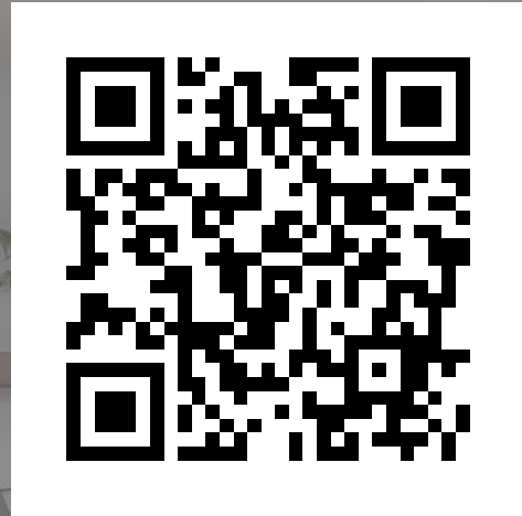
土地建物參考資訊 檔查詢