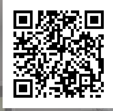
臺北市土地使用 分區查詢